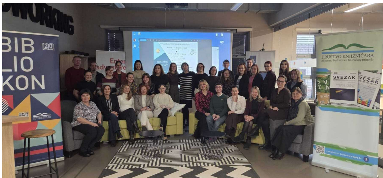
| Sudionici 7. stručnog skupa Bibliokon

Uz formalni dio programa, Bibliokon je, kao i uvijek, bio prilika za razmjenu iskustava o radu i aktivnostima u knjižnicama, raspravu o novim idejama te dogovaranje buduće suradnje među knjižnicama.