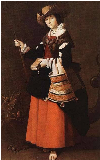
Slika 10. Francisco de Zurbarán, Sveta Margarita Antihijska, oko 1631., ulje na platnu, London, National Gallery.

Nasuprot tome, Francisco de Zurbarán sveticu (Slika 10) oblikuje s obilježjima otmjene pastirice, uvodeći ikonografski atribut knjige, koji se češće asocira sa svetom Katarinom. 56 Knjiga ovdje označava duhovnu kontemplaciju, ali i samu hagiografiju svete, sukladno njezinoj zavjetnoj molitvi za milost onima koji budu čitali njezinu povijest. Ovaj atribut korelira s aristokratskim kulturnim praksama plemkinja i posjedovanjem raskošnih molitvenika, što svjedoči o porastu ženskog vlasništva nad knjigama u kasnome srednjem vijeku. 57 Zurbaránova Margarita, s pastirskim štapom i putnim torbicama, oblikovana je uz naglašenu estetsku idealizaciju i atipičnu tamnu put, što predstavlja signifikantan otklon od tradicionalne kromatike njezina lika.