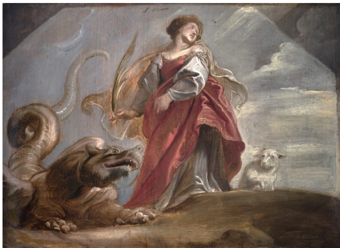
Slika 8. Peter Paul Rubens, Nacrt za stropnu sliku u isusovačkoj crkvi u Antwerpenu: Sveta Margarita (oko 1620., ulje na dasci, 33,1 × 46,3 cm, Antwerpen, The Phoebus Foundation.

ikonografskim repertoarom svete Margarete. Panofsky sugerira da navedeni element upućuje na moguću konfuziju s hagiografskim legendama o svetoj Marti i svetom Jurju. 51