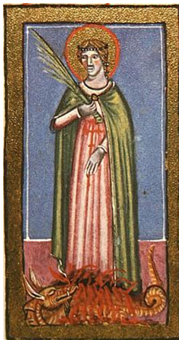
Slika 6. Sv. Margarita, Hrvojev misal, f. 171v; oko 1403, Istanbul, Topkapı Sarayı. (Izvor: Grabar, B., Nazor, A., & Pantelić, M. (Eds.). (1973). Missale Hervoiae ducis Spalatensis croatico-glagoliticum: Faksimil, transkripcija i komentar (V. Štefanić, ur.). Zagreb; Ljublj Graz: Staroslavenski institut „Svetozar Ritig“, Mladinska knjiga, Akademische Druck- und Verlagsanstalt

ca je prikazana frontalno s jasno istaknutim atributima: palmom, krunom i biserima. Palma, kao atribut zajednički svim mučenicima, simbolizira besmrtnost i trijumf nad zlom. 47 Motivi krune i biseri, koje Panofsky također pripisuje ikonografskom repertoaru svete Margarete, nose specifičnu semantiku. Kruna ( corona martyrum ) ovdje ne označava tek njezino zemaljsko aristokratsko podrijetlo kao kćeri poganskog patrijarha već primarno nebesku nagradu za nepokolebljivu vjeru. 48 Povezanost s biserima temelji se na etimologiji njezina imena ( margarita – biser), čija bijela boja simbolizira asketski ideal nevinosti. U srednjovjekovnoj simbolici biseru su se pripisivale apotropejske i ljekovite moći, uključujući sposobnost zaustavljanja hemoragije i jačanja duhovne snage, što se izravno reflektira u njezinu hagiografskom liku kao subjekta koji duhovno osnažuje zajednicu. 49