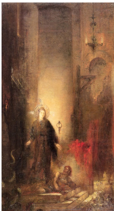
Slika 9. Gustave Moreau, Sveta Margarita, Musée Gustave Moreau, Pariz.

Na primjeru djela Gustavea Moreaua iz 1873. godine (Slika 9) uočava se specifičan prikaz izdvojene epizode drugog iskušenja: trenutak u kojem se sveti, nakon izbavljenja iz zmaja, ukazuje đavao u antropomorfnom liku. Moreau prikazuje Margaritu u činu aktivne dominacije nad zlom — ona nogom pritišće vrat demona, hvata ga za kosu i udara čekićem, čime se u simbolističkom izričaju potencira alegorijska dimenzija njezine duhovne pobjede. 55