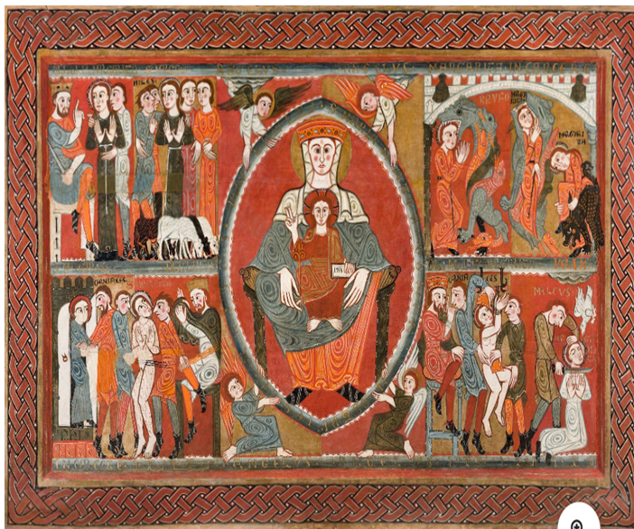
Slika 1. Oltar s prikazom svete Margarite iz Vilaseca – Radionice u Viktoriji (12. stoljeće).

patronažne zaštitnice roditelja. Vizualna naracija služila je kao katehetsko sredstvo za roditelje, poučavajući ih o modalitetima suočavanja s porođajnim bolovima koji se, analogno zmaju, interpretiraju kao prijeteća, ali inherentno savladiva sila. Staloženost svete unutar živog zmaja simbolički je potvrđivala njezinu moć nad opasnošću i učvršćivala njezinu ulogu zagovornice u trenutku partusa. 37