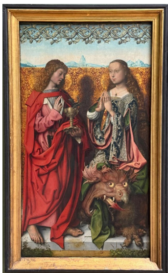
Slika 5. Oltar sv. Bartolomeja (oko 1500.), Alte Pinakotehk, München.

simbolički definira kao liturgijski kodificirana sfera. Margarita je predstavljena u uspravnom stavu, blago nagnute glave i ruku sklopljenih u molitvenu gestu, što naglašava njezinu pobožnu sabranost. Stilistički, svetica je prikazana sa svjetlom kosom, koja je u onodobnoj likovnoj praksi funkcionirala kao konvencionalni kôd ljepote, mladosti i čistoće, dosljedno ikonografskim obrascima djevičanskih svetica. 45 Odjevena je u raskošnu odjeću koja implicira njezino plemenito podrijetlo, a prikazana je u ključnom momentu izlaska iz zmajeva tijela. Zmaj je ovdje oblikovan kao pasivno, poraženo biće, čime se afirmira teološka poruka o pobjedi vjere nad demonskim silama i utvrđuje uloga svete Margarete kao nositeljice božanske protekcije.