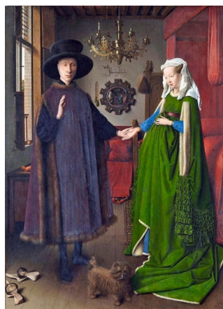
Slika 2. Jan van Eyck, Portret Arnolfinijevih (1434.), National Gallery, London.

kako je engleska kraljica Eleanor imenovala svoju kćer Margaritom upravo zbog invokacije svetice tijekom teškog poroda. Nadalje, djelo Vie de sainte Marguerite kanonika Wacea iz 11. stoljeća — koje se smatra prototipom hagiografske romanse u stihu — dodatno kanonizira njezino zagovornništvo. Wendy A. J. Laverock navodi kako su se njezini slikovni prikazi aplicirali na kopče pojaseva koji su se ritualno polagali na abdomen trudnica tijekom porođajnog procesa. U tom se semantičkom okviru može tumačiti i mala drvena skulptura na uzglavlju kreveta u Van Eyckovu Portretu bračnog para Arnolfini (1434.), gdje lik svetice bdije nad prostorom bračne intime (Slika 2). 39