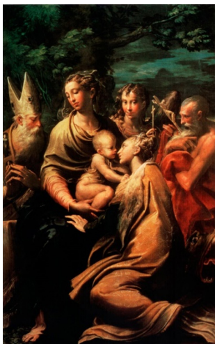
Slika 3. Parmigianino, (1529. – 1530.). Bogorodica s Djetetom i svetima Margaritom, Jeronimom i Petronijem . Pinakoteka Nazionale di Bologna, Bologna.

pojavljuje u ikonografskoj i tematskoj povezanosti sa svetom Katarinom Aleksandrijskom, što upućuje ne samo na ustaljeni obrazac njihova simultanog štovanja već i na sustavno vizualno udruživanje u sakralnoj umjetnosti.