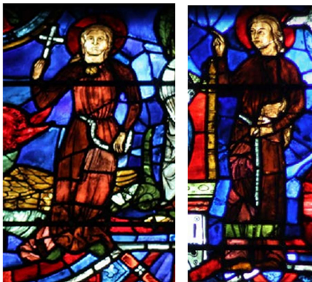
Slika 4. Vitraj iz katedrale u Chartesu s prikazom sv. Margarite i sv. Katarine (13. stoljeće).

pasivne patnje i interiorizirane duhovnosti. Pritom se u hagiografskim narativima i vizualnim ciklusima dodatno problematiziraju kategorije spola i seksualnosti, najčešće kroz dramaturgiju prijetnje narušavanju njihova virginiteta. 43 U tom je smislu osobito signifikantan vitraj smješten u južnoj kapeli ophoda katedrale u Chartresu, koji prikazuje živote svete Margarite Antiohijske i svete Katarine Aleksandrijske (Slika 4). Na ovome su vitraju eksplicitni prikazi mučenja izostavljeni iz vizualnog narativa; likovi svetica se reinterpreteraju na način da umjesto tijela koja trpe postaju duhovne pobjednice. Njihova se snaga očituje u vjeri, retorici i moralnoj postojanosti, a ne u somatskoj destrukciji, krvi i ranama. 44 Obje su mučenice prikazane u identičnom smeđem monaškom habitu s bijelim pojasom, čime se dodatno unificira njihov asketski identitet.