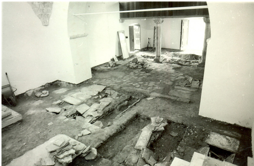
Sl. 11. Arheološki radovi u crkvi sv. Ante u Drnišu (MK – UZKB – KOS, Inv. br. 98689, autor Goran Nikšić, 20. studenoga 1990.)