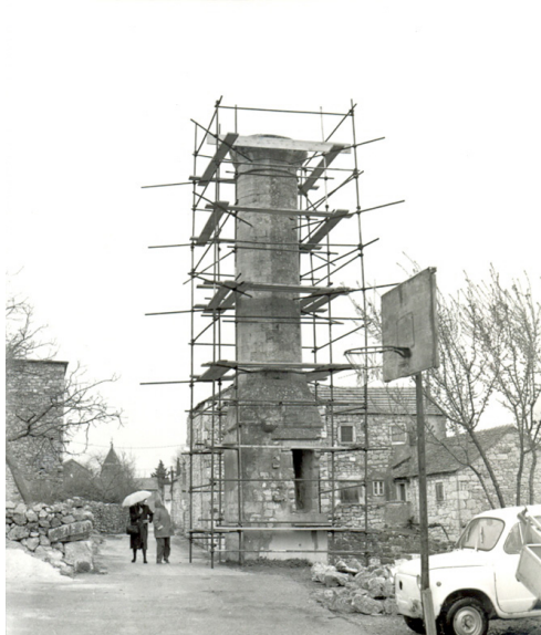
Sl. 7. Konzervatorsko-restauratorski radovi na minaretu 1989. godine