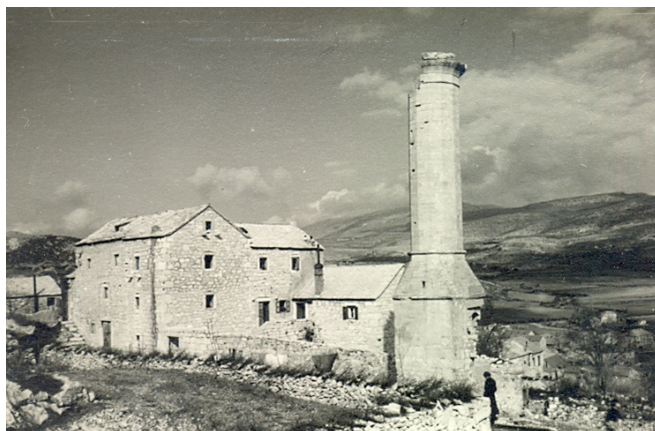
Sl. 1. Minaret u Drnišu 1957. godine

kamena muljike. Sačuvani minaret jedan je od ukupno četiri minareta koji su tijekom razdoblja osmanske vlasti (1522. – 1683.) pripadali različitim džamijama u Drnišu. Minaret u Drnišu sastoji se od kvadratne osnove (visine 3,90 m). Kvadratna baza se u središnjem dijelu postupno sužava u dvanaesterokutno tijelo minareta (visina 5,50 m) koje se u gornjem dijelu širi i završava s profiliranim vijen-