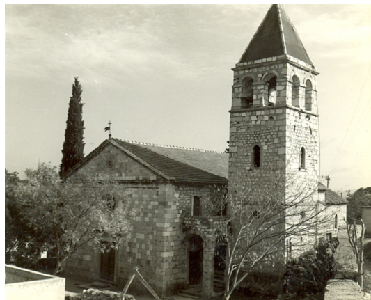
Sl. 2. Crkva sv. Ante u Drnišu 1977. godine (, zapadno pročelje,)