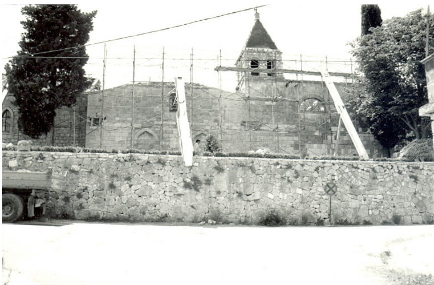
Sl. 8. Početak konzervatorsko-restauratorskih radova na crkvi sv. Ante

Uz faksimilnu obnovu kupole, a u sklopu trogodišnjih sanacijskih zahvata na crkvi sv. Ante, izvedeni su radovi na zapadnom i istočnom dijelu, gdje je postavljeno novo dvostrešno krovništvo koje je odgovaralo situaciji prije 1951. godine. Također, tijekom 1990. godine u unutrašnjosti stare džamije provedena su arheološka istraživanja u sklopu kojih je pronađeno nekoliko grobnica. Nažalost, dokumentacija i nalazi provedenih arheoloških istraživanja kao i izvješća o radovima na crkvi sv. Ante, nisu ostali sačuvani.