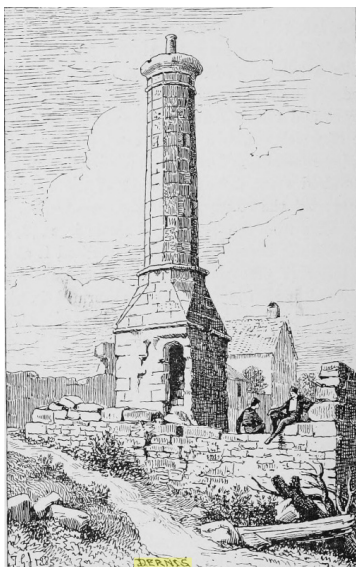
Sl. 3. Thomas Graham Jackson, Minaret u Drnišu (Thomas Graham Jackson, Dalmatia the Quarnero and Istria with Cettigne in Montenegro and the Island of Grado, volume II, London, 1887., 180 )

Iz Jacksonova opisa posebno je zanimljiv navod u kojemu kazuje kako se na vrhu osmanskog minareta nije nalazila puna ograda ( parapet ) nekadašnjeg šerefa , nego stup koji je služio mujezinu za pridržavanje u slučaju vjetrovitog vremena. U razdoblju između 1877. i 1887. godine uklonjen je dio sačuvane balustrade nekadašnjeg šerefa minareta. Nastavno na inicijativu iz 1877. godine prema kojoj je, među ostalim, bilo predviđeno i podizanje željezne ili kamene ograde oko minareta, na prikazu što ga je izradio Sir Jackson jasno je vidljivo da do podizanja ograde nikada nije došlo jer su uokolo sačuvanog minareta vidljivi samo ostatci ( ruine ) sazdani od relativno pravilnih kamenih blokova za koje možemo pretpostaviti kako predstavljaju dijelove nekadašnje džamije.