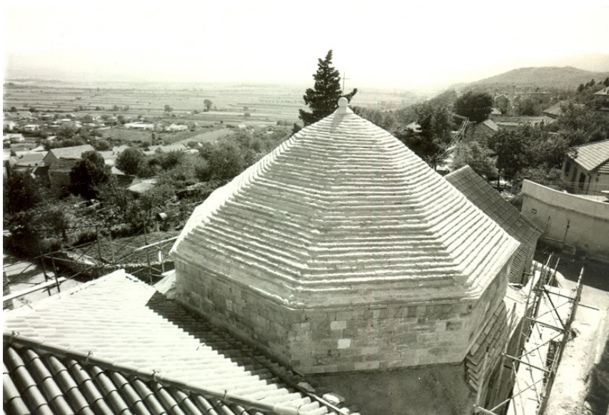
Sl. 10. Obnovljena kupola (, Kupola pokrivena kamenim pločama, 7. 9. 1990.)