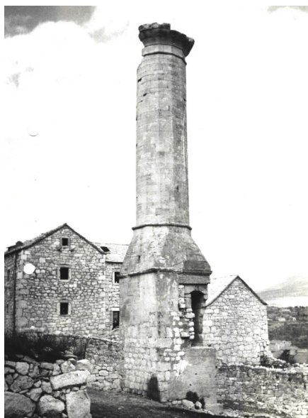
Sl. 4. Minaret prije konzervatorsko-restauratorskih radova 1967. godine (MK – UZKB – KOS, Drniš - Minaret: Izvještaj o radovima u 1981. godine, 26. II. 1982., dodatni slikovni materijali)

Za potrebe rekonstrukcije vijenca minareta, odnosno nekadašnjeg podnožja izvornog šerefa , upotrijebljen je identični kamen muljika koji je dopremljen iz sela Gradac. Kao investitori radova navode se Regionalni zavod za zaštitu spomenika kulture u Splitu i Skupština općine Drniš, a financijski izdaci procjenjuju se na otprilike 7000 dinara. 44