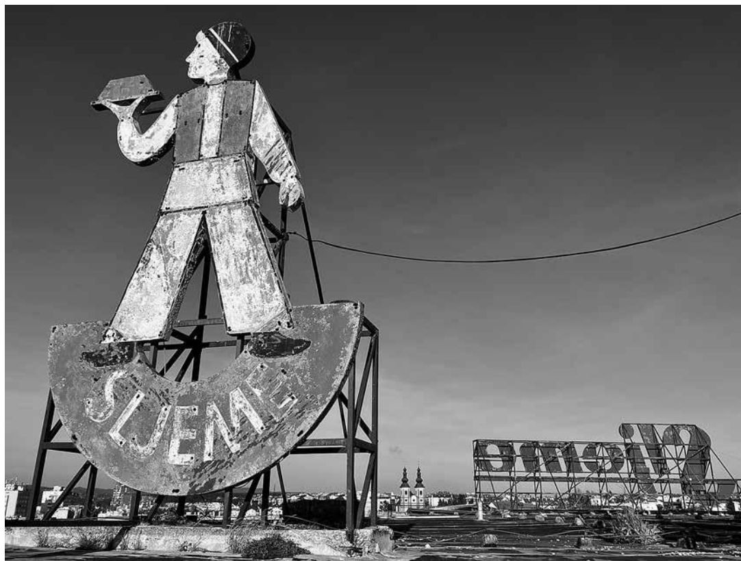
sl.3. Zaštitni znak tvornice Sljeme – Jankić, dječak u prigrorskoj narodnoj nošnji na krovu zgrade hladnjače unutar industrijskog kompleksa. Fotografirao Tomislav Mrčić (prosinac 2023.).

Uvod. Proces deindustrijalizacije u Hrvatskoj tijekom posljednjih desetljeća rezultirao je zapuštanjem brojnih industrijskih kompleksa, njihovim fizičkim propadanjem i postupnim nestajanjem, često bez sustavnog dokumentiranja i stručne valorizacije.