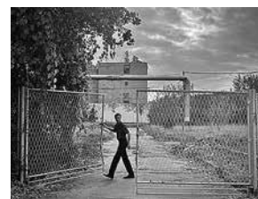
sl.16. Tijekom vođenih šetnji prostorom kompleksa „Sljeme”. Fotografirao Tomislav Mrčić (svibanj 2024.).

Osim šetnji, Muzej je organizirao i edukativne programe koji su potaknuli mlade generacije da prepoznaju značenje „Sljemena”.