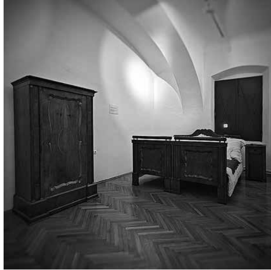
sl.14. Izložbena prostorija s namještajem spavaće sobe Ludwiga Wolfschütza. Fotografirao Kristijan Wöfl (lipanj 2025.).

Sam naziv izložbe u potpunosti se preslikava i na organizaciju muzejskog prostora za potrebe izložbe. Predmeti naglašavaju funkcionalnu prirodu namještaja i postavljeni su u odgovarajućem ambijentu, tako da odražavaju interakciju prostora i namještaja. Iako dio naše svakodnevice, izloženi namještaj svjedoči i o estetskoj vrijednosti zbirke Muzeja Slavonije. Autorica izložbe uspostavila je ravnotežu između historiografskoga i analitičkog pristupa predstavljajući predmete ad usum , otvorivši prostor za promišljanje i o obrtništvu u Osijeku, od autorskih djela do industrijske proizvodnje.