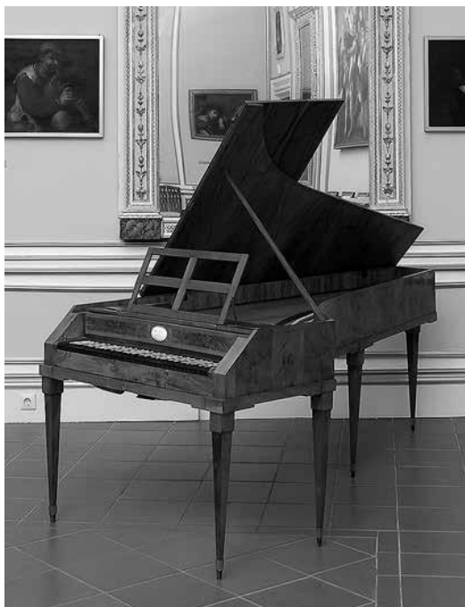
sl.1. Fortepijano (DUM KPM VR-57), Anton Walter, Beč, oko 1790.