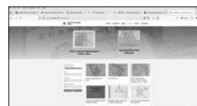
sl. 1. Naslovnica mrežnog kataloga Karte vojnogeografskih instituta u Hrvatskom povijesnom muzeju , https://kartevgi.hismus.hr/ (pristupljeno 4. travnja 2025.)

Osim karata, digitalizirana su i dva atlasa ( Atlas etničke strukture stanovništva na području Julijske Krajine 4 , inv. br. HPM-33349; ISTORISKI ATLAS / OSLOBODILAČ-KOG RATA / NARODA JUGOSLAVIJE / 1941-1945 , inv. br. HPM-32981) te jedan kartografski priručnik ( Übungsbücher für Unterricht im Kartenlesen , inv. br. HPM/PMH-15869) u izdanju bečke izdavačke kuće Artarie, ali u izradi Carskoga i kraljevskog vojnogeografskog instituta u Beču. Uz digitalizaciju, kartografska je građa stručno obrađena i katalogizirana te je dostupna na mrežnoj stranici e-kataloga www.kartevgi.hismus.hr (sl. 1.).