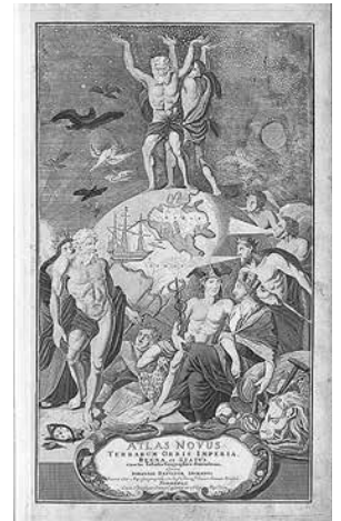
sl.5. Johannes Baptiste Homann, naslovnica Atlasa Novusa, Nürnberg.