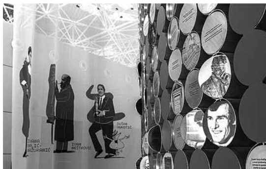
sl.1.-5. Muzejska zona u Međunarodnoj zračnoj luci Zagreb: prva izložba pod nazivom Zvijezde hrvatske povijesti: nebo im je granica. Upoznaj ih!

Dok zgrade Hrvatskoga povijesnog muzeja čekaju završetak obnove i svakodnevno se mijenjaju pod skelama, muzejski tim odlučio je ne čekati s pripovijedanjem priča. Umjesto zatvorenih vrata, ponudili su posjetiteljima „otvorenu” priliku: upoznati dio hrvatske povijesti – upravo na mjestu gdje se ljudi ionako kreću. Tako je nastala Muzejska zona , rezultat suradnje s Međunarodnom zračnom lukom Zagreb, zamišljena kao svojevrsna „kapsula kulture” među putnicima.