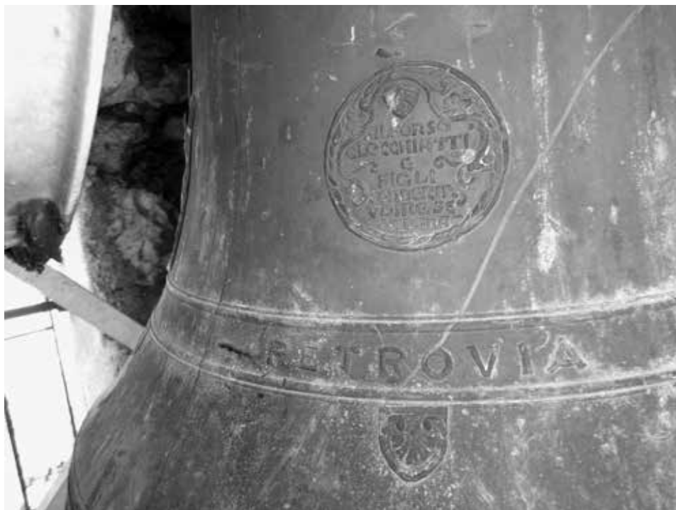
Figura 3: Emblema della fonderia di Alfonso Clocchiatti sulla campana di Petrovia fusa nel 1968.

La campana rivolta verso ovest è quella di dimensioni maggiori. Essa presenta un'altezza esterna di mm 710, maniglie escluse, e un diametro alla base di mm 840.