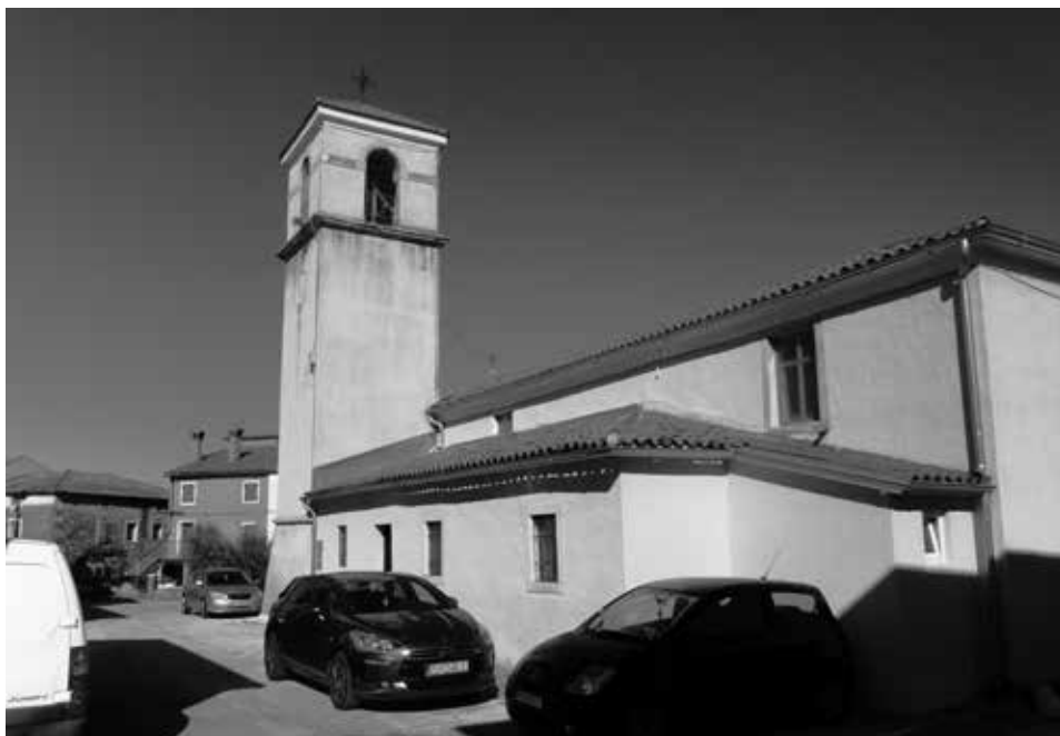
Figura 1: Chiesa di Petrovia, lato meridionale.

re" 2 . Il paese, tuttavia, era ricordato anche come residenza dei conti Marcovich 3 i quali, come attestato sul fronte della cappella cimiteriale del ramo di Umago, si fregiavano del titolo di "nobili di Antivari - Cavalieri di San Giacomo". Il loro arrivo in Istria sarebbe da collocare nel Tardo Medioevo, in relazione a uno dei ricorrenti momenti di instabilità politica dei Balcani meridionali. È verosimile che il capostipite non giungesse isolatamente, ma come capo di un gruppo più ampio, composto da diverse famiglie, secondo una dinamica insediativa ben attestata 4 .