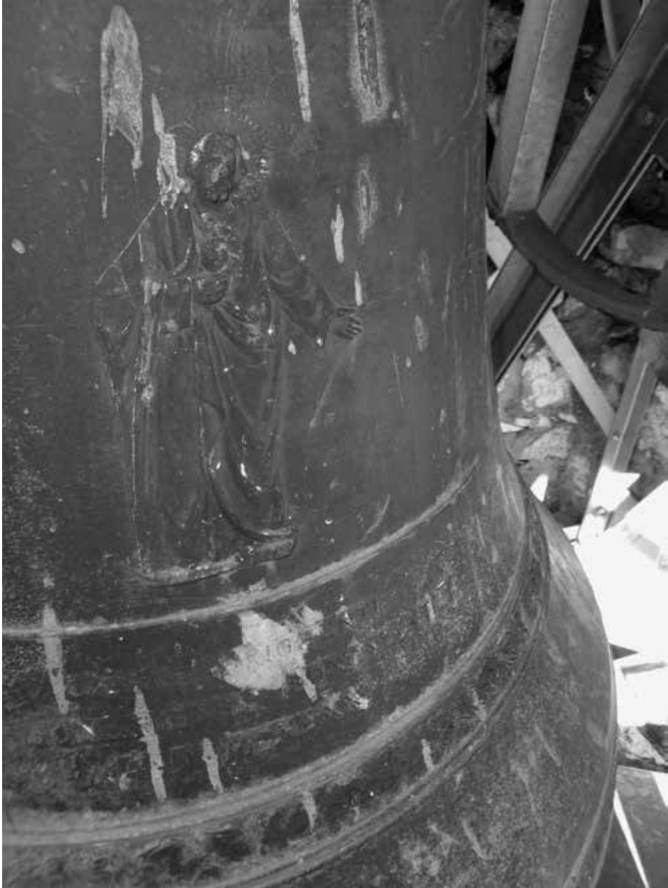
Figura 4: Immagine del Cristo con il Sacro Cuore sulla campana di Petrovia del 1968.