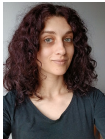
Slika autorice: Vivien Virag

Ovaj je članak izrađen prema diplomskom radu pod naslovom Nasljeđivanje boje kunića, obranjenom u Zavodu za uzgoj životinja i stočarsku proizvodnju 26. rujna 2025. godine na Veterinarskom fakultetu Sveučilišta u Zagrebu. Diplomski rad dostupan je na poveznici: https://repozitorij.vcf.unizg.hr/object/vcf:1491