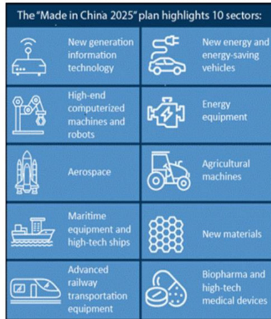
Figure 1. China's Industrial Priorities (2015-2025)

Source: Notice of the State Council on Issuing "Made in China 2025," May 8, 2015, Guofa [2015] No. 28.