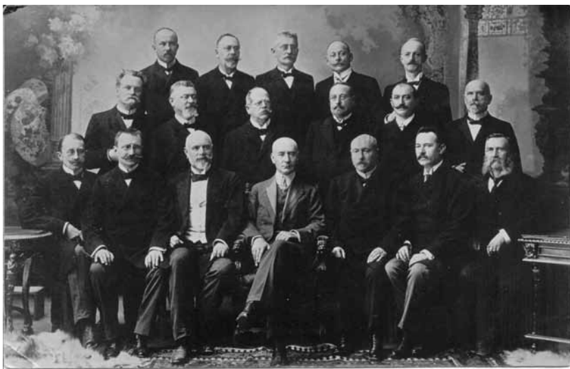
Slika 8. Skupština ravnatelja gimnazija raznih gradova, održana u Zagrebu 12. srpnja 1908.