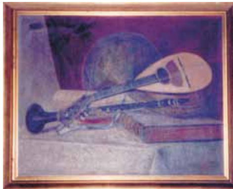
Slika 9. i 10. Uljene slike Gustava Fleischera, Bjelovar, oko 1890.

Najstarija Gustavova kći Ida i Stjepan imali su dvoje djece, kćer Vlastu i sina Raoula. Oboje supružnika imali su izraziti dar za slikarstvo i naslikali su mnoge slike, većinom u ulju. Sačuvan je tek manji dio tih slika. U njihovu su se domu također povremeno sastajali prijatelji udruženi smislom za umjetnost, slično kako je Ida bila naučena u roditeljskom domu. Pričalo se, raspravljalo, filozofiralo i muziciralo. Ida je izvrsno svirala glasovir. Prema pričanju moje majke na njihove prijateljske sastanke