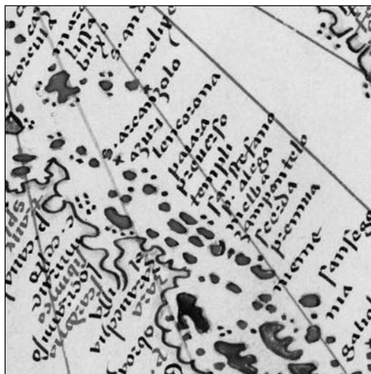
Sl. 2. Zadar i otoci ispred njega na portolanu Bartolommea dalli Sonettija iz 1485. godine, na www.nmm.ac.uk/collections/explore/chartzoom.cfm/imageID/f1603