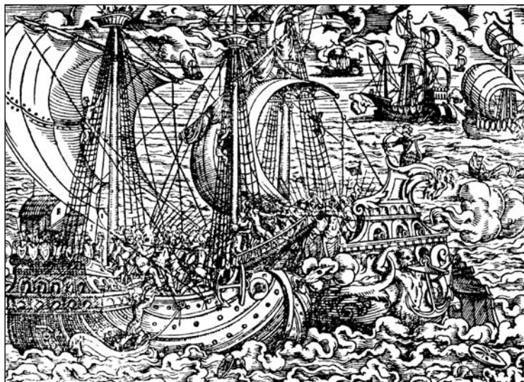
Sl. 3. Prikaz brodova iz Feyerabendovog zbornika: Reyßbuch deß heyligen Lands, iz 1584., str. 1r