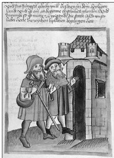
Sl. 1. Dva njemačka hodočasnika, iz: Martinus Oppaviensis, Chronicon pontificum et imperatorum, str. 131r, Diebold Lauber oko 1460., na: http://digi.ub.uni-heidelberg.de/cpg137/0253