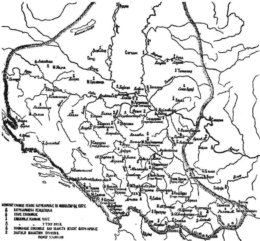
Pečka patrijaršija 1557.