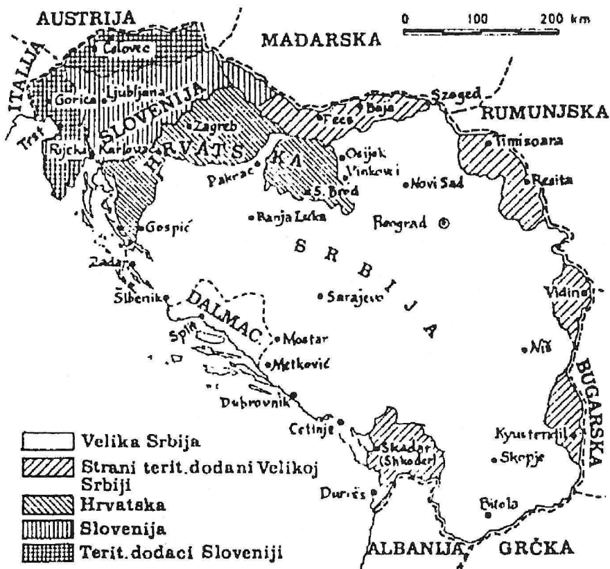
Homogena Srbija po Moljeviću 1941.

Novije viđenje granica Velike Srbije ilustrirano je skicom iz velikosrpske programatske brošure objavljene početkom 1991 (slika 4).