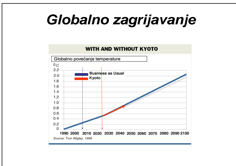
Slika 1: Globalno zagrijavanje

aktivnostima globalnog očuvanje okoliša. Drugo je pitanje koliko je obveza pravedna.