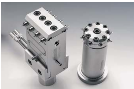
SLIKA 16 - Nova mlaznica HPS III-MH

Tvrtka Ewikon na sajmu je predstavila novu mlaznicu za vruće uljevne sustave s izravnim bočnim položajem ušća za kalupe s više kalupnih šupljina. Nova mlaznica HPS III-MH (slika 16) prikladna je za zahtjevne primjene u medicini – za injekcijsko prešanje dugih, tankih i cjevastih otpresaka kao što su injekcije, pipete, razna ambalaža itd.