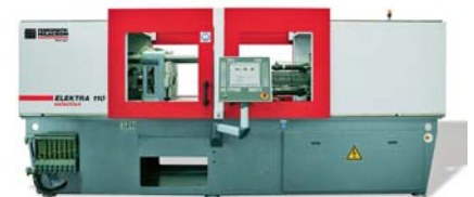
SLIKA 11 - Ubrizgavalica ELEKTRA selection 110

Na sajmu je predstavljena hibridna ubrizgavalica CAP-TEC 200 XL , koja je nastavak modela CAP-TEC . Ubrizgavalica je namijenjena prije svega izradi ambalaže. Na raspolaganju su sile držanja kalupa 2 000, 3 000 i 4 000 kN.