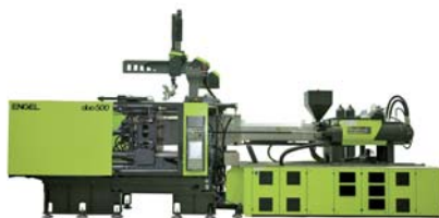
SLIKA 6 - Ubrizgavalica ENGEL duo pico

U Engelu su u posljednje vrijeme zaključili kako treba za ubrizgavalicama sila držanja kalupa od 5 000 do 7 000 kN ubrzano raste, uz istodobni porast zahtjeva korisnika koji žele prilagodljive i sigurne ubrizgavalice. Stoga su razvili i na sajmu prikazali ubrizgavalicu oznake ENGEL duo pico (slika 6). Riječ je o maloj, kompaktnoj, brznoj i sigurnoj ubrizgavalici. Vrijeme praznog hoda u radu te ubrizgavalice iznosi samo 2,6 sekundi, zbog čega je to trenutačno najbrža ubrizgavalica s dvije ploče na tržištu. Hidraulično-mehanički sustav zatvaranja kalupa omogućuje manju potrošnju energije, kraća vremena praznih hodova, više sile držanja kalupa i veću čvrstoću ploča.