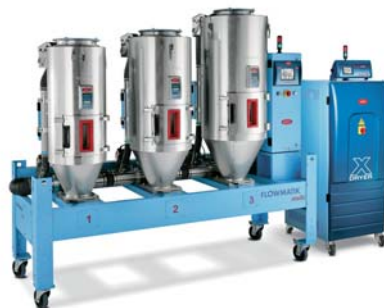
SLIKA 13 - Sustav Flowmatik

Tvrtka je na sajmu predstavila sustav Flowmatik (slika 13), koji postavlja nove standarde pri sušenju granulata. To je ujedno prva faza u preradi koja ima ključni utjecaj na vrijeme ciklusa postupaka prerade, kvalitetu proizvoda, uporabu energije i proizvodnost procesa. Sustav može istodobno nadzirati do 32 radna mjesta, pri čemu poslužitelj unosi samo dva parametra – vrstu uporabljenog polimera i potreban protok materijala. Sustav Flowmatik multi sadržava bazu podataka za 40 vrsta polimera, pri čemu korisnik može dodati podatke za još 40 materijala. U kombinaciji sa sustavom Mowis moguće je sušenje na pet sustava posluživanja, od kojih svaki ima od 2 do 32 radna mjesta. Flowmatik upravlja sustavom za distribuciju zraka za sušenje na više radnih mjesta istodobno kapaciteta 30 do 1 500 dm 3 . Sustav omogućuje racionalni utrošak energije za sušenje, jer za sušenje kilograma materijala troši manje od 48 W, a to ujedno smanjuje proizvodne troškove.