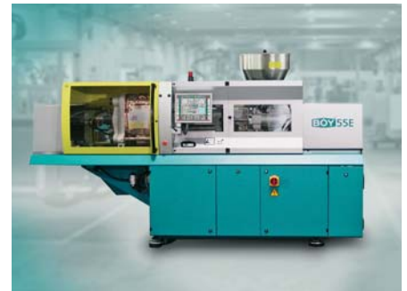
SLIKA 10. Ubrizgavalica BOY 55 E

ve i niža cijena ubrizgavalica. Komponente su kvalitete na razini serije ELEKTRA evolution , iako nisu na raspolaganju sve funkcije. Takav pristup omogućuje da svatko sastavi optimalnu ubrizgavalicu ELEKTRA selection prilagođenu svojim potrebama. Moguć je pri tome izbor modela sa silama držanja kalupa 500, 750 i 1 100 kN (slika 11), uz izbor triju jedinica za ubrizgavanje. Cijene ubrizgavalice kreću se od 54 100 € naviše, a rok dobave je šest do osam tjedana.