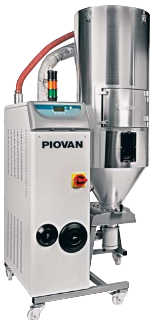
SLIKA 12 - Sušilo HR300 u izvedbi s jednim lijevkom

Sušilo HR300 (slika 12), s protokom zraka od 300 m 3 /h, omogućuje brojne prednosti uporabe serije HR : radi na električnu energiju, što znači da izostaju dodatni troškovi zbog priključka rashladne vode ili stlačenog zraka, potrošnja energije smanjena je za 50 %, jednostavan pristup do svih vitalnih dijelova, sprječavanje nakupljanja prašine i onečišćenja materijala itd. HR300 može djelovati u kombinaciji s lijevkom kapaciteta 800 litara, a opremljen je uređajima za inteligentni nadzor energije (IES) i inteligentno sušenje materijala (IMD) . Nova sušila rabe Silikagel , koji omogućuje postizanje vrijednosti rosišta do – 10 °C. Kako bi se postigla rosišta koja zahtijevaju konstrukcijski polimeri (do – 50 °C), razvijen je poseban postupak sušenja materijala koji se temelji na većem broju sita na unutrašnjoj površini sačastih lopatica rotora.