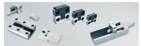
SLIKA 14 - Novosti u programu tvrtke Meusburger

Austrijska tvrtka Meusburger na sajmu je svojoj bogatoj ponudi normalija za kalupe dodala nekoliko novosti: pločasti klinasti sustav za povlačno otvaranje kalupnih ploča kod kalupa s tri ploče i novi sustav kliznika sastavljen od međusobno prilagođenih standardnih elemenata. Ta jedinica s nosačem bočne vodilice idealno je rješenje za kalupe s postranim otvaranjem. Osim toga predstavili su i element za centriranje koji omogućuje horizontalnu ugradnju i time uštedu na prostoru. Ponuda je proširena i na području okruglih profila – prethodno obrađenih i žarenih, a na raspolaganju su od materijala: 1.1730, 1.2311, 1.2312, 1.2343 i 1.2767.