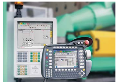
SLIKA 3 - Upravljačka jedinica Selogica za upravljanje 6-osnim Kuka robotom

ubrižgavalice uključivala je i integriran sustav temperiranja kalupa. Gotove je otpreske iz kalupa vadio i naknadno obradio potpuno automatizirani 6-osni robot tvrtke Kuka , a za programiranje svih gibanja korištena je upravljačka jedinica Selogica (slika 3).