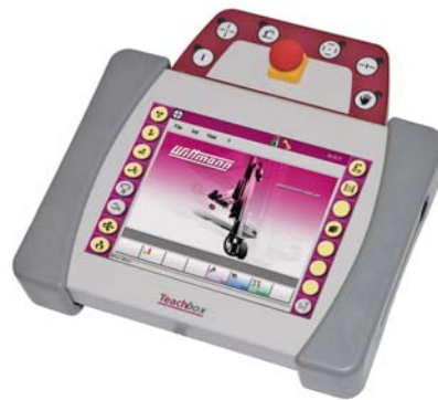
SLIKA 9 - Sučelje upravljačkog sustava Wittmann R8

svjetlo dana ugledao na sajmu K'07 , a u međuvremenu se dokazao pouzdanosti u mnogim zahtjevnim primjenama. Od sajma Fakuma 2008 nadalje svi Wittmannovi servoroboti serije W8xx bit će opremljeni R8 upravljanjem. Novi upravljački sustav Wittmann R8 robot control jamči jednostavnu uporabu i brojne funkcije, uz vrlo jednostavno i intuitivno korisničko sučelje. Novi sustav omogućuje upravljanje robotima na različitim razinama, ovisno o predznanju poslužitelja. Time je pokrivena široka paleta funkcija, od jednostavnih pick-and-place sekvencija do vrlo zahtjevnih primjena i opsežnih programa te mogućnosti programiranja do 12 numeričkih osi.