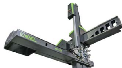
SLIKA 7 - Robot ENGEL ERC 43

Liniju njihovih linearnih robota dopunio je robot ENGEL ERC 43 (slika 7).