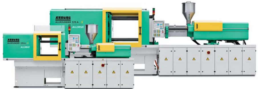
SLIKA 1 - Ubrižgavalice serije A s oznakom energijske učinkovitosti e^2

Na sajmu su predstavljene četiri ubrizgavalice oznake e , dvije s električnim pogonom iz serije A i dvije s hidrauličnim pogonom iz serije S . Ubrižgavalice Allrounder 920 S 5000-4600 i Allrounder 570 A nude mogućnost mjerenja potrošnje energije i prikaz rezultata na zaslonu ubrizgavalice. Poslužitelj ubrizgavalice tako može jednostavno voditi evidenciju i analizirati prosječnu i trenutačnu potrošnju energije tijekom procesa injekcijskog prešanja. Dobiveni podaci omogućuju općenito optimi-