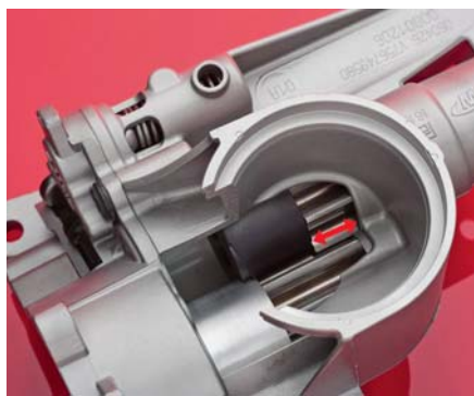
SLIKA 19 - Element zupčaste pumpe načinjen od materijala Ultrason KR 4113

temperaturama, npr. cijevi za vruću vodu, prozorski profili itd.