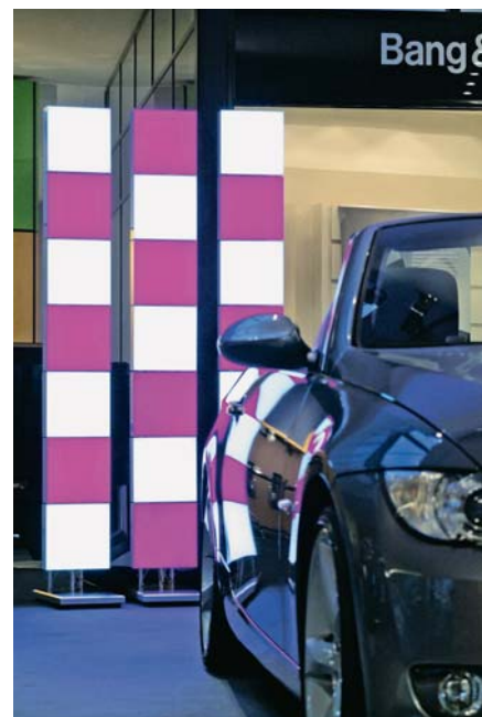
SLIKA 18 - Reciklat Levblend

Tvrtka je predstavila novi reciklat nazvan Levblend (polikarbonat + akrilonitril/butadien/stiren) (slika 18). Novi reciklat pomoći će pri smanjivanju troškova u automobilskoj industriji jer je jeftinija i sigurnija alternativa postojećim materijalima. Primjeren je za izradu spojnih dijelova, dijelova karoserije te za prednja i stražnja svjetla.