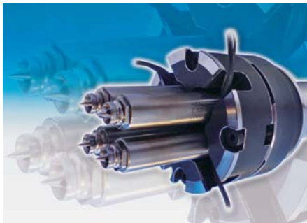
SLIKA 15 - Nova mlaznica s četiri ušća Quattro Z3280

Predstavljen je i vrući uljevni sustav H4015 . Sustavi iz te serije vrlo su traženi jer su izrađeni po mjeri i sastavljeni tako da ih korisnik samo montira u kalup. Dimenzijska stabilnost i brtvljenje između mlaznica i razdjelnika su zajamčeni.