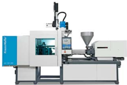
SLIKA 4 - Električna ubrizgavalica AX 100-380

Električna ubrizgavalica AX zaokružuje ponudu ubrizgavalica tvrtke Krauss-Maffei , a unatoč bogatoj serijskoj opremi može se svrstati među cjenovno povoljnije ubrizgavalice, namijenjene prije svega za standardne primjere ubrizgavanja. Ušteda potrošnje električne energije iznosi kod ubrizgavalica serije AX do 60 %. Serija AX nalazi se u rasponu sila držanja kalupa od 500 do 1 300 kN. Ubrizgavalice odlikuje već provjeren klinasti sustav zatvaranja te jednostavnost rukovanja. Na izloženom primjerku AX 100-380 (slika 4) bio je integriran robot Krauss-Maffei LRX-50 (slika 5), koji s ubrizgavalicom čini potpuno samostalnu i automatiziranu proizvodnu ćeliju. Takva konfiguracija opreme omogućila je 25 % uštede u potrebnoj radnoj površini, a ušteda je ostvarena i na izostanku zaštitne opreme, senzora, zaštitnih ograda itd.