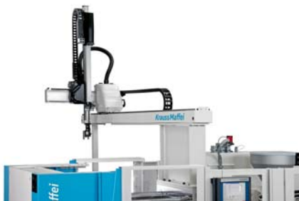
SLIKA 5 - Robot Krauss-Maffei LRX-50

Visoka točnost pri masovnoj proizvodnji odlikuje ubrizgavalicu EX 240-1000 Clean Form . U uvjetima tzv. čiste sobe na ubrizgavalici je bio postavljen kalup za izradu kućišta medicinskih injekcija s 48 kalupnih šupljina i vremenom ciklusa od samo 11 sekundi. Serija ubrizgavalica EX svrstava se u premijski razred ubrizgavalica i slovi kao primjer izvrsne kombinacije visoke brzine i točnosti.