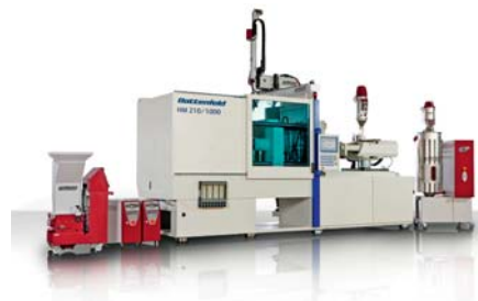
SLIKA 8 - Kompozicija opreme Wittmann-Battenfeld

Cjelovita ponuda (ubrizgavalica + sva ostala dodatna oprema) tvrtke Wittmann-Battenfeld nedvojbeno je velika konkurentna prednost (slika 8).