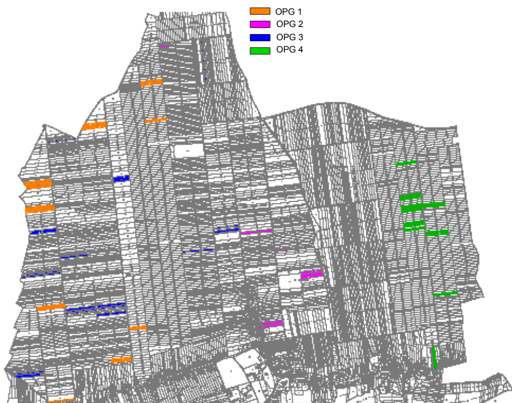
Crtež 1. – PRIMJER PROSTORNE RASCJEPKANOSTI POLJOPRIVREDNIH PARCELA (BOJA-JEDAN VLASNIK) Figure 1. – AN EXAMPLE OF SPATIAL DISPERSION OF AGRICULTURAL PARCELS (COLOUR-ONE OWNER)