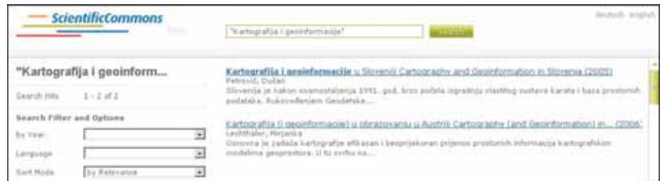
Fig. 1. Scientific Commons Sl. 1. Scientific Commons

Scientific Commons enables one to search all repositories with scientific and professional papers which support the Open Archive Initiative Protocol for Metadata Harvesting (OAI-PMH) and offer full text free of charge. Search can be done according to first and last names of au-