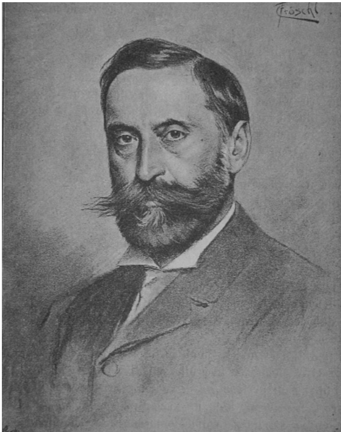
2) Iso Kršnjavi (1845. – 1927.), Kalendar Prijatelj naroda , Zagreb, 1897., str. 39.