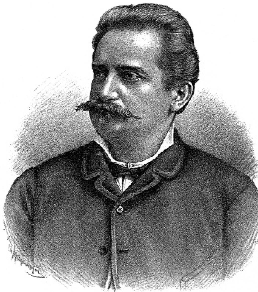
Ravnatelj Herman Bollé, graditelj prvostolne crkve

3) Herman Bollé(1845. – 1926.), Dom i svet , Zagreb, br. 15, 29. 7. 1892., str. 233.