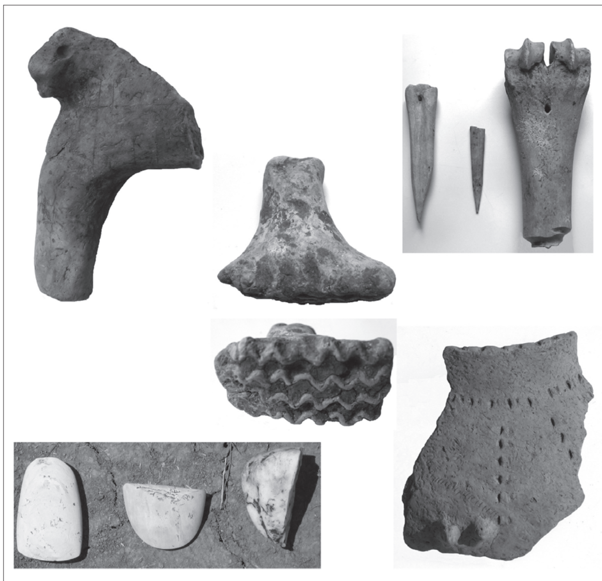
Sl. 3. Slavonki Brod, Galovo, posebni nalazi u radnoj zemunici 291