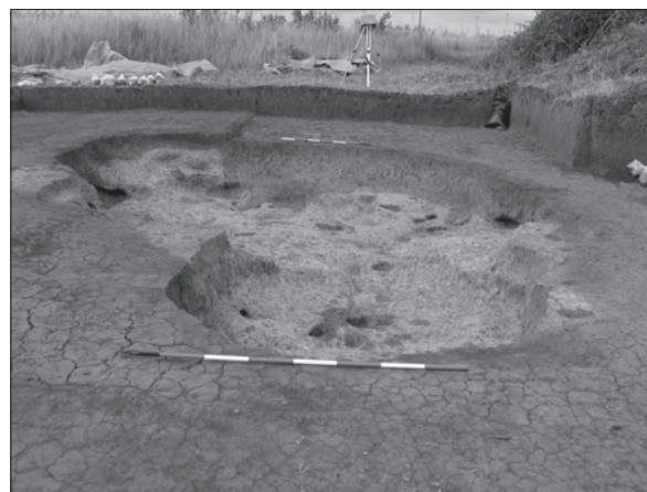
Sl. 2. Slavonki Brod, Galovo, radna zemunica 291

južnom dijelu terena. Za očekivati je da i ona ograđuje obredno-ukopni prostor (u njegovu južnom dijelu) od naselja, što će se vidjeti u daljnjim istraživanjima terena prema istoku. Ograda se proteže pravcem sjever – jug u dužini od 4,40 m i nakon toga lučno skreće pod pravim kutom prema istoku. Otkrivena je samo u dužini od 1 m i dalje se nastavlja u neistraženi dio terena. Na sjevernoj strani ograda započinje većim stupom promjera 30 cm. Uzduž ograde, čiji je rov širine 20 – 30 cm i oko 20 cm ukopan u zdravici, uz rub rova bili su ukopani naizmjenično s jedne i druge strane (istočne i zapadne) u razmacima od približno 50 i 100 cm stupovi (promjera oko 15 - 20 cm) koji su podupirali ogradu. Isto tako, i unutar same ograde na određenim razmacima od 50 ili 60 cm bili su dublje ukopani stupovi srednje debljine (oko 15 cm). U zapuni ograde nađeno je nekoliko ulomaka keramike koja je gorjela, što je najvjerojatnije posljedica vatre u kojoj je ograda izgorjela. Velika je vjerojatnost da su u svakom naselju nakon napuštanja naselja uz krovne urušene konstrukcije i drvene ograde stradale u vatri.