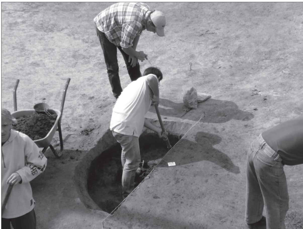
Slika 3. Rad na južnoj polovini latenske jame SJ 973, 974 u kv. f-X

Fig. 2. Detail of a vessel from the pit SU 979 in situ