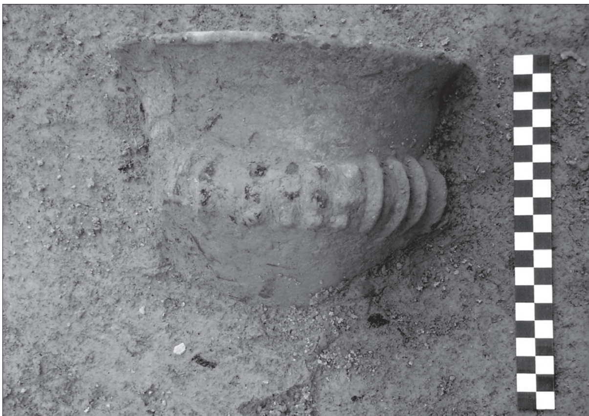
Sl. 2. Detalj posude iz zemunice SJ 979 in situ

Fig. 2. Detail of a vessel from the pit SU 979 in situ