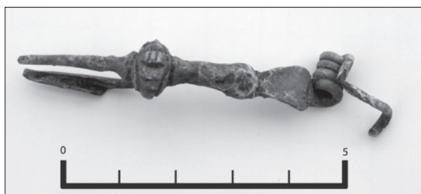
Sl. 2 Brončana fibula tipa Zvonimirovo iz groba LT 68