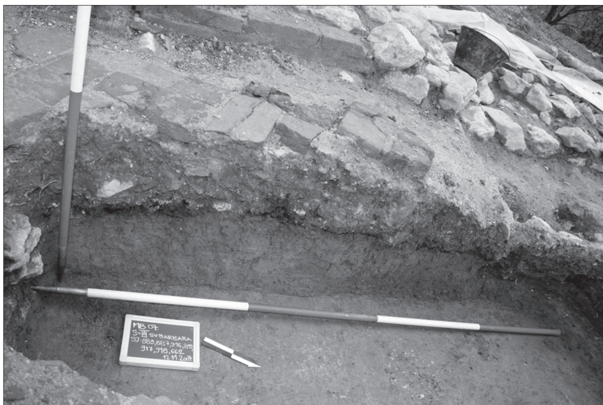
Sl. 3. Sloj gorenja vidljiv u profilu groba

Fig. 2. Modern age grave burials in the chapel of St. Barbara