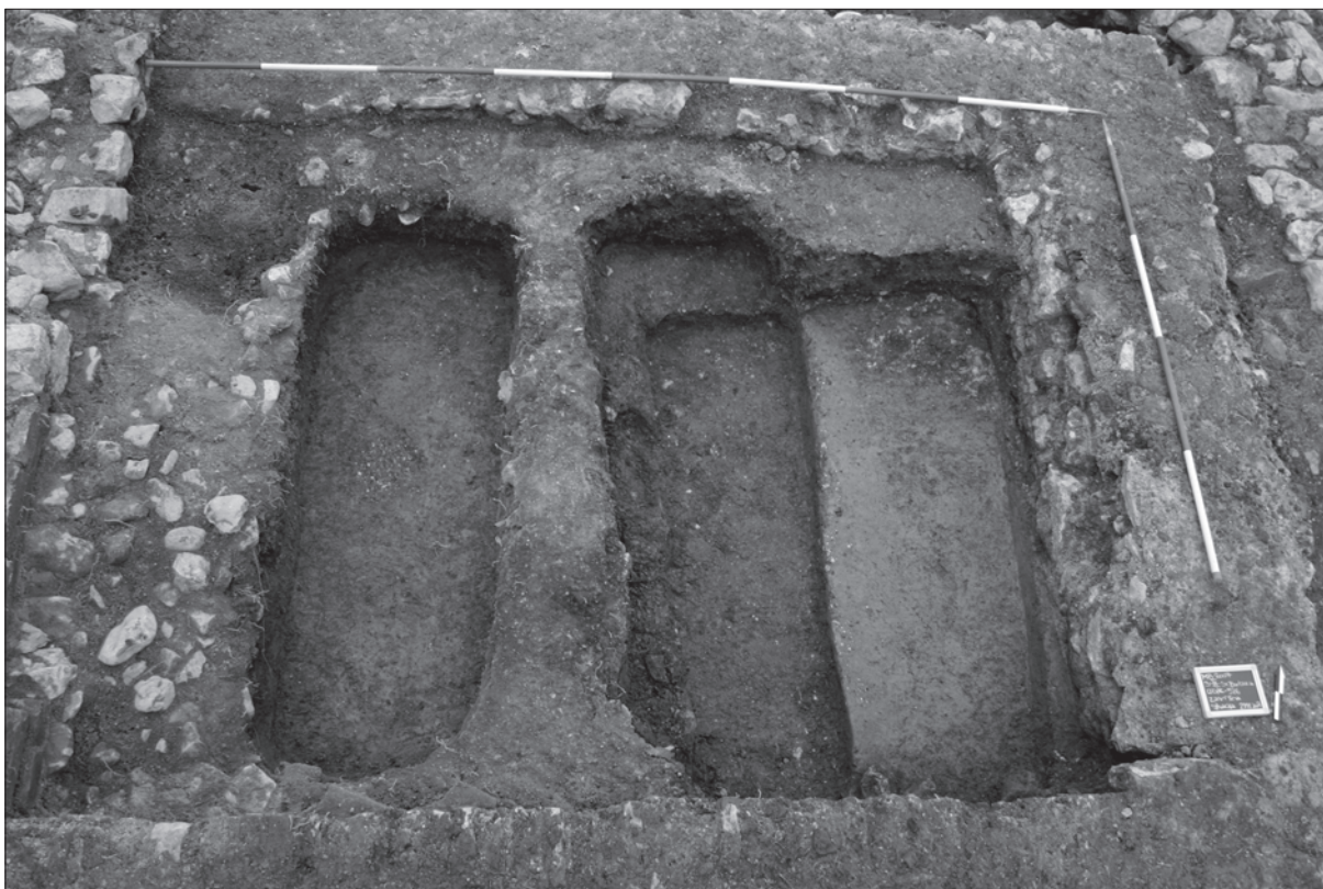
Sl. 2. Novovjekovni grobni ukopi u kapeli sv. Barbare

Fig. 2. Modern age grave burials in the chapel of St. Barbara