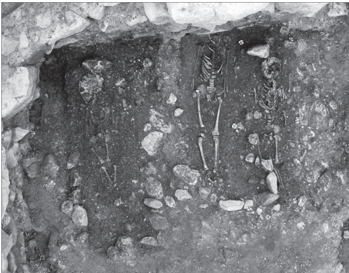
Sl. 3. Ivanec – Stari grad, grobovi obloženi kamenjem u jugozapadnom kutu svetišta

Fig. 3. Ivanec – Stari grad, graves lined with stones in the south-western corner of the sanctuary