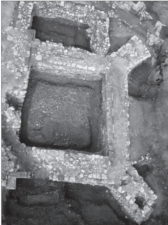
Sl. 2. Ivanec - Stari grad, pogled na svetište prije konzervacije zidova