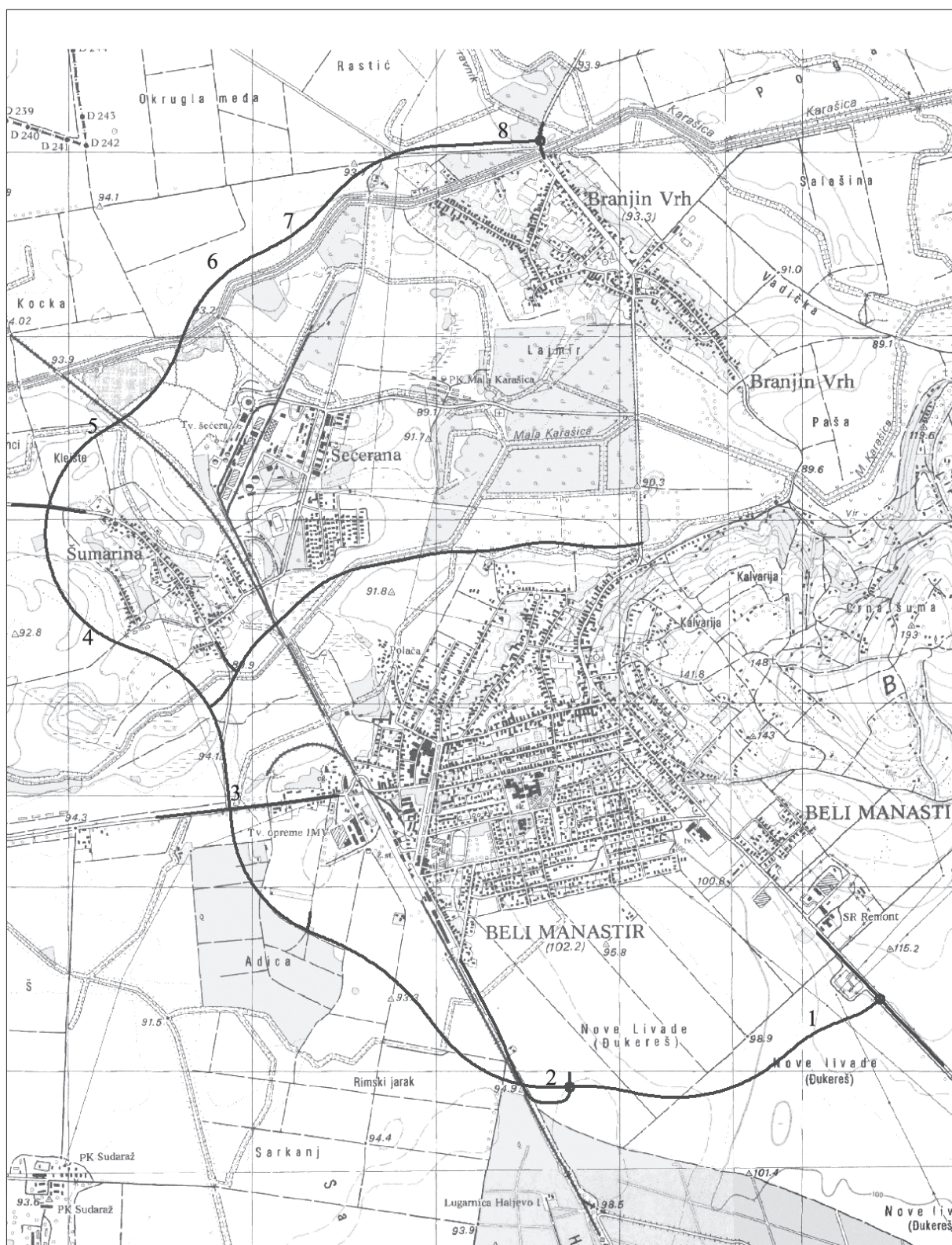
Karta 1. Položaj arheoloških lokaliteta na trasi zapadne zaobilaznice oko Belog Manastira

Site map 1. The position of archaeological sites on the route of the western bypass around Beli Manastir