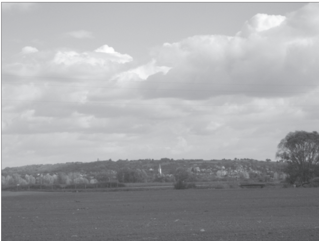
Slika 1. Šumarina-Širine, pogled prema Banskome brdu