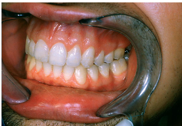
Slika 4. Okluzija nakon završetka liječenja (lijevo) Figure 4. Occlusion after treatment (on the left)

zbog izrazite incizalne stepenice od toga odustalo (Slika 3). Prvih dana postupka zbog ekstenzijskog se djelovanja naprave javlja reakcijski kapsulitis koji se očituje osjetljivošću čeljusnih zglobova. Tijekom tretmana pacijenta se kontroliralo jedanput u mjesecu, pri čemu se je naprava oslobađala na mandibuli kako bi se procjenom međučeljusnih odnosa i stanja zglobova nadzirao tijek liječenja. Tom se prigodom odlaga prema potrebi mogla aktivirati. Nakon deset mjeseci naprava je skinuta, te je ponovno postavljen fiksni aparat i time je liječenje završeno. Ono je trajalo 23 mjeseca. Godinu dana nakon završetka rezultati su procijenjeni raščlambom okluzije (Slike 4, 5), kefalometrijskom raščlambom (Slike 6, 7) i prosudbom fotografije profila lica.