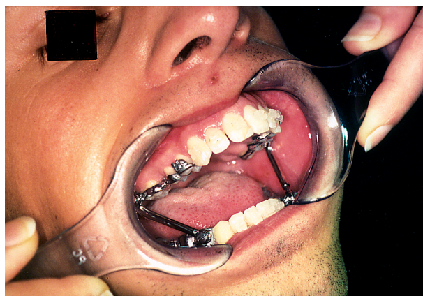
Slika 3. Aktivirana naprava pri otvorenim ustima

Figure 2. Appliance set, but not activated in the mouth of the patient