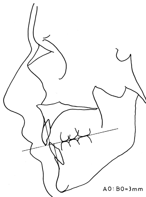
Slika 6. Wits raščlamba nakon završetka liječenja Figure 6. Wits analysis after treatment