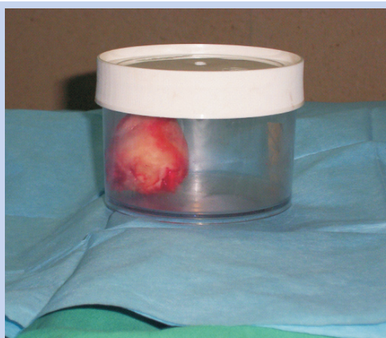
Slika 1. a) Uzimanje obriska za bakteriološku analizu s glave bedrene kosti nakon osteotomije vrata femura; b) Spremanje glave bedrene kosti prije odlaganja u zamrzivač

Figure 1 a) Femur head smearing for microbiological analysis after femur neckosteotomy; b) Storage of femur head before freezing.