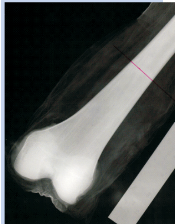
Slika 7. Radiološka obrada presatka pomoću dviju različitih vrsti markacije poznatih dimenzija Figure 7 X-ray explant measurement using two markers