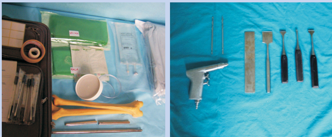
Slika 2. Materijal i dio instrumentarija za potrebe eksplantacije Figure 2 Material and instruments for explantation

Za meka tkiva (ligamente i tetive) nije registrirano popuštanje tijekom godina i dobna granica ne predstavlja ograničenje 7 . Preporuka je da se za strukturalnu upotrebu tetiva i fascija koriste davatelji do 65 godina starosti. Optimalni kadaverični davatelji su u dobi od 20 do 30 godina (mladi ljudi stradali u prometnim nesrećama). Njihove kosti normalne su građe i čvrstoće, hrskavica debela sloja, a tetive i ligamenti čvrsti. Ukoliko je uzrok smrti trauma, osim uvida u heteroanamnestičke podatke, moramo detaljno pregledati ekstremitete i regije planiranog uzimanja presatka, jer oguljotine i otvorene rane te otvoreni prijelomi isključuju mogućnost uzimanja presatka zahvaćene regije 8 .