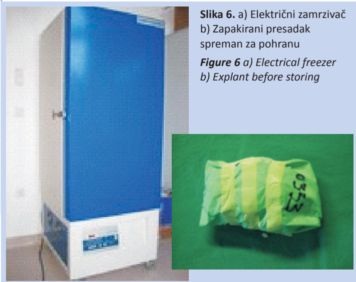
Slika 6. a) Električni zamrzivač b) Zapakirani presadak spreman za pohranu Figure 6 a) Electrical freezer b) Explant before storing

Metoda smrzavanja predstavlja pouzdanu i najdostupniju tehniku pohranjivanja koštanih presađaka, iako samom metodom ne postizemo sterilnost uzetog tkiva. Mnoge koštane banke koriste električne zamrzivače za postizanje zadovoljavajuće temperature od -80^{\circ}\text{C} . U takvim uvjetima pohranjeni presadak može se uspješno upotrijebiti i nakon pet godina.