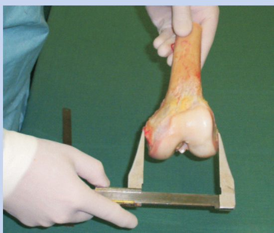
Slika 4. a) Ispiranje presatka; b) Mjerenje presatka Figure 4 a) Explant lavage ; b) Explant measurements