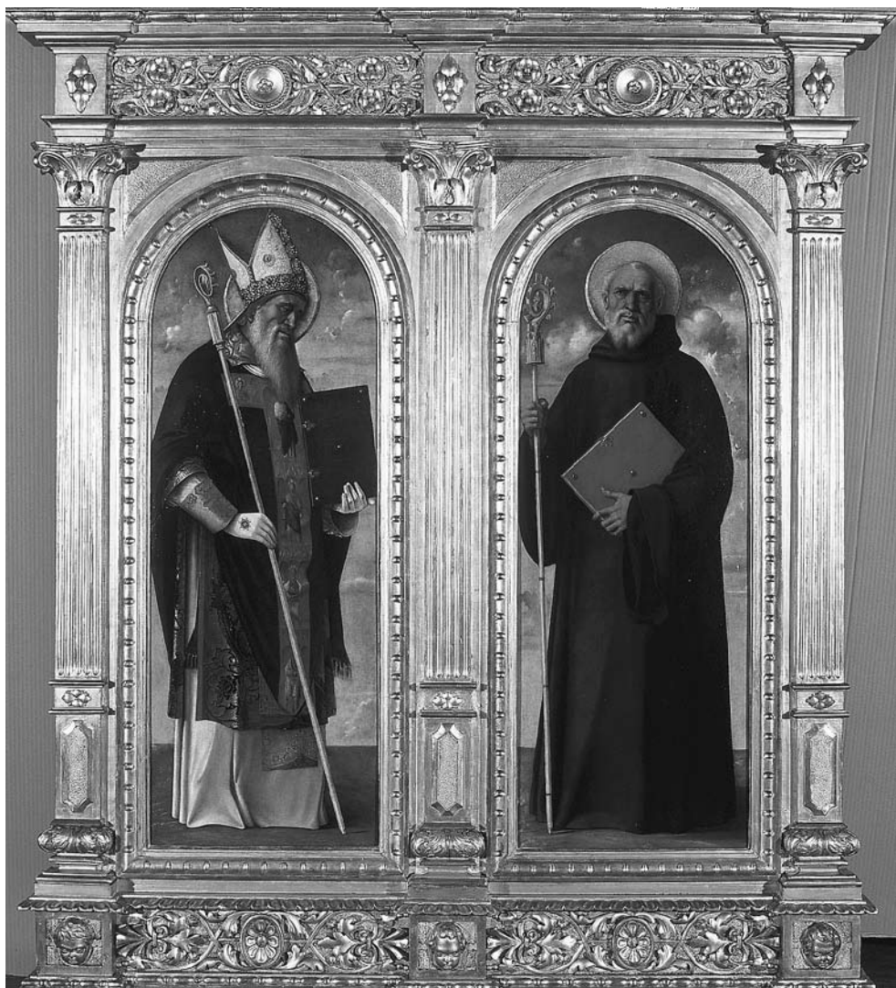
↑ Giovanni Bellini, Sveti Augustin i Sveti Benedikt , oko 1485., snimio: Mario Braun, 2008.

Zahvaljujući dobro iskorištenu spletu povoljnih okolnosti slike su prije izložbe mogle biti upućene na restauratorski zahvat. 2 Vrlo zahtjevni restauratorski radovi na iznimno