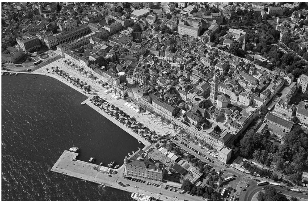
↑ Splitska povijesna jezgra, snimak iz zraka, snimio: Živko Bačić, 2008.

i palačama, a da se istovremeno kuće zbog trošnosti urušavaju, s krovova padaju crepovi i dimnjaci, u pločnicima nastaju rupe, kanalizacija se razlijeva, električna mreža je pred kolapsom.