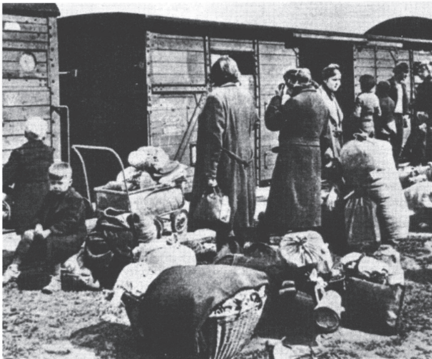
Transport Folksdojčera protjeranih iz Jugoslavije u Austriju, ljeto 1945.

(Slika preuzeta iz knjige Vladimir Geiger, Nestanak Folksdojčera , Nova stvarnost, Zagreb, 1997.)