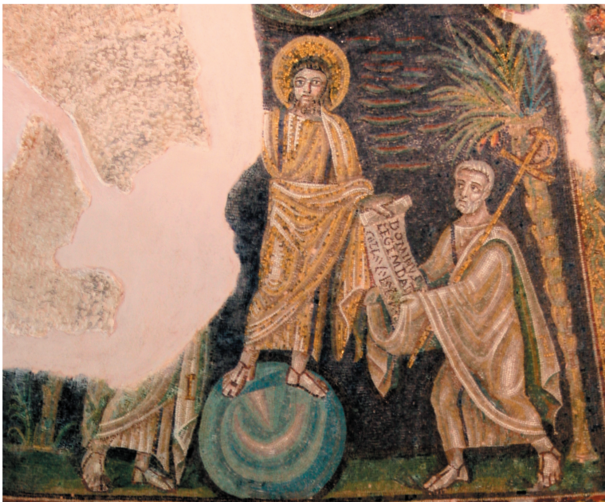
Sl. 4. Baptisterij napuljske katedrale. Fig. 4. Baptistry of the cathedral in Naples.

Za nas je posebno važno što se na privilegiranom, središnjem dijelu sarkofaga (unutar edikule) Traditio legis javlja i na ulomku sarkofaga iz Trogira datiranom u sam kraj 4. stoljeća (Sl. 2). 25