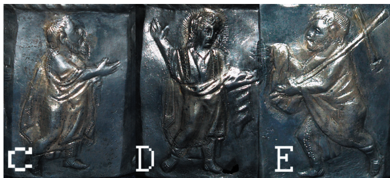
Sl. 9. Traditio legis na novaljskome relikvijaru. Fig. 9. Traditio legis on the reliquary from Novalja.