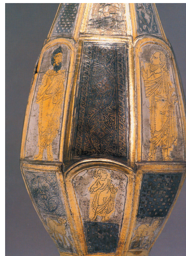
Sl. 17. Vrč iz Trijera (A. KAUFMANN – M. HEINIMANN, MARTIN, 2007, I. 11. 1).

Fig. 16. Sarcophagus from Ancona (G. Koch, 2000, 75).