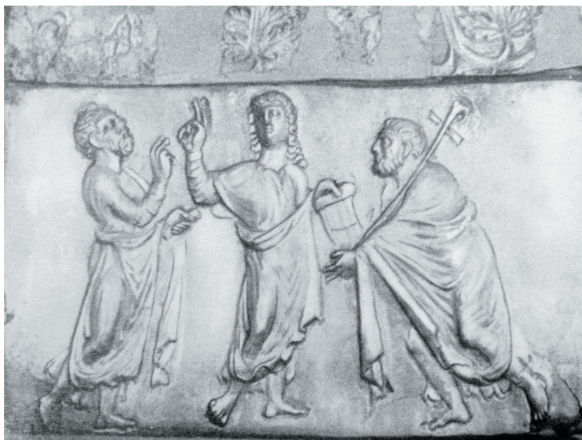
Fig. 11. Reliquary from Thessaloniki (H. BUSCHHAUSEN, 1971, T B 12).

Sl. 11. Relikvijar iz Soluna (H. BUSCHHAUSEN, 1971, T B 12).