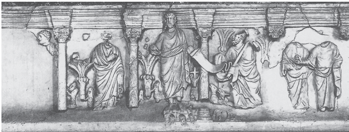
Sl. 1. Sarkofag iz katakombe sv. Sebastijana (G. KOCH, 2000, br. 70).