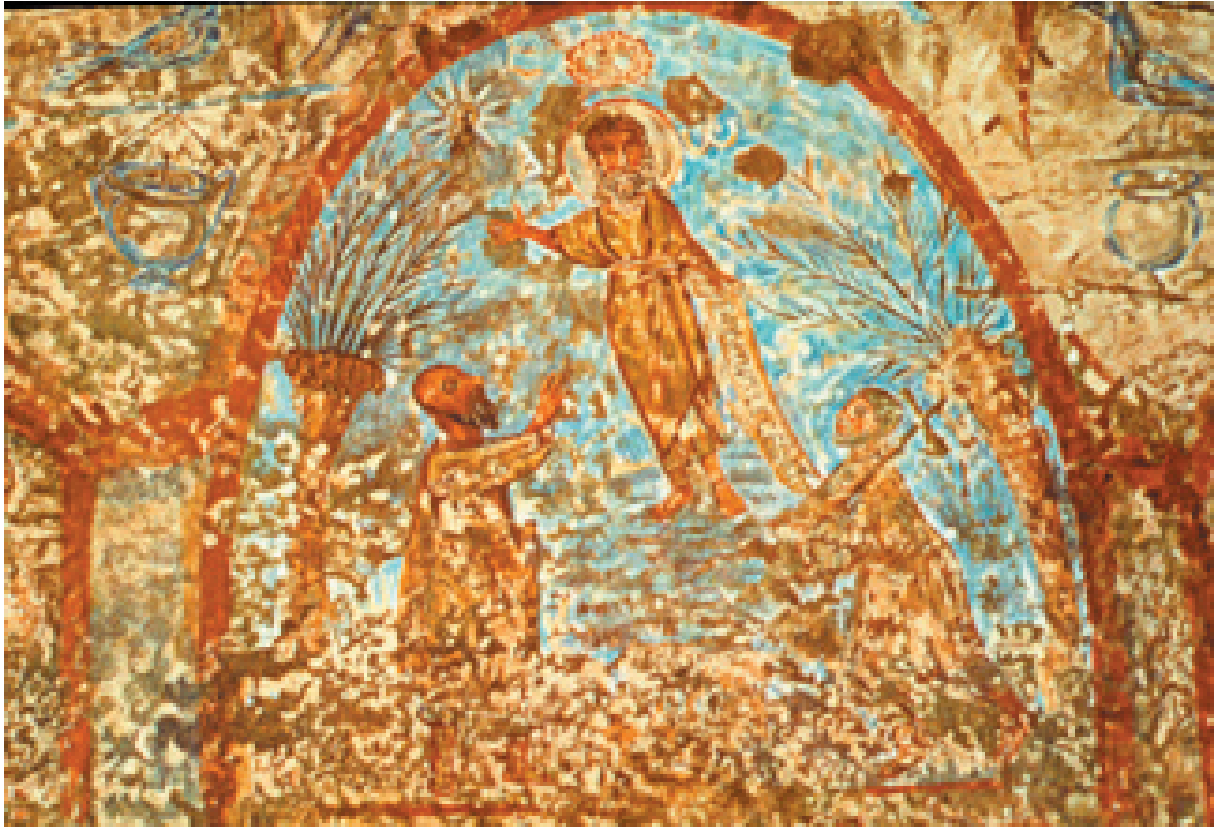
Sl. 5. Katakomba Ad decimum, Grottaferrata, ( www.vatican.va/roman_curia/pontifical_comissione ).