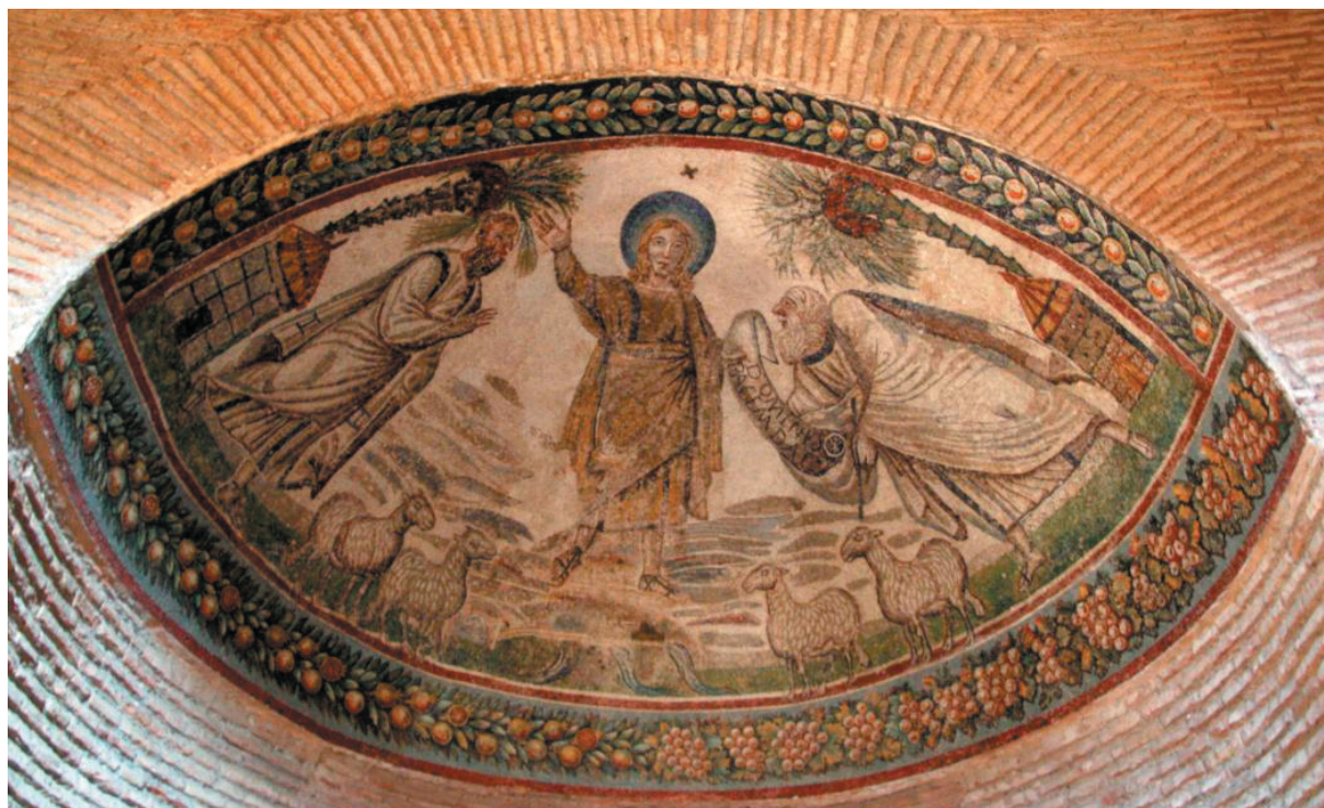
Sl. 3. Mauzolej Kostance, istočna apsida (H. BRANDEMBURG, 2004, sl. 40).