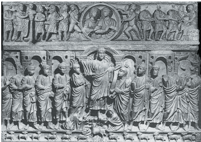
Sl. 16. Sarkofag iz Ancone (G. Koch, 2000, 75).

Fig. 16. Sarcophagus from Ancona (G. Koch, 2000, 75).