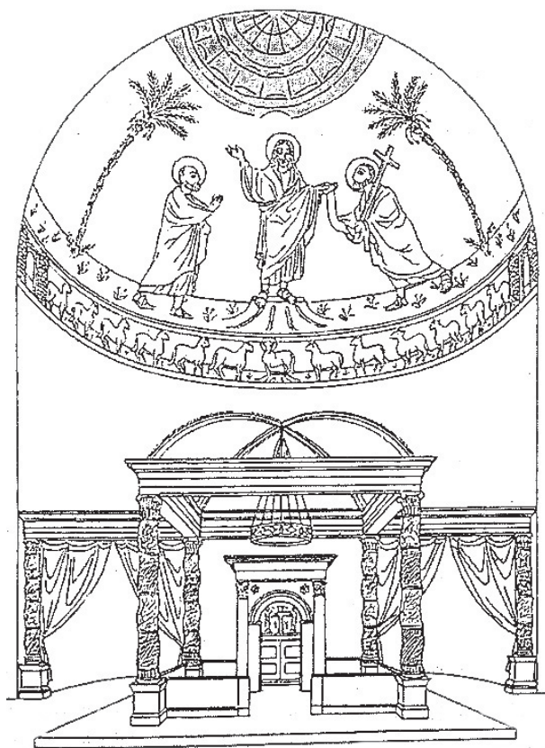
Sl. 8. Idejna rekonstrukcija dekoracije apside Konstantinove bazilike sv. Petra (F. BISCONTI, 2002, sl. 6).

Fig. 8. Ideal reconstruction of the decoration of an apse in the Constantinian basilica of Saint Peter (F. BISCONTI, 2002, fig. 6).