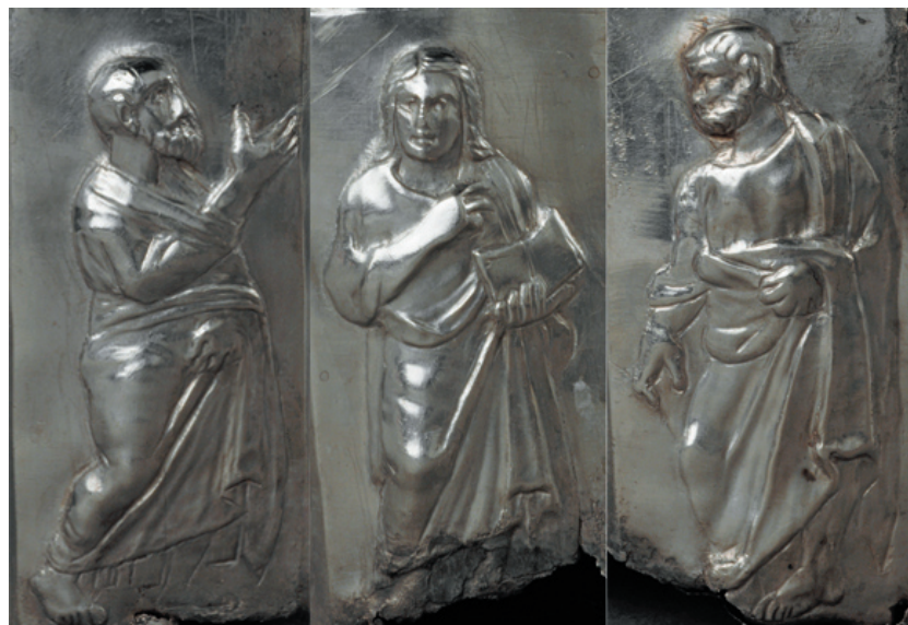
Sl. 15. Maiestas Domini na relikvijaru iz Pule. Fig. 15. Maiestas Domini on the reliquary from Pula.

ikonografijom i oblikom sličan novaljskome, 42 pronalazimo središnju kristocentričnu scenu, u ovom slučaju Maiestas Domini i ostale apostole (Sl. 15). 43