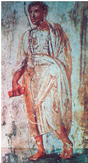
Sl. 13. Filozof iz hipogeja Aurelijevaca u Rimu, (F. BISCONTI, 2000d, T. XLII, a). Fig. 13. Philosopher from the Aurelian hypogeum in Rome (F. BISCONTI, 2000d, T. XLII, a).