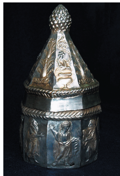
Sl. 10. Novaljski relikvijar. Fig. 10. Reliquary from Novalja.

odnos i geste potvrđuju da scena ima kanonske karakteristike Traditio legis : Kristu je desna ruka uzdignuta, lijevom rukom drži volumen koji predaje Petru; Petar, s lijeve Kristu, nosi križ prislonjen na lijevo rame te pruža ruke umotane u palij kako bi primio zakon; Pavao se nalazi s desne strane i desnom rukom aklamira Kristu, dok u lijevoj drži rotulus .