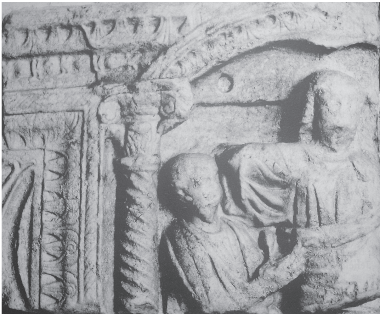
Sl. 2. Ulomak sarkofaga iz Trogira (N. CAMBI, 1989, sl. 34).