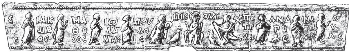
Sl. 14. Relikvijar iz Jabalkova, Bugarska (H. BUSCHHAUSEN, 1971, Tafel B 12). Fig. 14. Reliquary from Jabalkov, Bulgaria (H. BUSCHHAUSEN, 1971, Table B 12).