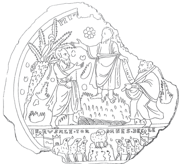
Sl. 6. Staklo "a fondo d'oro" iz Vatikanskih muzeja (F. BISCONTI, 2002, sl. 8).