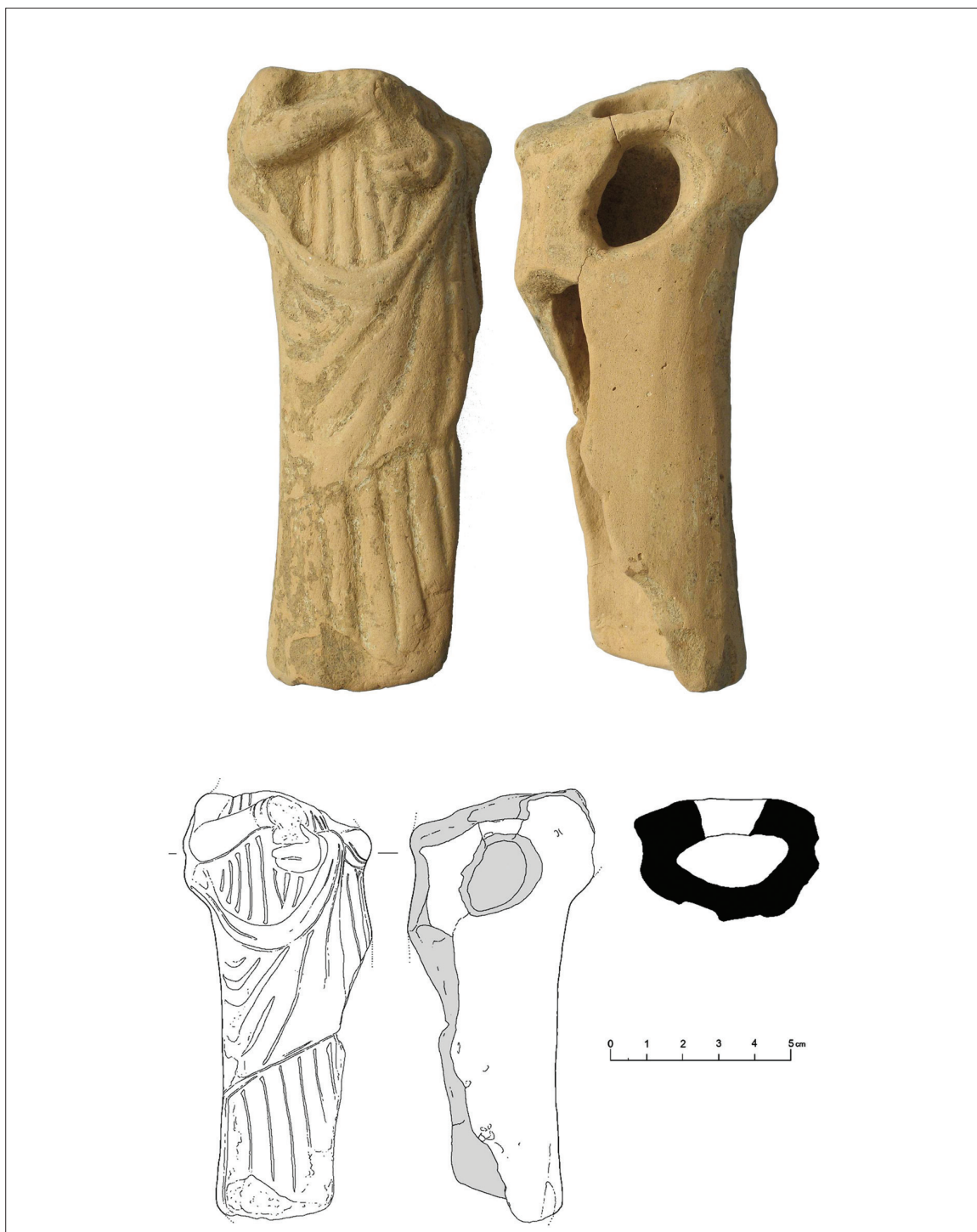
Sl. 3. Terakota stojeće žene nađena na padinama Bandirice, položaj 1.