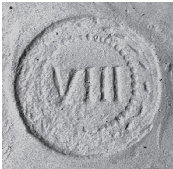
Sl. 6. Spintrija iz Narone, revers. Fig. 6. Spintria from Narona, reverse.

Spintrije su na temelju erotskih prikaza na aversu klasificirali Buttrey, 22 Simonetta i Riva, 23 a na temelju raznih figurae Veneris što se mogu izdvojiti iz antičke literature i iz izvora Jacobelli. 24 Spintrije su uglavnom brončani ili mjedeni oblici, 25 no poznate su koštane, 26 olovne, 27 kao i bakrene erotske tesere. 28 Olovne tesere u klasifikaciji tesera koju donosi Rostowzew, uvrstavajući ih u tessere privatae: t. lupanaria (?), Simonetta i Riva drže starijima od brončanih i datiraju ih u Tiberijevo doba slijedom zabrane unošenja carskog lika u lupanarije. 29 Na toj se navodno Tiberijevoj zabrani uporabe novca i prstenja s carskim likovima u latrinama i bordelima dobrim dijelom temelji hipoteza o namjeni spintrija kao platežnom sredstvu u bordelima. 30 Najgorljiviji zastupnici te hipoteze su Simonetta i Riva. Podijelili su spintrije u tri skupine i datirali ih na temelju oskudnih izvora, čak i šutnje izvora, Svetonija i Marcijala, te usporedbe s pompejanskim freskama, u Vespazijanovo i Domicijanovo doba. 31 Razni stručnjaci drže da su lasciva nomismata što ih spominje Marcijal 32 upravo spintriae , koje je car Domicijan bacao po puku, okupljenom