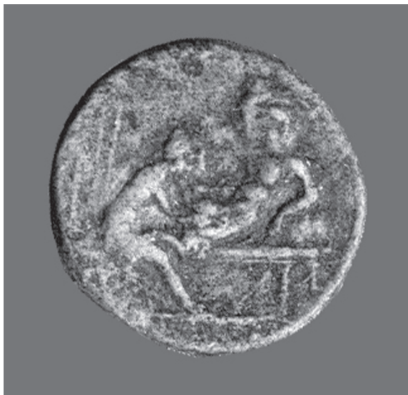
Sl. 5. Spintrija iz Narone, avers. Fig. 5. Spintria from Narona, obverse.