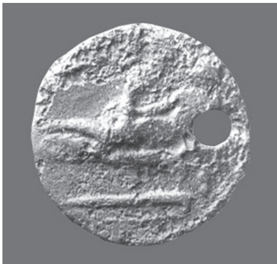
Sl. 3. Spintrija iz Majsana, avers. Fig. 3. Spintria from Majsan, obverse.