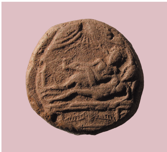
Sl. 1. Spintrija iz Salone, avers (foto Z. Buljević). Fig. 1. Spintria from Salona, obverse, Photo by: Z. Buljević.