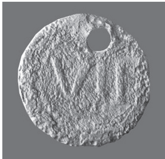
Sl. 4. Spintrija iz Majsana, revers. Fig. 4. Spintria from Majsan, reverse.

Drži da je to što su stupali u grupni seks, 15 bio grijeh zbog kojih ih je Kaligula protjerao iz Rima. 16 Osim toga Tiberije je na Capriju imao cubicula pune opscenih umjetničkih djela i (oslikane) seksualne priručnike Elefantide, ako im zatreba primjer. Izvođači su, spintrije, mogli prekinuti izvedbu da bi se nadahnuli umjetničkim djelima, čak i konzultirati priručnik, proučiti pozu koju je netko zatražio da se izvede, možda i sam car koji je, ostario i nemoćan, uživao u prizoru. 17 Prema tome na spintrijama nisu bile prikazane spintrije. Na spintrijama su prikazane kopulacija ili felacija između dviju osoba, muške i ženske ili, rjeđe, dvojice muškaraca. 18 Spomenimo ovdje da je Elefantida jedna od devet autorica ilustriranih seksualnih priručnika s popisanim, opisanim i enumeriranim seksualnim pozama; ti su priručnici, još jedno grčko-helenističko nasljeđe, vjerojatno bili predložak erotskim motivima u rimskoj umjetnosti. 19