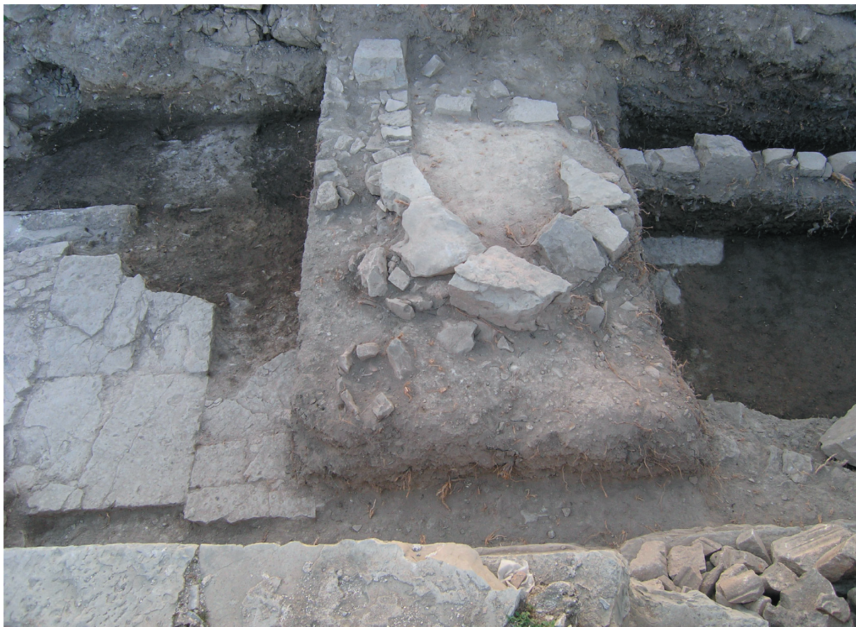
Sl. 5. Apsida i zid SJ 025.