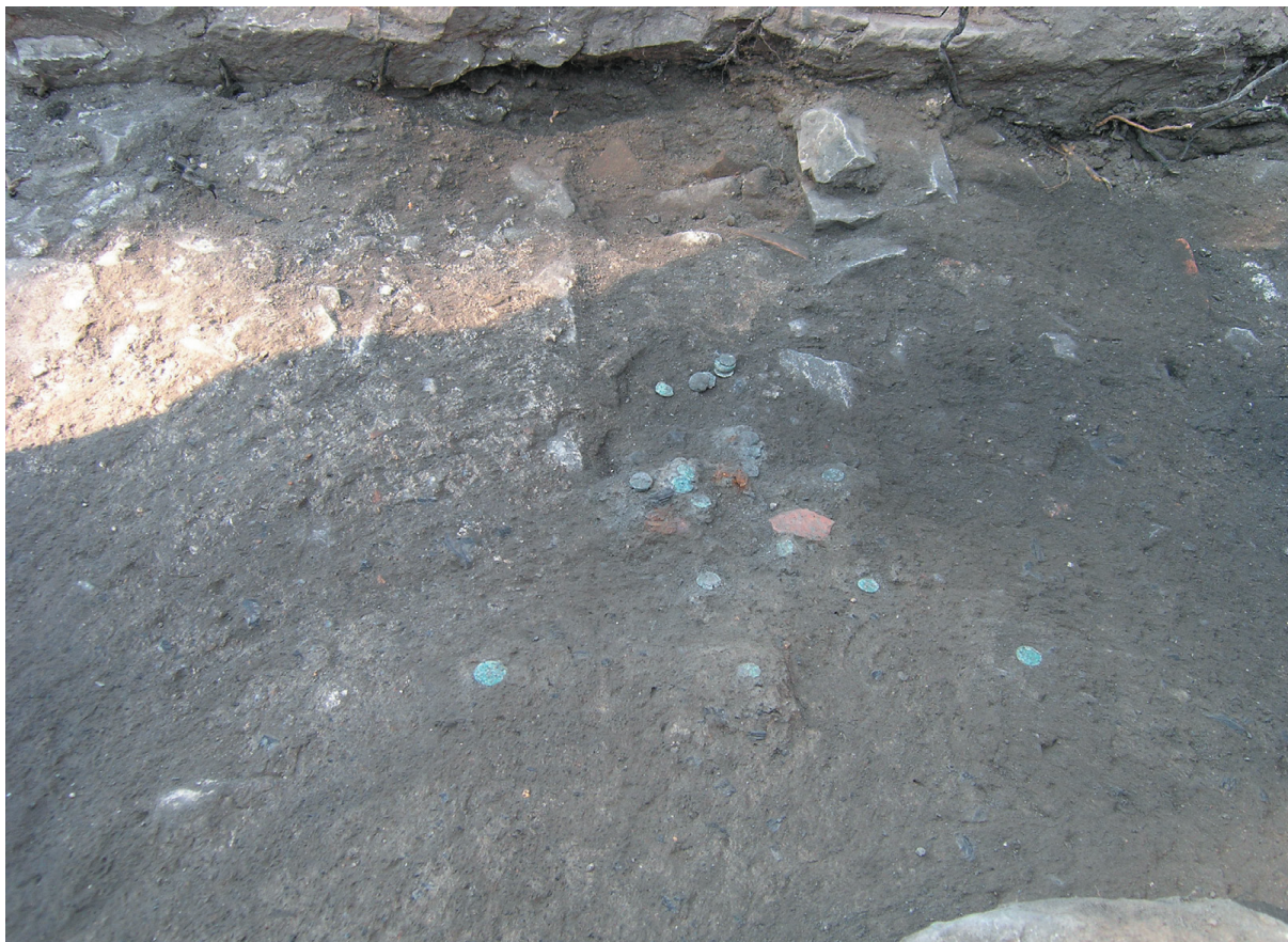
Sl. 3. Položaj novca u sloju SJ 014.