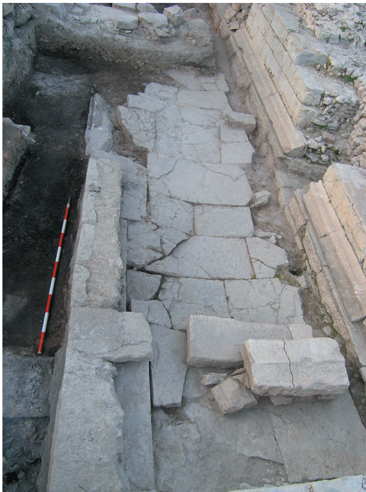
Sl. 1. Popločenje hodnika, stube i zid SJ 026. Fig. 1. Paving of the corridor, steps and wall SU 026.

Bulić i Weilbach su interpretirali zid SJ 026 (njegov južni dio pronađen 1922.) kao ogradni zid iz prve faze hrama. 28 Iako prilikom istraživanja 1922. godine nije pronađeno popločenje, Weilbach je pretpostavio da je cijeli hodnik bio popločen. 29 Ovu pretpostavku potvrdili su posljednji radovi (Sl. 1). Popločenje je sačuvano samo na sjevernoj strani hodnika, ali ne i neposredno uza zid hrama. Vidljivo je da su neke ploče razbijane, ali je i cijeli hodnik ulegnut po sredini pa je i to razlog što su neke ploče odvojene od hramskog zida. Oko 70 cm južno od ruba donje stube, neposredno uz rub istočnog zida teatra, u podlozi od zemlje i žbuke nalazi se otvor nepravilna kvadratična oblika. To je otvor okomita kanala čije su stranice ožbukane. Kanal je bilo moguće pratiti do dubine od oko 0,5 m. Vjerojatno se radi o odvodnom kanalu za kišnicu (Sl. 2).