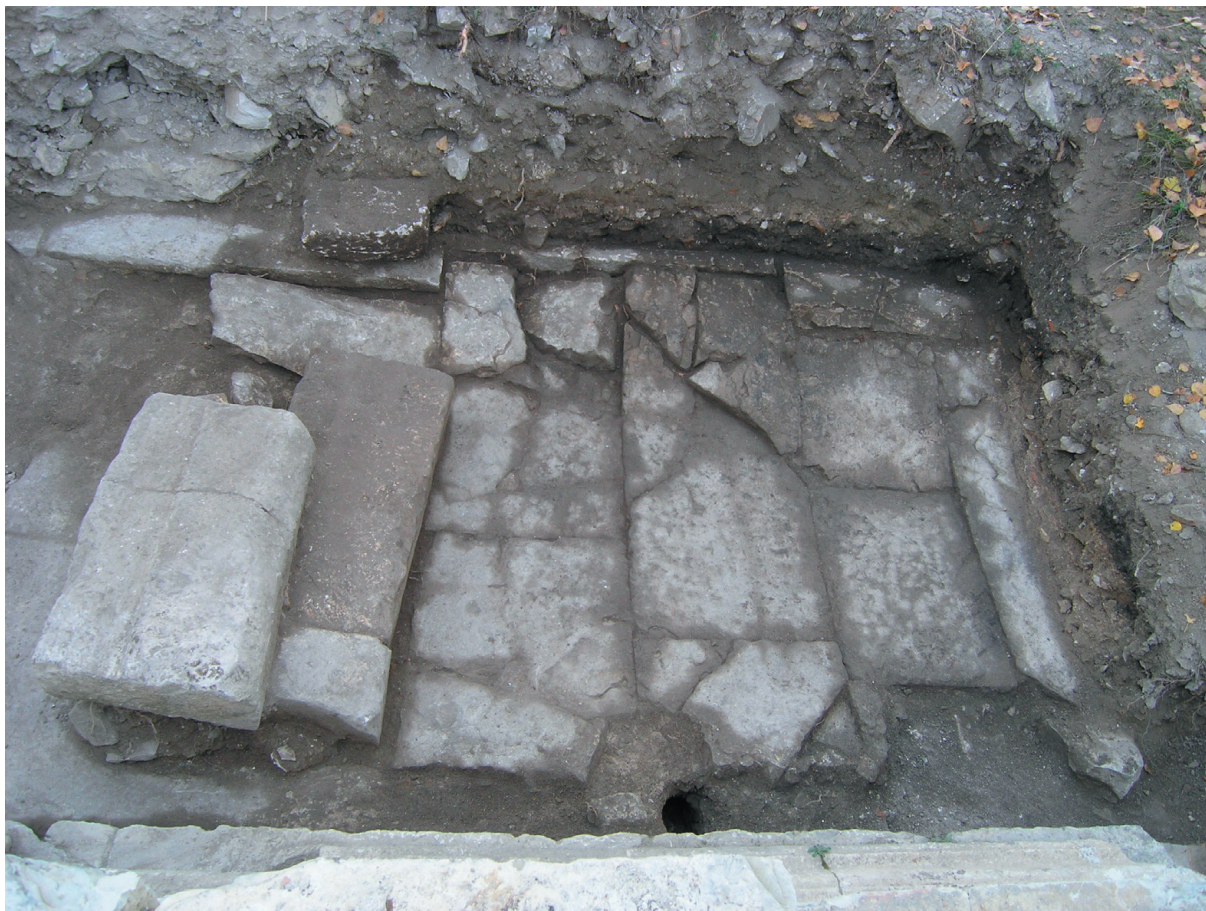
Sl. 2. Otvor odvodnog kanala između zida brama i popločenja.

Fig. 2. Opening of the drainage canal between the temple wall and paving.