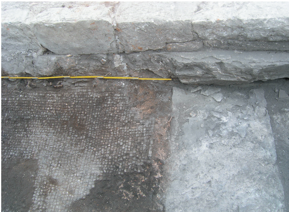
Sl. 4. Mozaik i zidovi SJ 023 i SJ 026.