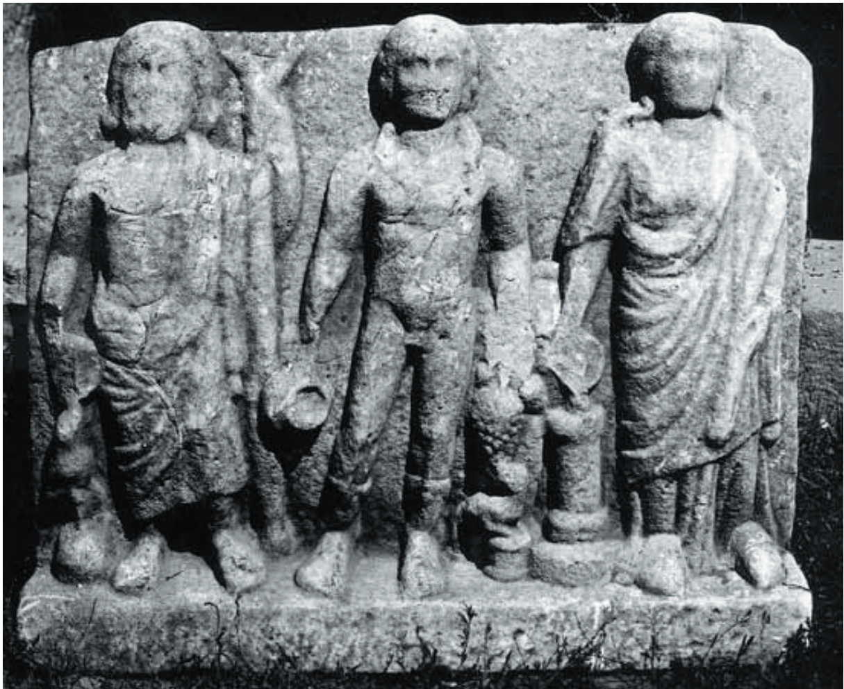
Sl. 7. Reljef iz Graza, Institut za arheologiju Sveučilišta u Grazu. Fig. 7. Relief from Graz, Institute of archaeology of the University of Graz.

Srbije, nekoć bilo prikazano dvanaest božanstava, onda bi on bio najsličniji – barem kompozicijski - našem reljefu iz katedrale sv. Duje. 20