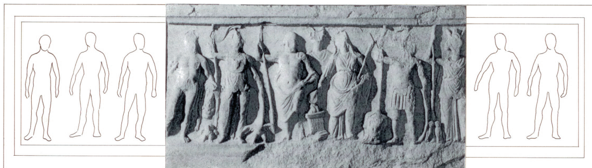
Sl. 8. Rekonstrukcija reljefa (crtež K. Rončevića).