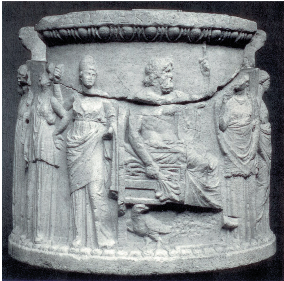
Sl. 4. Oltar iz Ostije, Museo Ostiense.