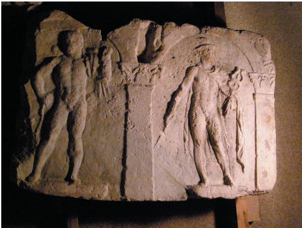
Sl. 6. Sarkofag iz Narone, Arheološki muzej u Naroni.