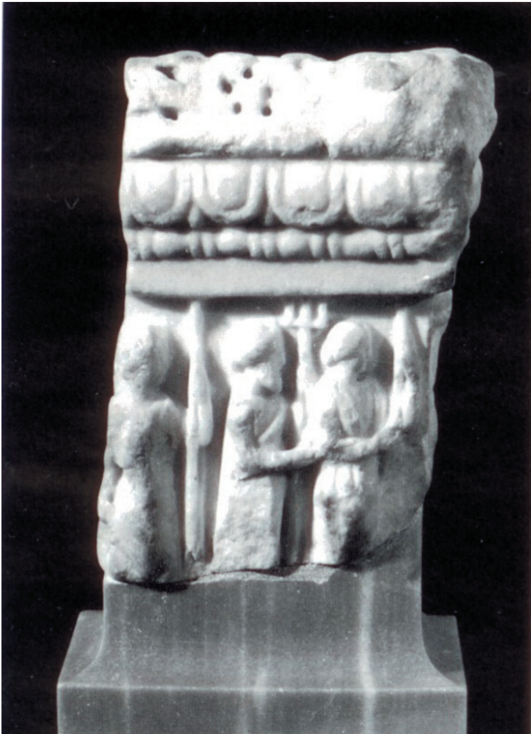
Sl. 5. Ara iz Salone, Arheološki muzej u Splitu.