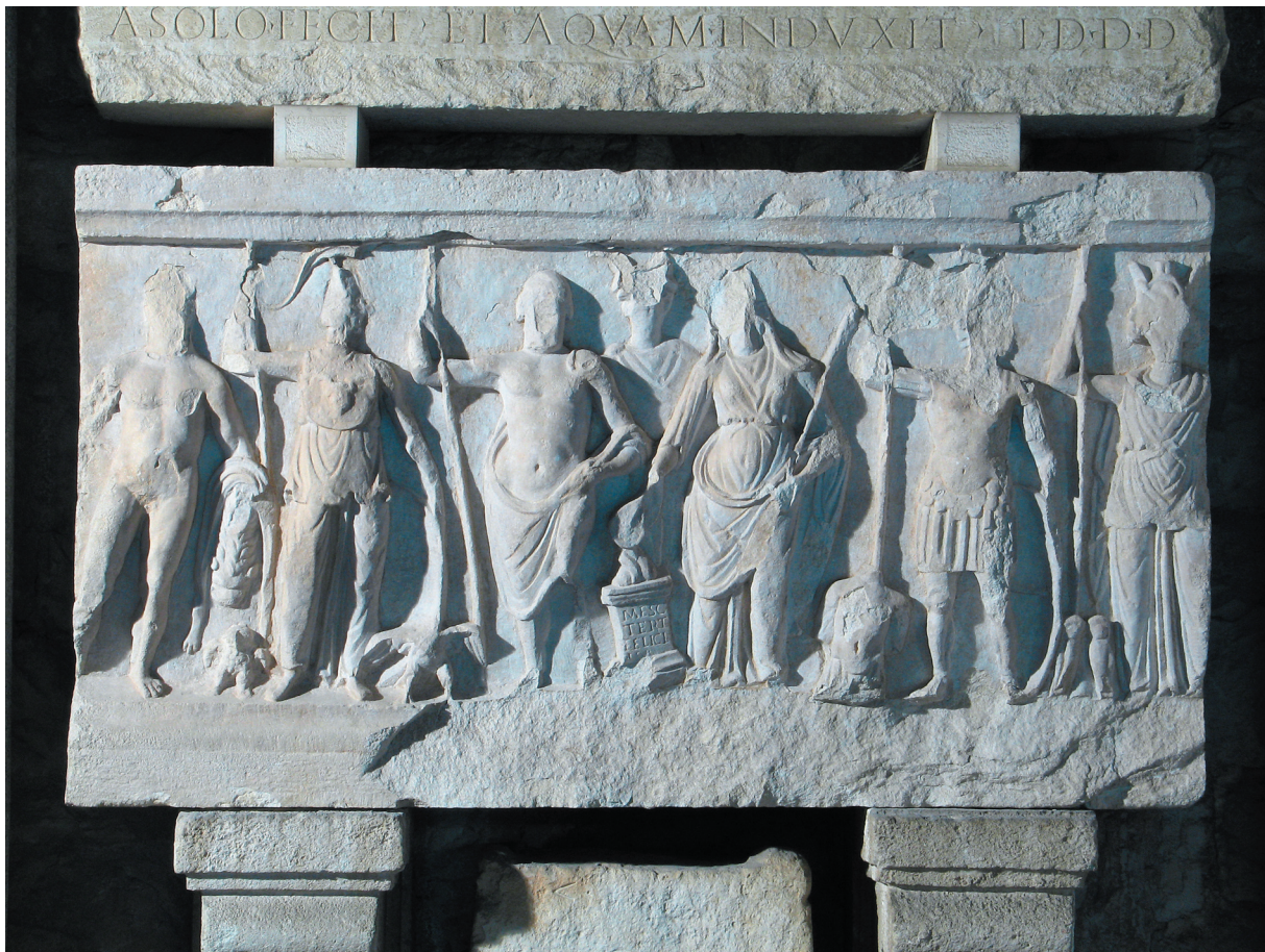
Sl. 1. Reljef s prikazom rimskih bogova, Arheološki muzej u Splitu.

Fig. 1. Relief with a depiction of Roman deities, Archaeological Museum in Split.