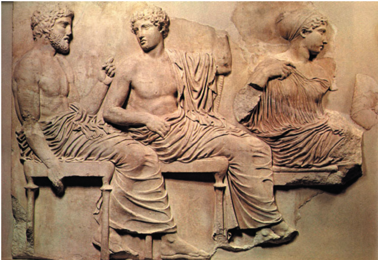
Sl. 3. Partenon, istočni friz, blok 6, fig. 38-40, British museum.