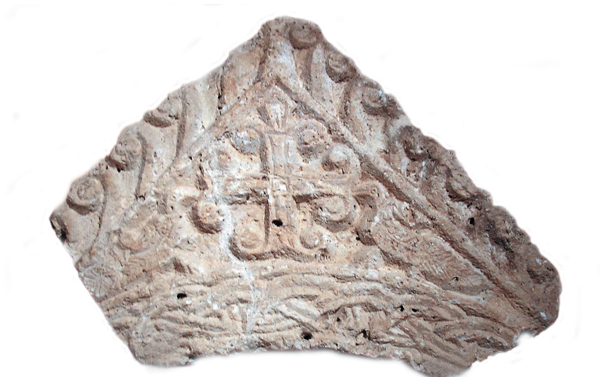
Sl. 1. Zabat iz Novalje s pticama oko središnjega križa. Fig. 1. Gable from Novalja with birds flanking central cross.

vjerojatno je zbog svojih monumentalnih dimenzija nadvratnik, a ne zabat. 2 Drugi zanimljivi spomenik zbog svoje debljine i načina izrade (perforirani "zabat") te sadržaja natpisa vjerojatno je također imao neku posebnu namjenu, kako je to spomenuto u literaturi. 3 Kao sigurne predromaničke zabate moguće je izdvojiti dva spomenika iz zbirke "Stomorica". Budući da nisu objavljeni, pobuđuju posebnu pažnju.