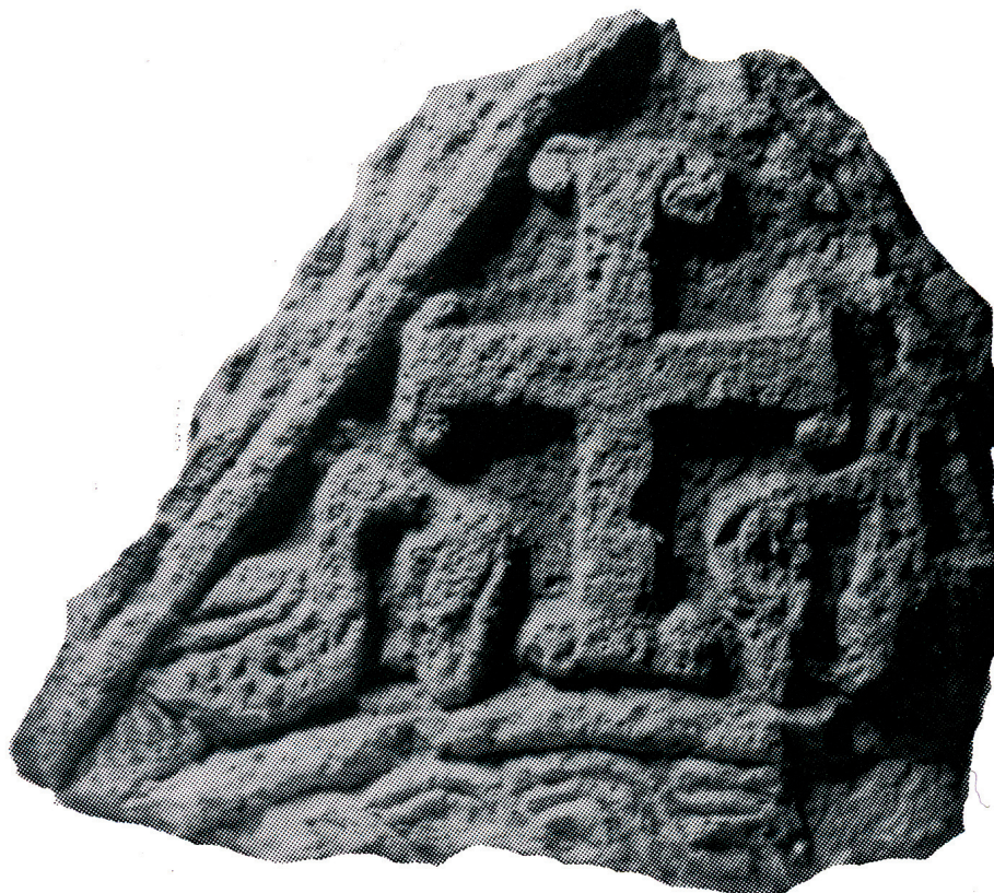
Sl. 4. Zabat s otoka Cresa (preuzeto iz J. ČUS-RUKONIĆ, 1991, 49, sl. 75).