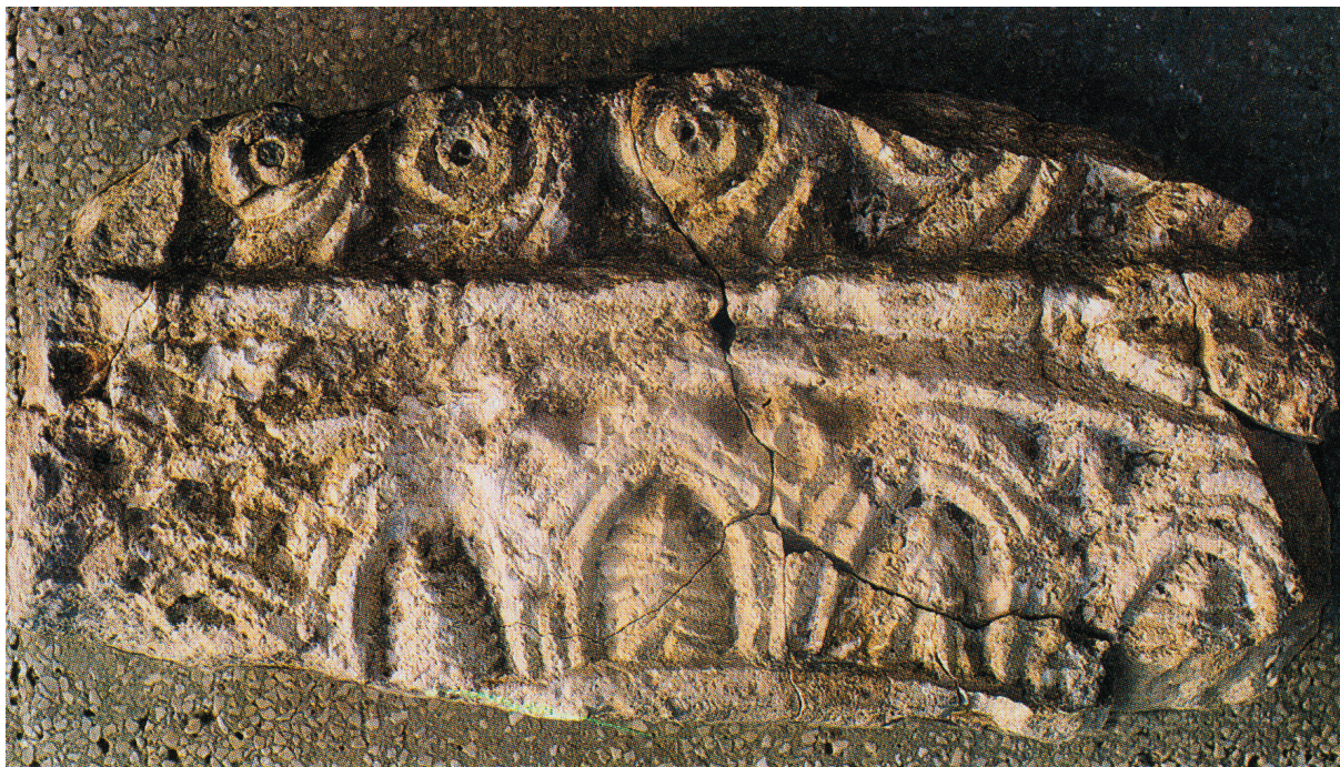
Sl. 6. Fragment zabata iz Supetarske Drage na otoku Rabu.