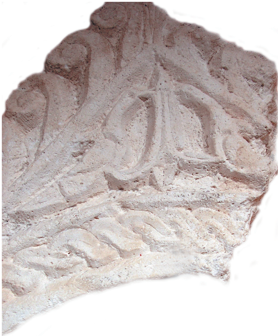
Sl. 3 Detalj zabata iz Novalje s pticama oko biljke.