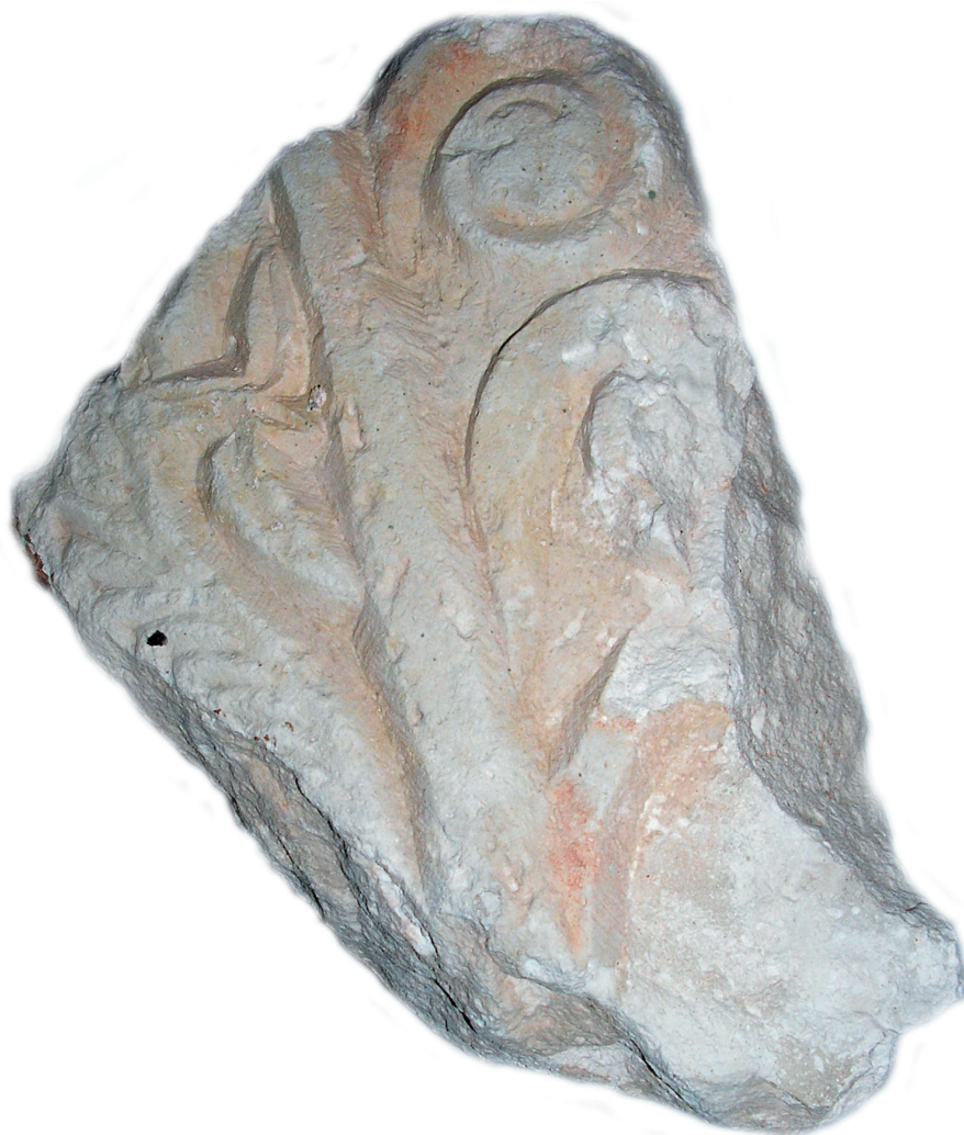
Sl. 7. Ulomak zabata iz Lapidarija u Rabu.