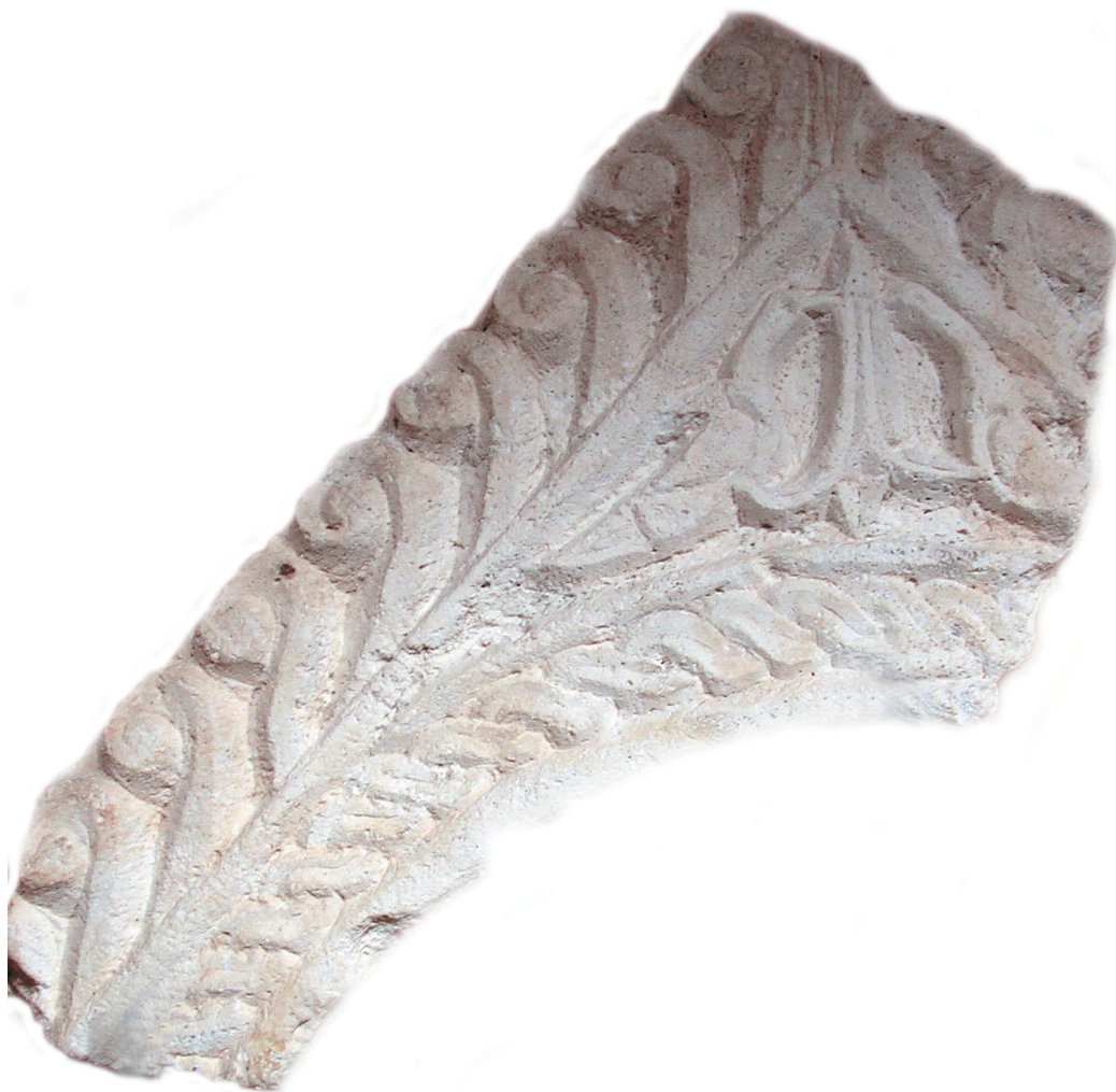
Sl. 2 Zabat iz Novalje s pticama oko središnje biljke.