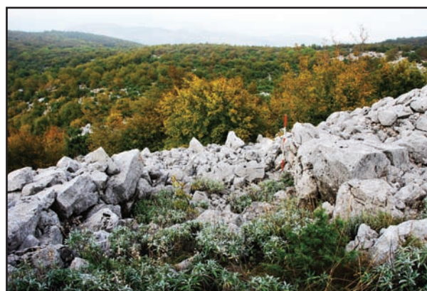
Slika 3. Kurlje, hodnik ulaza građen megalitima.

methods for their ramparts, retaining walls and entrances. Stari Šibenik in Grebaštica can be taken as an example of specific morphology (Mendušić 2000: 209). This is a large hillfort of an irregular rectangular shape with ramparts meeting at right angles, external walls were generally made using partially dressed stone. On the eastern stretch of the ramparts the monumental hall of the entrance has been preserved, its door-posts made of megaliths (Fig. 2). What one first notices upon entering the Stari Šibenik hillfort is the higher number of Roman ceramics (the aforementioned amphorae and dolia ), and the lack of earlier pottery remains, which would have provided evidence of the hillfort's existence in the Hellenistic era. Stari Šibenik has already been covered elsewhere (Miletić 2008; Catani 2008), so this material will not be repeated here.