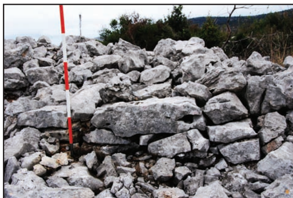
Slika 7. Pipoganj, sačuvani segment zida sjevernog poteza pretpovijesnog bedema.

Vizualno komunicira s gradinama: južno Oriovišćakom i zapadno Rebcem. 6