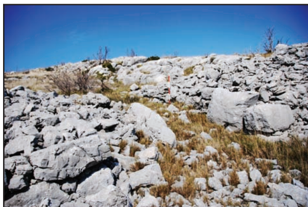
Slika 2. Stari Šibenik, hodnik ulaza građen megalitima.

brojnost rimske keramike (spomenute amfore i dolia ), i nedostatak ranije, koja bi ukazala na egzistenciju gradine u helenističko doba. O Starom Šibeniku već se pisalo na drugom mjestu (Miletić 2008; Catani 2008), pa ovdje ne bismo ponavljali.