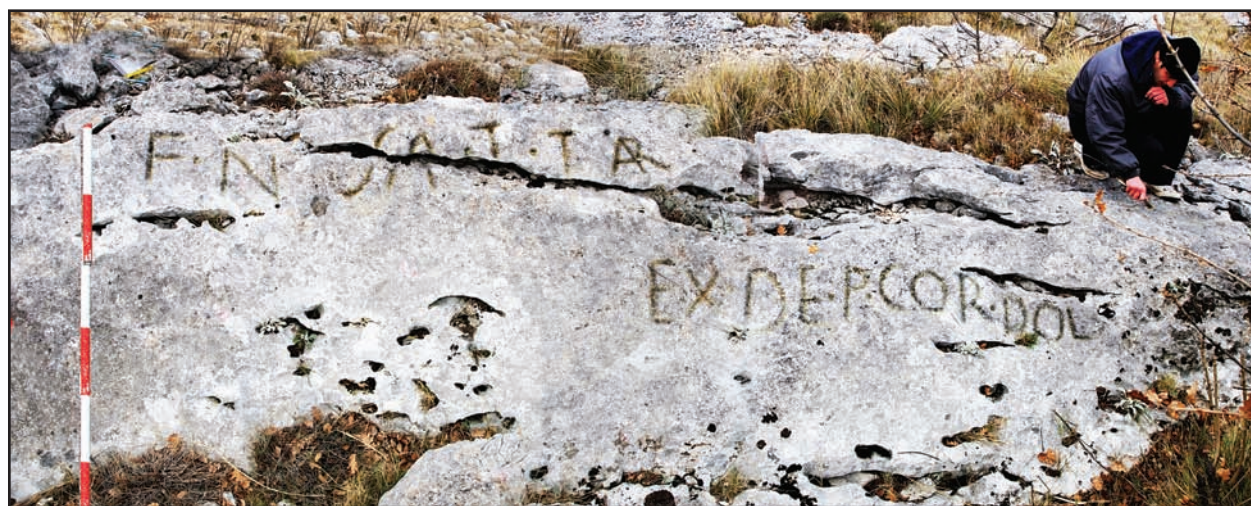
Slika 1. Terminacijski natpis sjeverno iznad lokve Bljuštovača (snimio Z. Sunko, 2006).

Recently, the reading of the inscriptions has been revised (Catani [in press]). The subject of the first inscription is the saltus , and of the second the finis novus . However, this new boundary does not refer to the castellum , as proposed by Babić (1996: 62), but rather the saltus , which can be seen nicely in the attached photograph. In Roman literary, epigraphic and juridical sources, the saltus to which the provision and new boundary refer is a land surveyor's term which means a hilly elevated terrain, i.e. a pas-