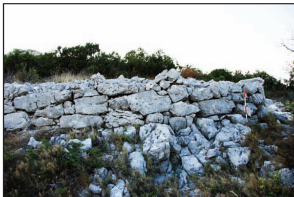
Slika 5. Talež (Vis), fortificirana terasa.

govoriti stoga što se bedemi njihovih gradina svojom morfologijom, obradom megalita i njihovom uporabom razlikuju od onih u blizini grčkih kolonija na srednjodalmatinskim otocima. Kao jedan od primjera možemo uzeti gradinu Talež na Visu, kojoj su u mlađoj fazi s vanjske strane bokobrana podgrađa, terase fortificirane megalitima, od kojih su neki poligonalni i spajaju se na zub. 5 Rimsko doba nedvojbeno donosi nove morfološke momente na tariotske gradine, a to najslikovitije pokazuje gradina Stari Šibenik – svojom veličinom, bedemima i pokretnim materijalom koji na njoj zatječemo.