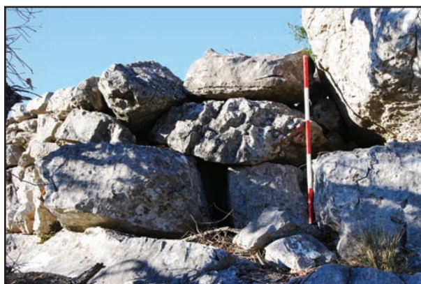
Slika 4. Kosmač, podzid građen megalitima.

Još dvije gradine sadrže brojna rimska keramička materijala – Kosmač i Mendulina. Manje rimskog materijala na površini ima Sv. Juraj, a prisutnost rimskog materijala bilježimo na gradinama Pipoganj (kat. br. 5), Gradac, Veliki Radulj (kat. br. 3) i Kurlje (kat. br. 1) (v. kartu 1). Slično Starom Šibeniku megalitskom tehnikom rađeni su dovratnici hodnika ulaza gradine Kurlje (kat. br. 1) (sl. 3), koja zadržava prapovijesnu morfologiju, te na Kosmaču (kat. br. 2), gdje na južnoj padini ispod dominantne stoji jedan segment podzida građen megalitskom tehnikom u tri reda, što upućuje na zaključak da je zid do kraja bio zidan u istoj tehnici.