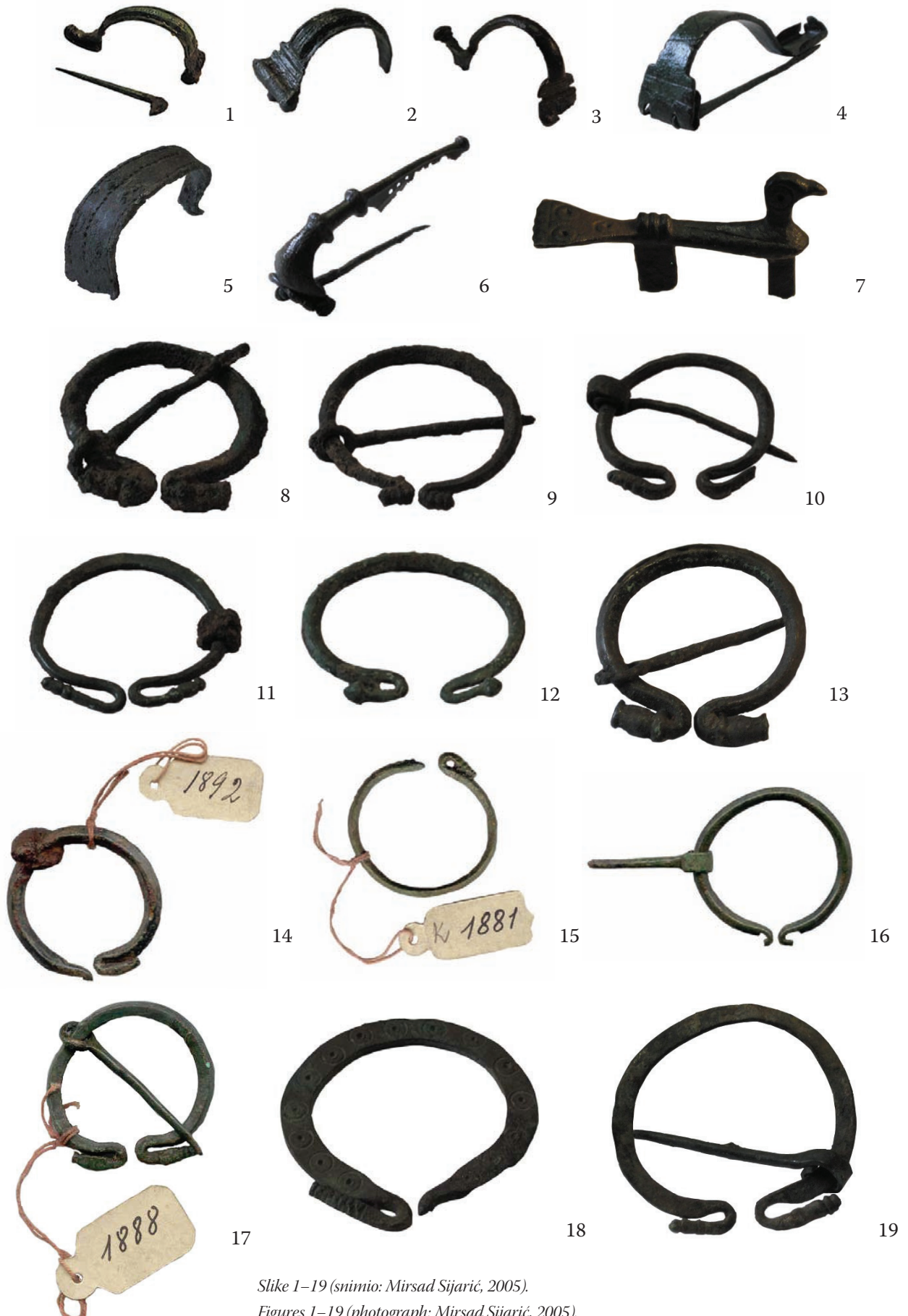
Slike 1–19.