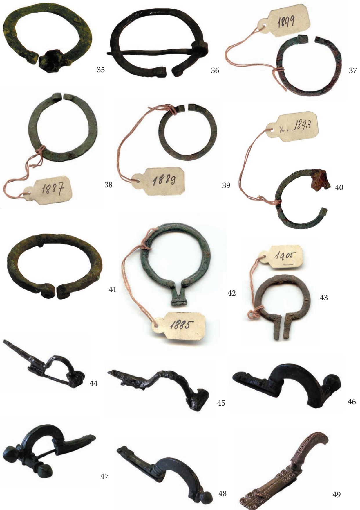
Slike 35–49.