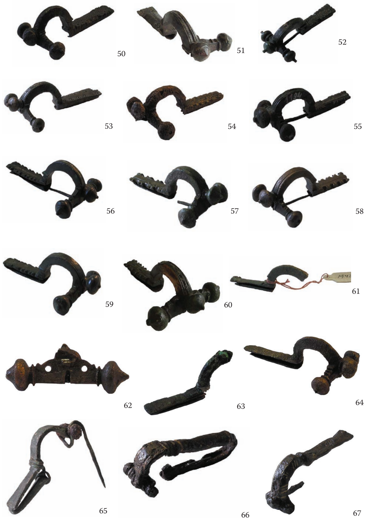
Slika 50–67 (snimio: Mirsad Sijarić, 2005).