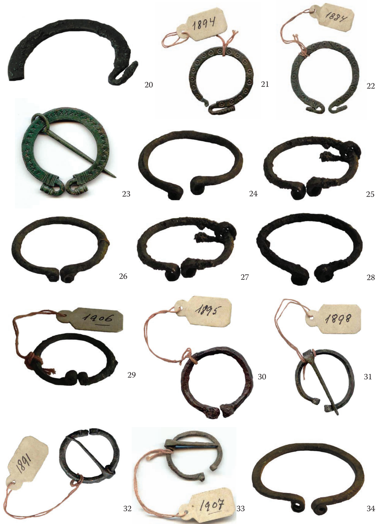
Slike 20–34.