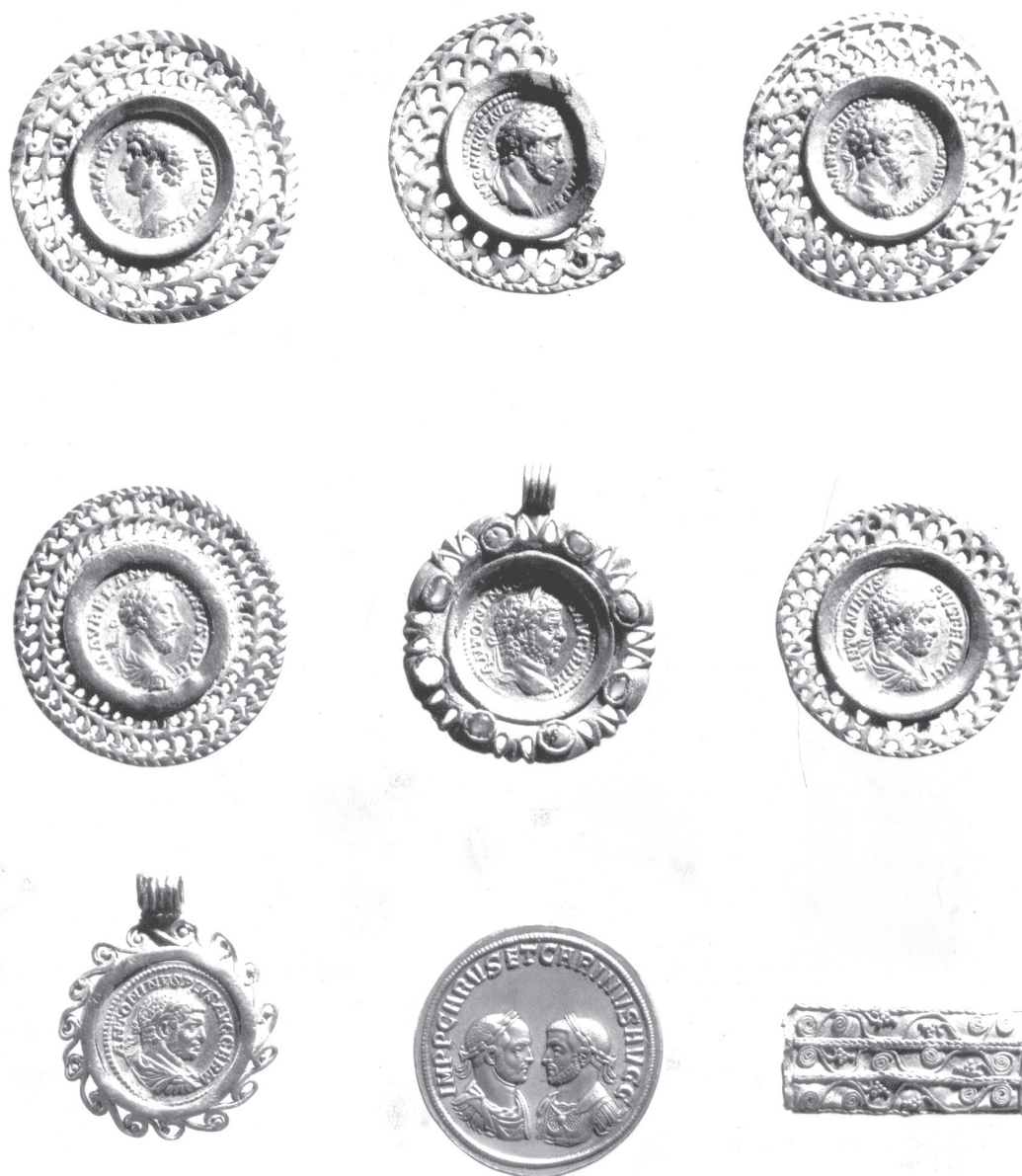
Sl. 9. Uokvireni novac i medaljon Kara i Karina: (I 16415; s lijeva na desno:) KHMW, inv. br. 32397, 32398, 32399/32400, 32401, 32402/32403, 32467, VII B111.