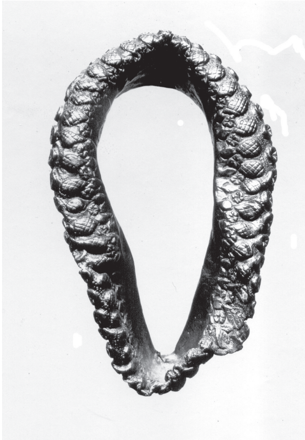
Sl. 5. Narukvica, šuplja, deformirana (II 597), KHMW, Inv. br. VII B 17 (ARNETH 205).

Fig. 5. Bracelet: hollow, deformed (II 597), KHMW, Inv. no. VII B 17 (ARNETH 205).