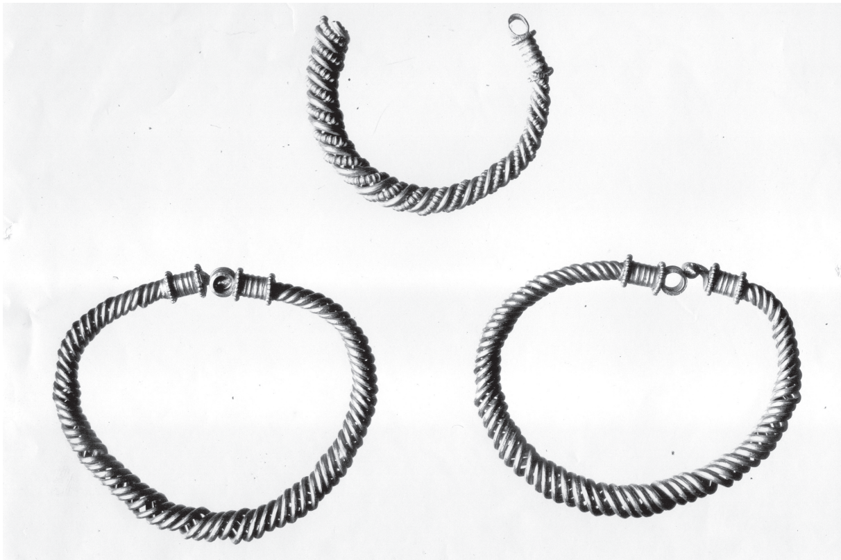
Sl. 4. Narukvice od savitljive zlatne žice, KHMW (ARNETH 202, 302, 201).