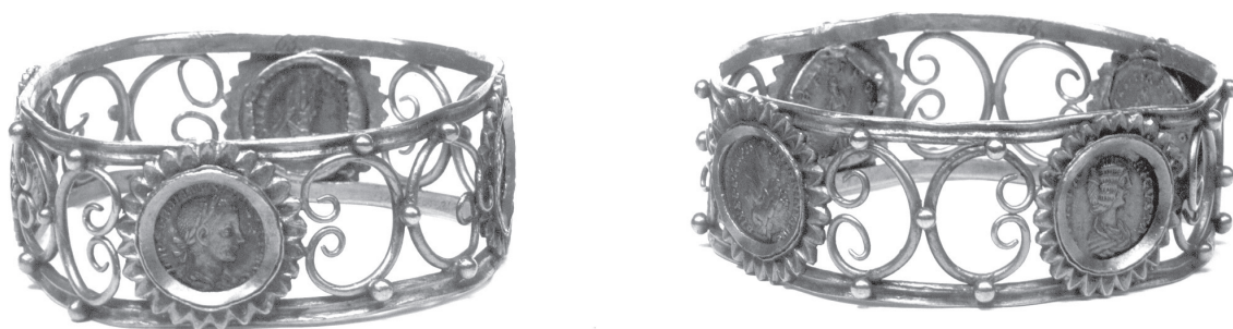
Sl. 7. Narukvice s uokvirenim novcem (I 701); KHMW, Inv. br. B 65 (73 mm), B66 (77 mm). Fig. 7. Bracelets with framed coins (I 701); KHMW, Inv. no. B 65 (73 mm), B66 (77 mm).

Perlenrand auf beiden Seiten. Vorzügliche Erhaltung. Gold,; 33 Mm Durchmesser, 1.5 Mm dick, 27.480 Gr.