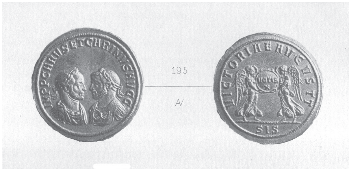
Sl. 10. Zlatni medaljon Kara i Karina (F. KENNER, 1887).