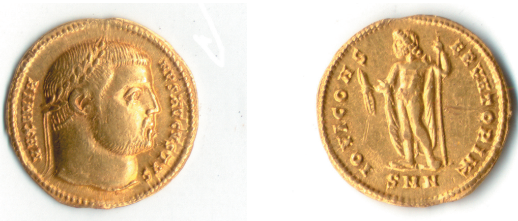
Sl. 1. Aureus Maksimijana, AMZ inv. br. C2848. Fig. 1. Aureus of Maximianus, AMZ inv. no. C2848.