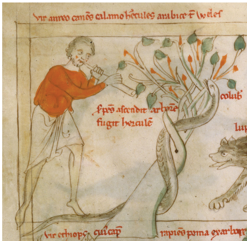
4. Heraklo i zmija, minijatura iz rukopisa Liber Astrologiae (prva polovica XIII. st. Pariz, Bibliothèque nationale , fol.12).

Fig. 4. Hercules and the snake, miniature from the manuscript Liber Astrologiae (the first half of the 13 th century, Paris, Bibliothèque nationale , fol.12).