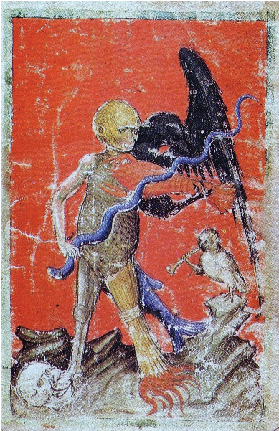
Sl. 5. Čudovište s majmunskom glavom iz rukopisa Aurora consurgens (početak XV. st. Zürich, Zentralbibliothek Rh172, fol.1 r-38 r).