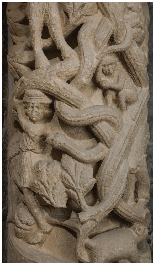
Sl. 2. Čovjek, zmija i majmun. Fig. 2. Man, snake and monkey.

Heraklo se prikazuje kako kleči sasvim gol, s toljagom u desnoj ruci kojom zamahuje prema zmiji dok u drugoj drži lavlje krzno. 15 Heraklo je primjerice tako predstavljen i na čuvenom plaštu cara Henrika II. Zajedno s drugim astralnim prikazima, uz njegov je lik i tekst