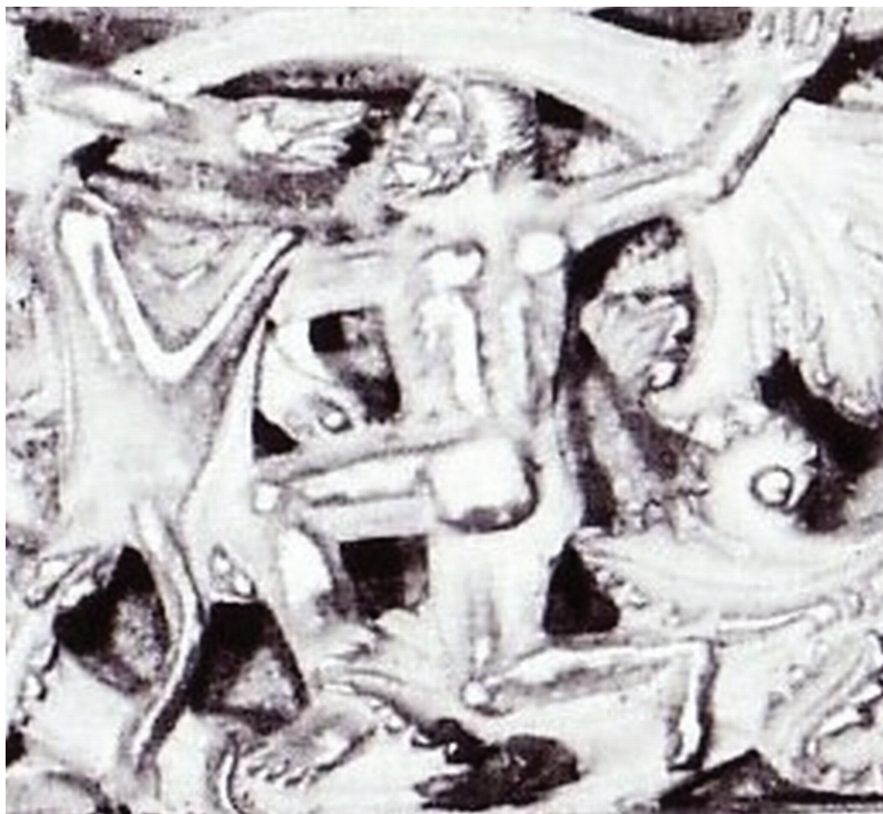
Sl. 3. Heraklo koji napada zmiyu, bjelokost s prijestolja sv. Petra (prijestolje Karla Čelavog, IX. st. Rim, Vatikan).

Fig. 3. Hercules attacking a snake, ivory from the cathedra of St. Peter (throne of Charles the Bold, 9 th century, Rome, Vatican).