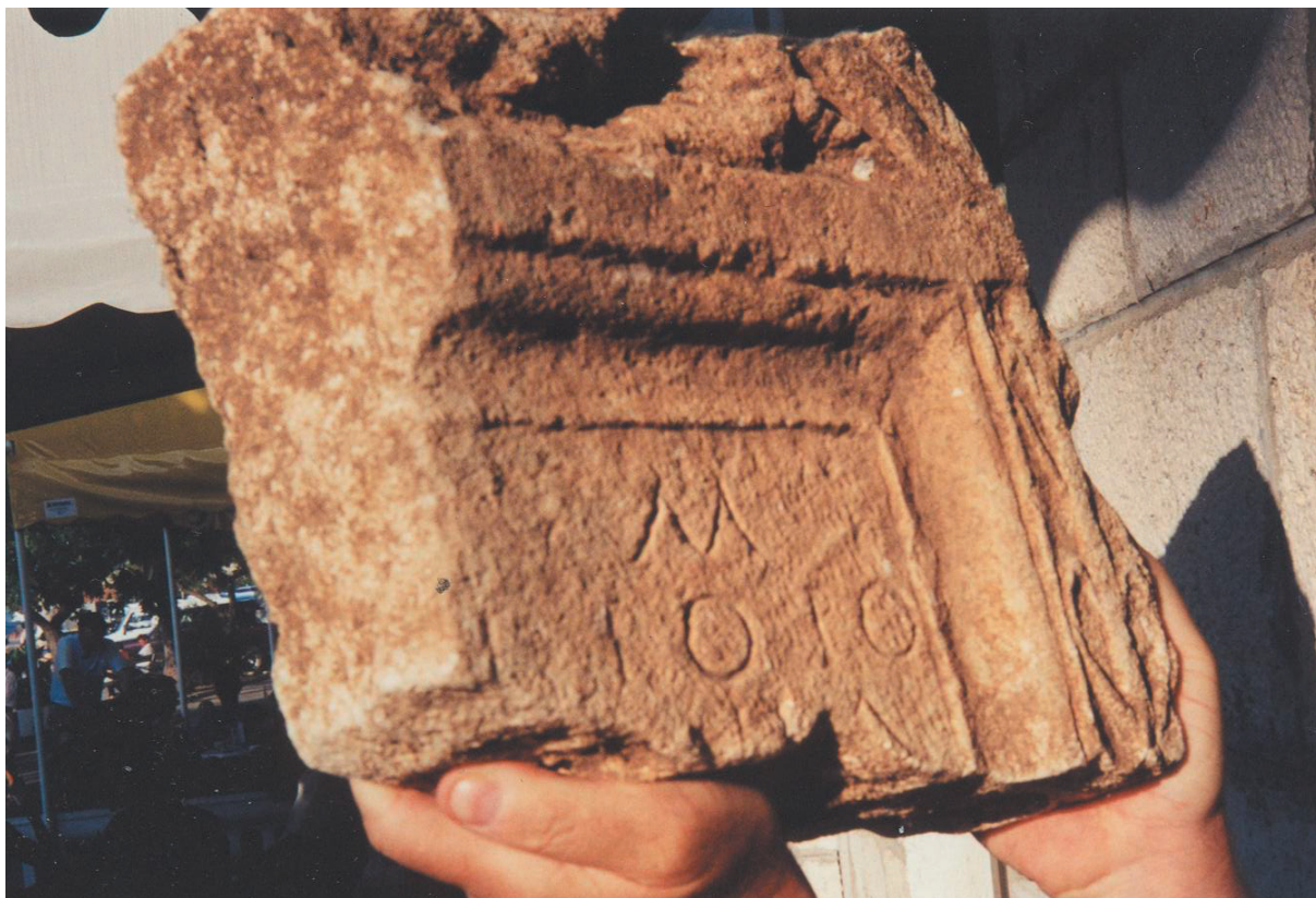
Fig. 5. Trpanj (Pelješac): frammento di stele funeraria. Fig. 5 Trpanj (Pelješac): Frammanet of a stele.