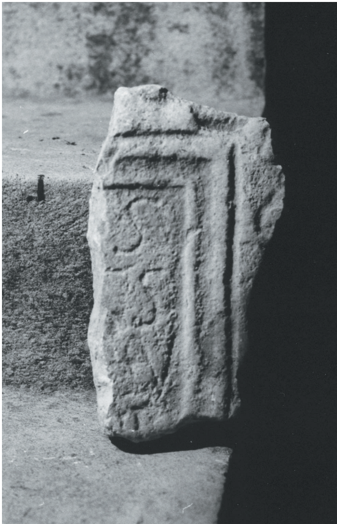
Fig. 2. Janjina (Pelješac): frammento d'iscrizione romana.

Fig. 2 Janjina (Pelješac): fragment of a Roman inscription.