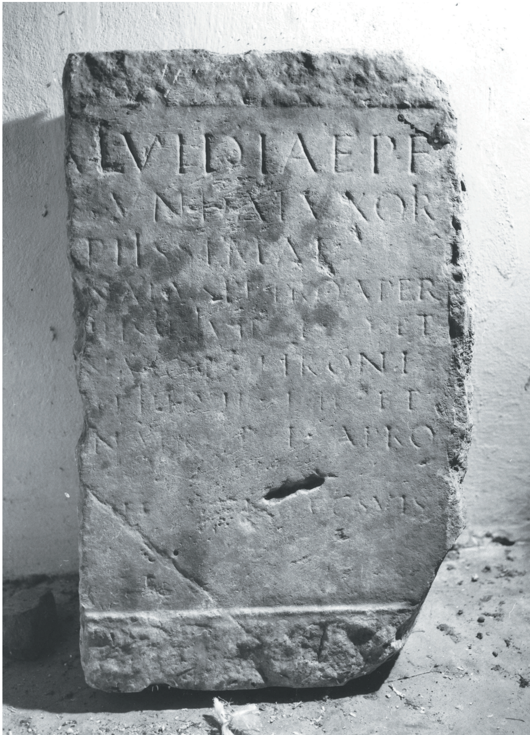
Fig. 1. Janjina (Pelješac): epigrafe di Calvidia Secunda. Fig. 1 Janjina (Pelješac): inscription of Calvidia Secunda.