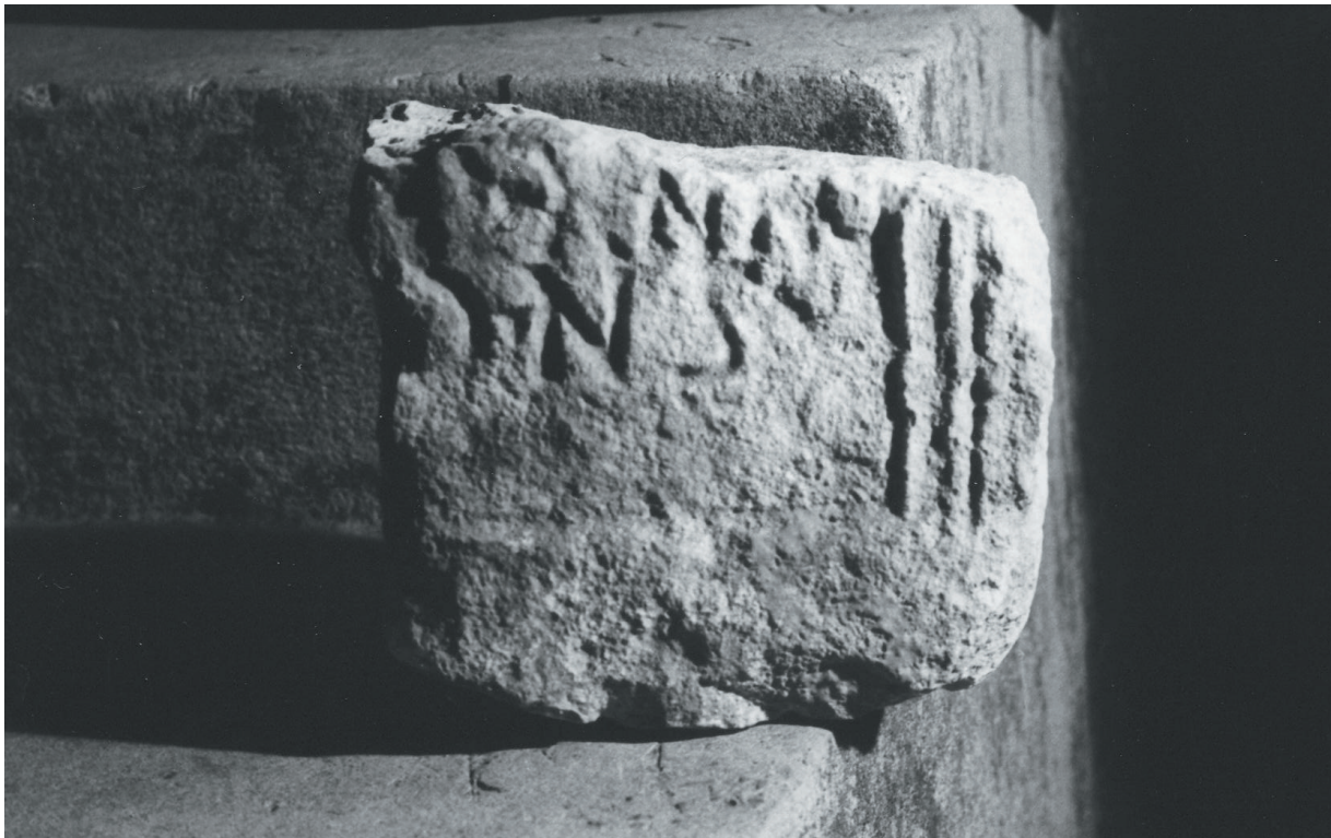
Fig. 4. Janjina (Pelješac): frammento d'iscrizione romana.