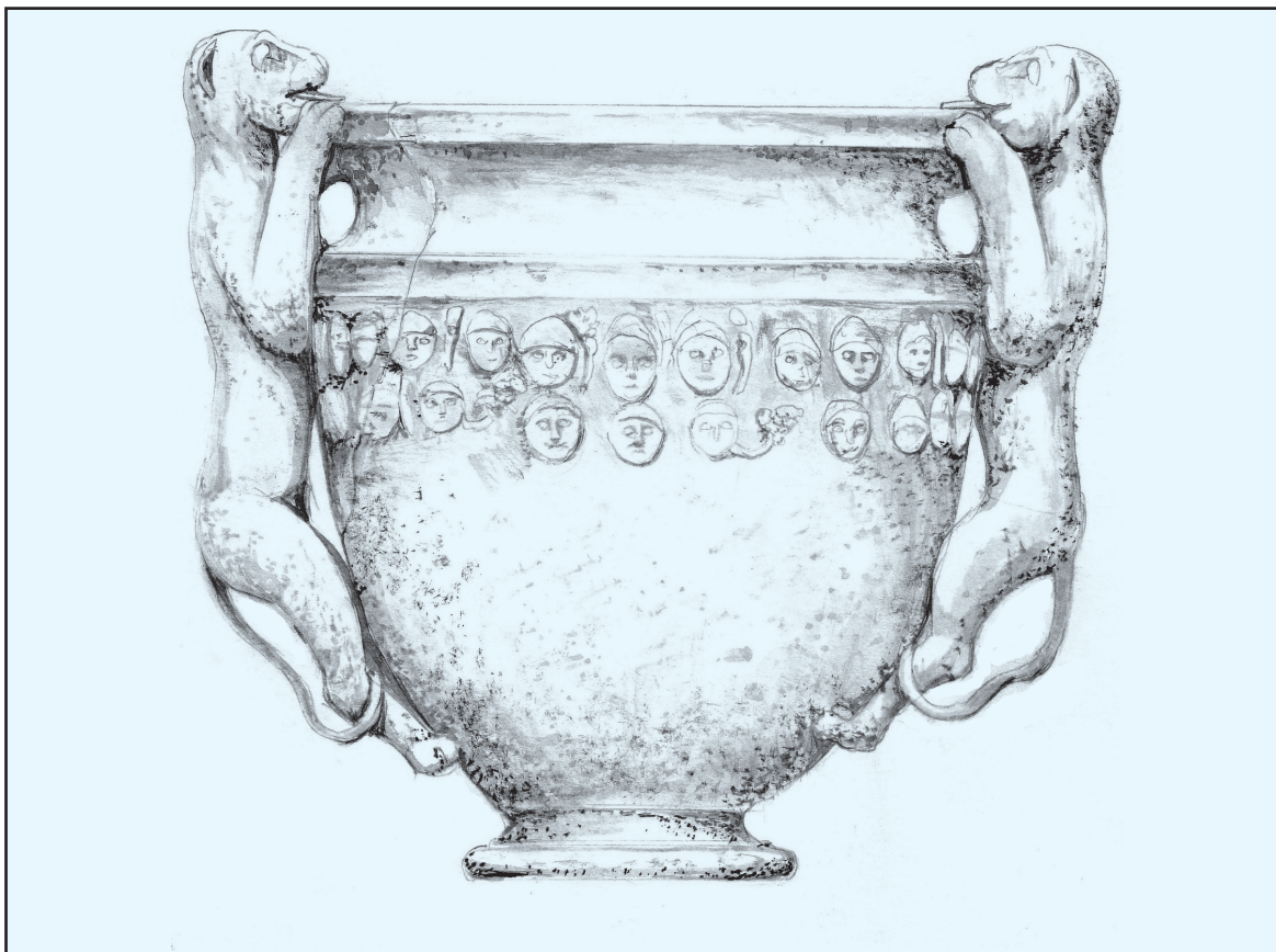
Sl. 8. Rekonstrukcija kultne posude iz Aserije Fig. 8. reconstruction of the cult vessel from Asseria

koje su činile dekoraciju neke prostorije, pa možda čak i svetišta. 38 U drugoj polovici 1. i početkom 2. st. u Aseriji se rade velike izgradnje povezane s postizanjem gradskog statusa, te se uz spomenuti forum s okolnim prostorijama grade i monumentalna gradska vrata u čast cara Trajana (113. godine). 39 Uzimajući u obzir spomenute podatke koji govore o velikoj građevinskoj djelatnosti u Aseriji u doba cara Trajana i činjenicu da upravo i sam car Trajan propagira i štuje kult boga Libera, možemo reći, da ukoliko svetište na aserijatskom forumu pripada bogu Liberu, da je ono podignuto upravo u doba njegove vladavine.