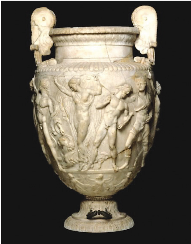
Sl. 4. Townley vaza, British Museum, London, 2. st. Fig. 4. The Townley Vase, British Museum, London, 2 nd century.

grčki i rimski majstori služe za svoju izradu kvalitetnijim i otpornijim materijalom, poput mramora, možda je aserijatska vaza produkt jedne lokalne radionice koja samo imitira rimske uzore.