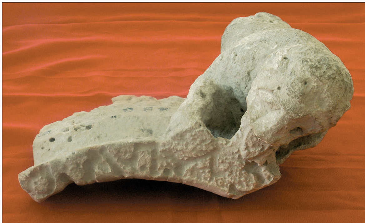
Sl. 1a. Kulna posuda iz Aserije: posvetni natpis i ručka u obliku pantere.

Fig. 1a. The cult vessel from Asseria: the dedicatory inscription and the panther-shaped handle.