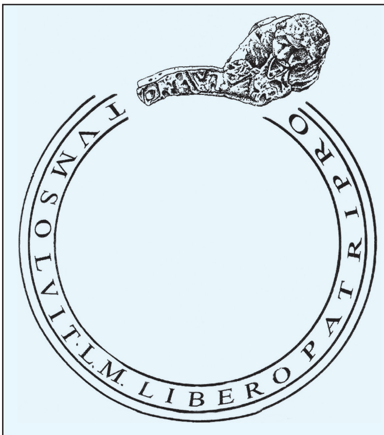
Sl. 7. Rekonstrukcija natpisa na obodu kultne posude iz Aserije.

le su se najvažnije prostorije foruma, među kojima je središnje mjesto zauzimala prostorija označena kao C4 na Slici 6. 32 Uz njen stražnji zid pronađena je široka baza, vjerojatno postolje za kulturni kip. 33 Nesumnjivo je riječ o istom postolju koje navode