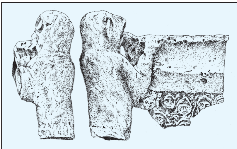
Sl. 5. Kulturna posuda iz Aserije: reljefni prikaz.