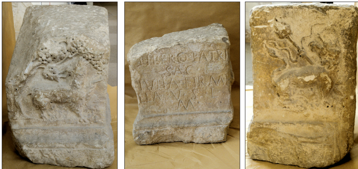
Sl. 2. Žrtvenik Julije Firmile (na lijevoj bočnoj strani prikaz jareta koji jede grožđe ispod loze, a na desnoj bočnoj strani prikaz pantere i Liberova štapa, tirsosa).

Fig. 2. The altar of Iulia Firmilla (on the left lateral side a depiction of a kid eating grapes below a vine, and on the lateral side a depiction of a panther and Liber's staff, the thyrsus).