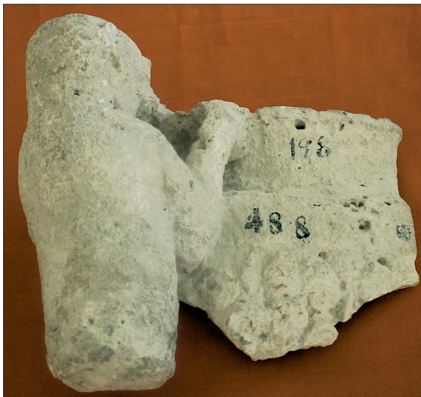
Sl. 1b. Kulna posuda iz Aserije: reljefni prikaz s dionizijskim (Liberovim) motivima.

kod autohtonog stanovništva, restitucija oblika Proculus je logična. 11 Spomenuti ulomak nadgrobnog spomenika spominje jednog člana obitelji Iulius koji nosi kognomen Proculus , L. Iulius Proculus . 12 Utvrđeno je da su nosioci tog gentilicija u Aseriji bili autohtonog podrijetla te su pripadali vrhu lokalne aristokracije. 13 Pretpostavimo li nadalje, da je