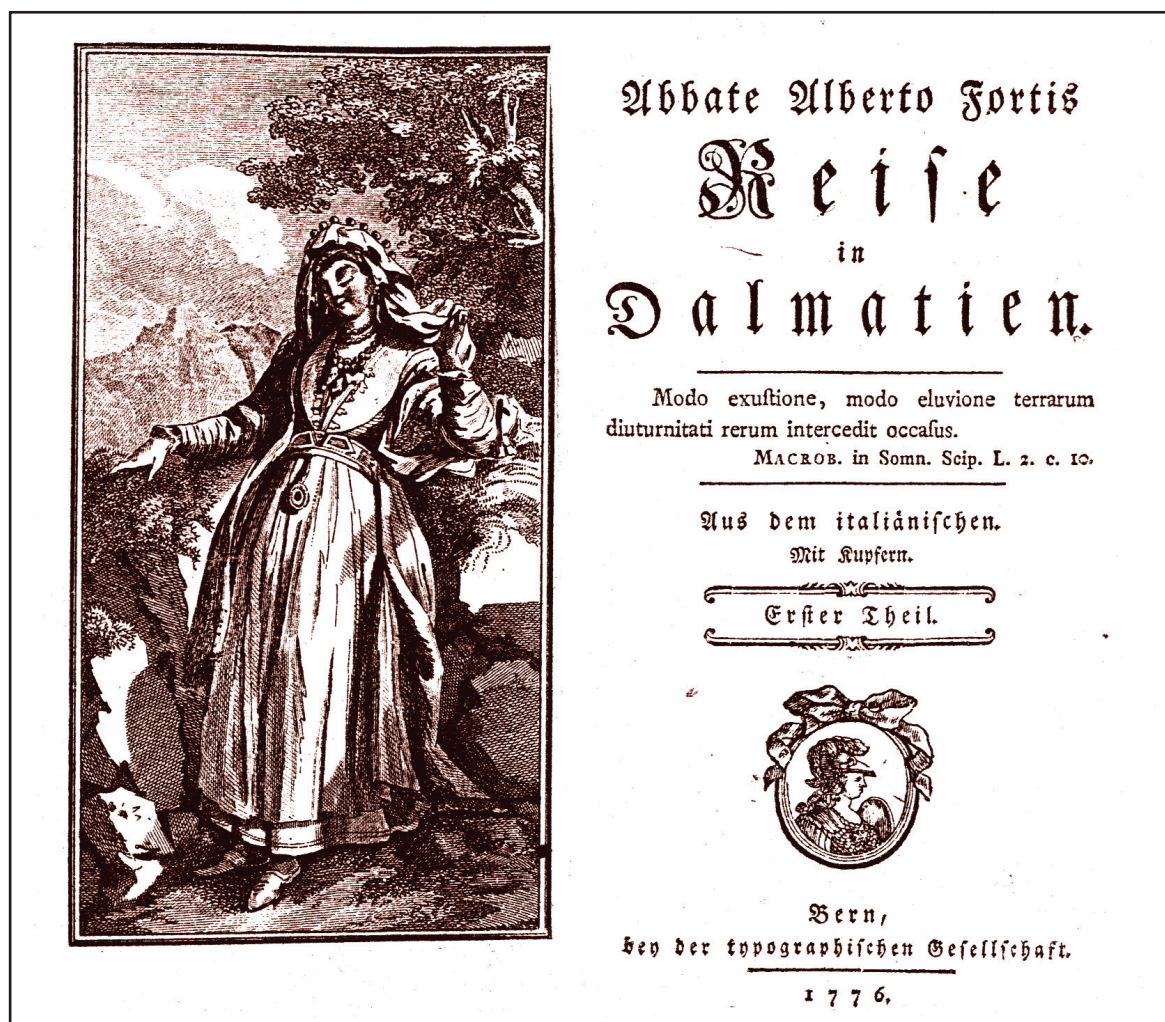
Sl. 3. Abbate Alberto Fortis, Reise in Dalmatien , Bern, 1776.