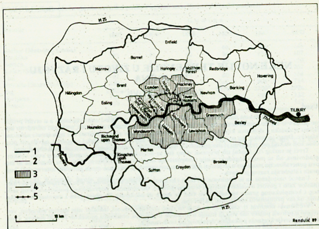
Graf 1. Gradsko područje Londona, osnovna podjela. 1. granice grada, 2. granice općina, 3. uže gradsko područje (ILEA), 4. granica druge varijante užeg gradskog područja (grupe A općina), 5. granica centralnog područja

Graph 1. City area of London, basic distribution (1. City limits, 2. Townships limits, 3. Main City area (ILEA), 4. Limits of second variant of main City area (groups of «A» townships), 5. Central area limit)