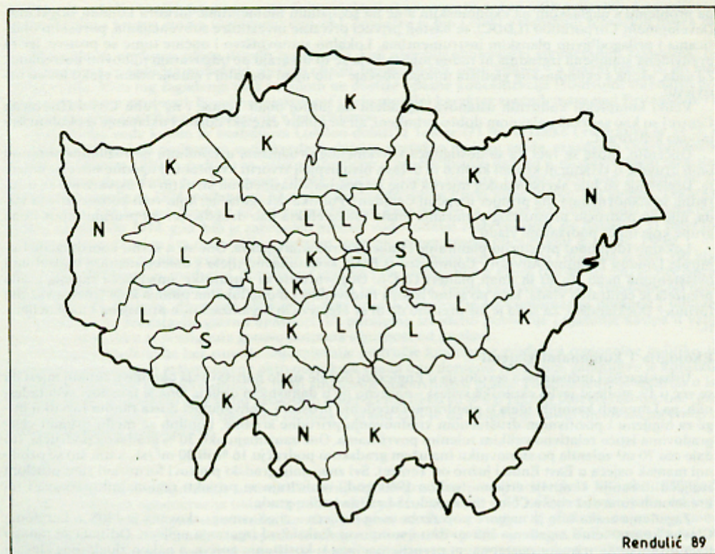
Graf 4. Politička kontrola londonskih općina početkom 1988. godine. K – apsolutna većina općinskih odbornika pripada Konzervativnoj stranci, L – apsolutna većina općinskih odbornika pripada Laburističkoj stanci, S – apsolutna većina općinskih odbornika pripada savezu liberala i socijaldemokrata, N – ni jedna stranka nema apsolutnu većinu odbornika (koalicija ili drugi aranžmani)

Graph 4. Political control of London townships, in the beginning of 1988.