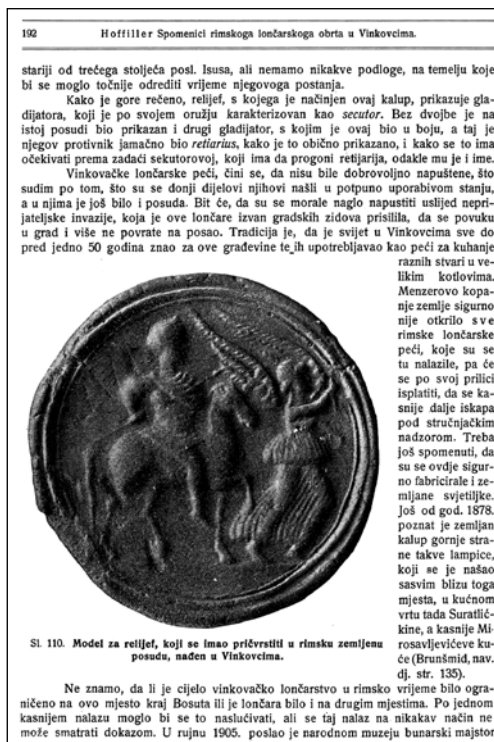
Jedna stranica Hoffillerovog članka u Vjesniku o rimskom lončarskom obrtu u Vinkovcima objavljena 1919.