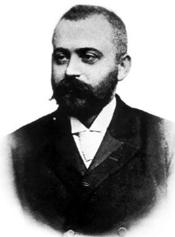
Dr. Josip Brunšmid, fotografija oko 1910 godine.

Josip Brunšmid (Vinkovci, 10. II. 1858.- Zagreb, 29. X. 1929.) bio je stariji pa ga zato prvoga i spominjemo. Povodom 70 -godišnjice života 1928. izašlo je više napisa o Brunšmidu. Pisao o njemu i Viktor Hoffiler kao o velikom arheologu i numizmatičari godinu dana prije Brunšmidove smrti. 3 O Brunšmidu kao jednom od najistaknutijih arheologa pisali su tom prilikom i Grga Novak, Mihovil Abramić i Trpimir Macan. 4 Kada je godinu dana poslije toga Brunšmid umro nastali brojniji novi radovi o Brunšmidu, na što je vjerojatno utjecala šestosiječanjska diktatura koja je zaustavila mnoge kulturne projekte i zatvorila vrata mnogih kulturnih institucija. Nije više