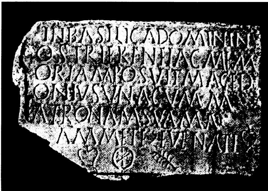
SLIKA 2 - Natpis pronaden u spomen-bazilici svetog Ireneja u Sr. Mitrovici. Dobro se čita: