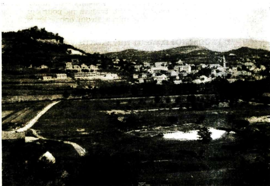
Pogled na Sinj

Prva je tekla linijom Knin — Sinj — Trilj — Imotski. Druga se protezala osnovnom linijom: Split — Klis — Sinj — Livno. U svojoj osnovi tekle su pravcima rimskih puteva i cesta, a Sinjska je krajina bila oduvijek njihovo važno raskršće. Njima su uglavnom kretali i promet robe, i promet i kontakti stanovništva, a dakako i odredi i vojske osvajača. Povezujući najkraćim mogućim putem srednjedal-