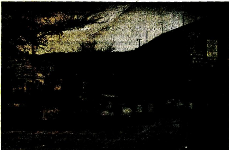
Foto: J. Miličević, 1966. Stado ovaca u selu Han (Institut za narodnu umjetnost)

nastalo dosta i trajnih naselja, u kojima se i zimi držala stoka. No, najveći dio blaga izgonio se na planinu samo ljeti, i to u vremenu od sredine juna do blizu sredine septembra mjeseca. 231 Red i običaji, vezani uz taj izgon stoke, 232 oblikovali su se stoljećima, na temeljima sistema proizvodnje koji se vrlo malo mijenjao, čvrsto prožet i sapet