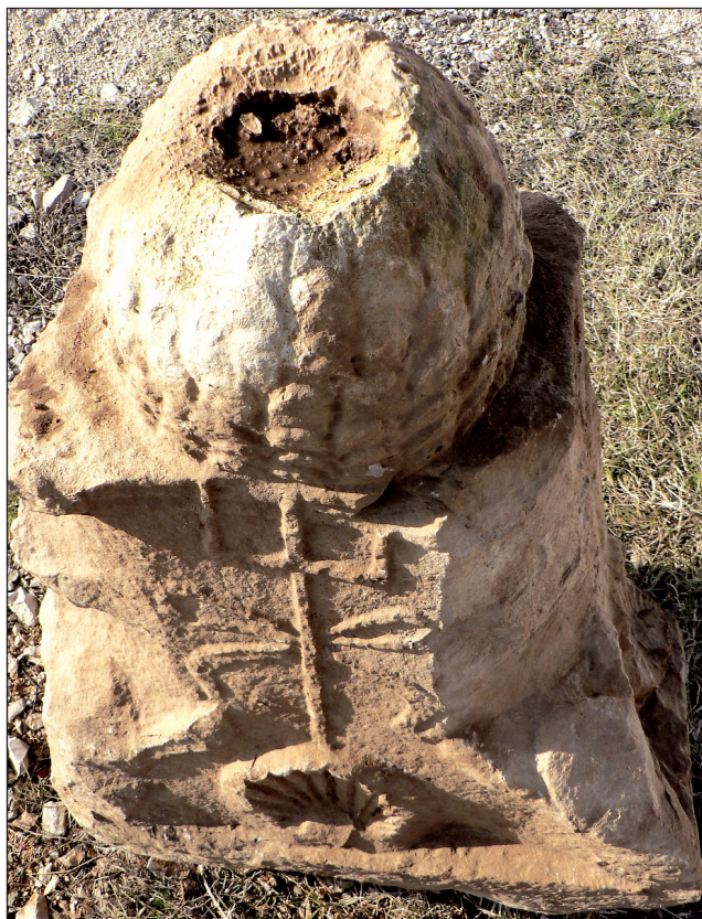
Sl. 9. Plitka udubina u češeru spomenika Fig. 9. The shallow hollow in the pinecone ensign of the monument

čajno, a možda i ne, trozubac flankiran dupinima javlja se i na arhitravu nadgrobne stele Prostonije Prokule uzidane u Gašpinoj mlinici u Solinu, datirane također u doba Trajana. 22 Prema tome, očito je kako i aserijski primjer istoga motiva valja datirati u razdoblje njegove pune popularnosti, tj. posljednju četvrtinu 1. ili sam početak 2. st. po Kr.