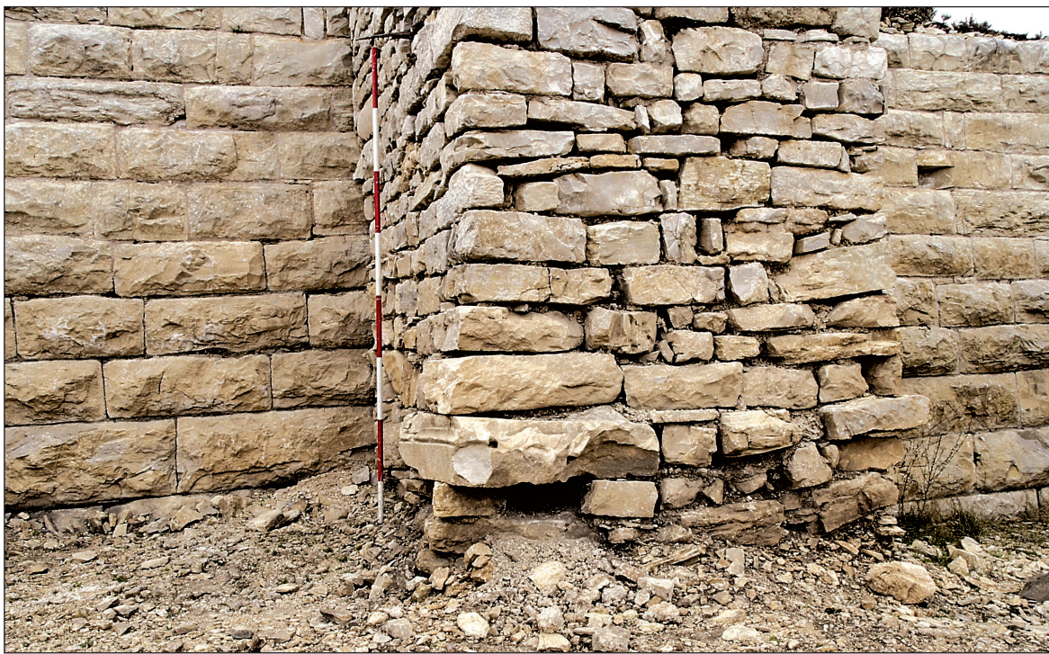
Sl. 1. Kasnoantički kontrafor sa spolijem Fig. 1. Late Roman buttress with spolia

i zamišljenoj osi cjelokupnoga prikaza, što nedvosmisleno upućuje da joj je odgovarala ista na suprotnoj strani koja nije sačuvana. Vjerojatno su obje vitice imale karakteristične vrhove s polupalmetama. Smisao cijeloga prikaza možda treba vidjeti u iluziji prepleta dviju akantovih vitica koje su podignute i učvršćene o nekakvu alku ili čavao na zidu, odnosno stropu.