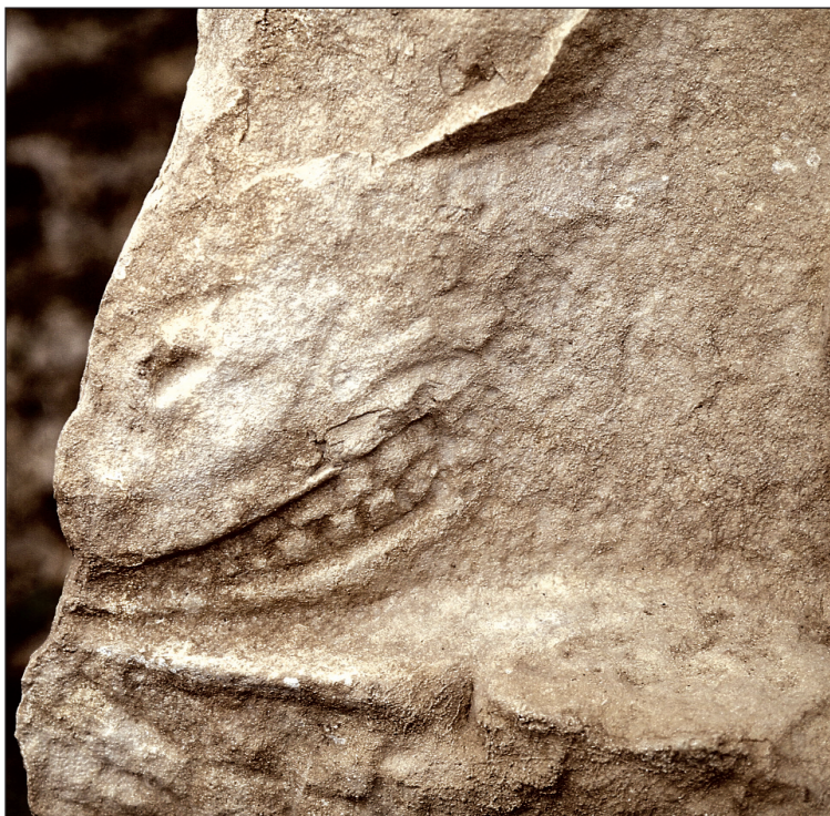
Sl. 8. Glava ribe na prednjem dijelu desne bočne stranice Fig. 8. The fish head on the front section of the right side

Formativne značajke pokazuju da naše primjerke ne treba promatrati u istom svjetlu. Aserijski komad s dupinama premalen je da bi ga se povežalo s nadgrobni edikulama, makar i onima reduciranim na pročelje nadgrobnog hrama i stupove. I kod takvih