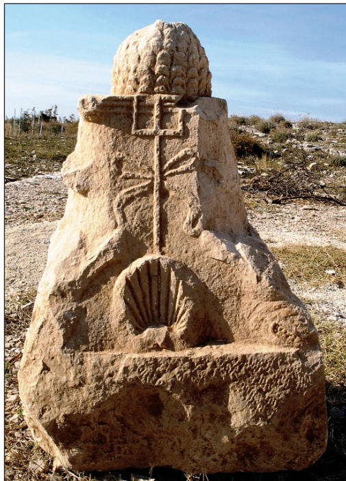
Sl. 6. Piramidalno krunište iz kasnoantičkoga bedema nakon vađenja i čišćenja

Fig. 6. The pyramidal cusp from the late Roman wall after removal and cleaning