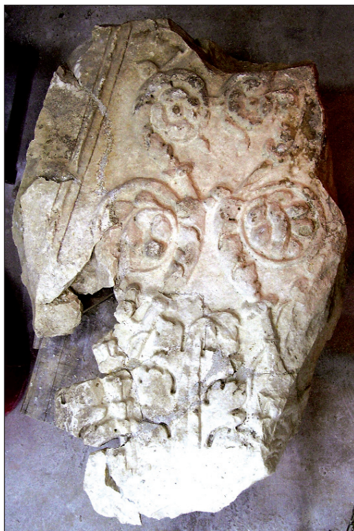
Sl. 2. Fragment iz kasnoantičkoga kontrafora nakon spajanja

Fig. 2. The fragment from the late Roman buttriss after being joined