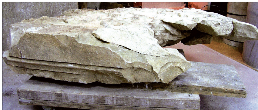
Sl. 3. Lijeva strana fragmenta iz kasnoantičkoga kontrafora

zakošenih uglova. Površina mu je zaravnanom udarcima zubatog dlijeta i bez dekoracije. Središnji i ujedno najviši dio je slikovno polje, po dubini sniženo u odnosu na donje polje i dodatno zakošenih uglova. Na vrhu mu je trostruka trakasta profilacija koja