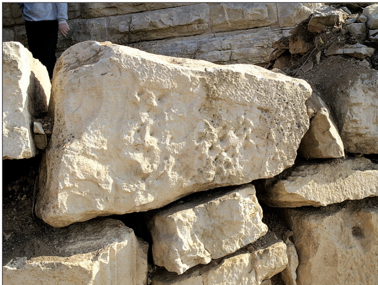
Sl. 5. Detalj kasnoantičkoga bedema s uzidanim spolijem Fig. 5. Detail of the late Roman wall with immured spolia

/Sl. 3/. Krasi je jednostavna ravna traka identična onoj s naličja i "S" profil s njezine unutrašnje strane. Od profila do stražnjeg ruba spomenika svega je četiri-pet centimetara zaglačane površine kamena, iz čega slijedi zaključak da njegova pojava nema svoje unutarnje logike ili opravdanja. Čemu profil ako nije ništa obrubljivao? Jedino je razumno objašnjenje da ni lijeva bočna stranica nije sačuvana u punoj širini, te da je po svojoj formi, a vjerojatno i dekoraciji, od-