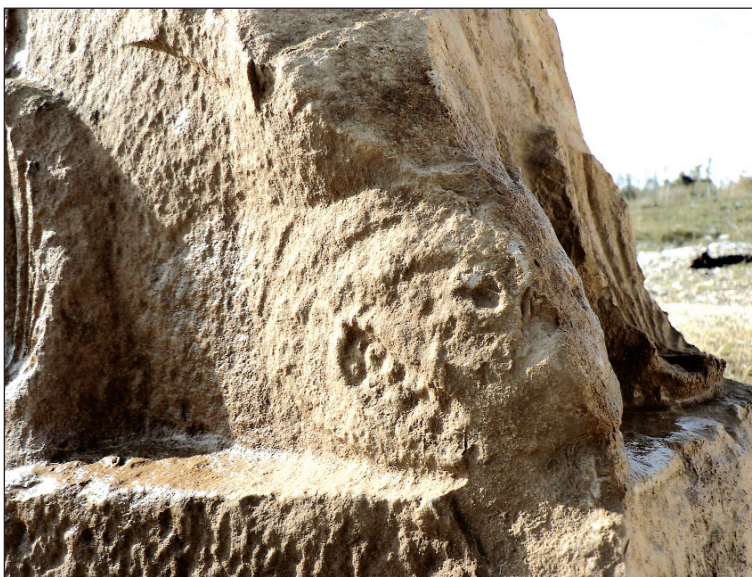
Sl. 7. Detalj ugla prednje i desne bočne stranice kruništa s glavama riba Fig. 7. Detail of the corner of the front and right sides of the cusp with heads of fish

Najpoznatiji i vjerojatno najmonumentalniji primjer višekratne grobnice s ravnim piramidalnim kruništem jest mauzolej pekara M. Vergilija Eurisaka u Rimu, čije bočne i stražnja strana i danas stoje u neposrednoj blizini Porta Maggiore. 4 Visinom skromniji (14,1 m), ali još uvijek izrazi-