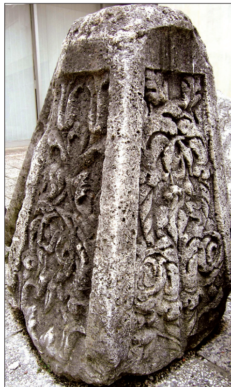
Sl. 10. Piramidalno krunište iz lapidarija Arheološkog muzeja Zadar

Jednako tako podsjeća i na obrubne vrpce punjene istim motivom s velikog fragmenta nadgrobne are, kojemu sam nedavno pokušao dati dopunjeno tumačenje. 26 U oba se slučaja inače radi o kreacijama s kraja 1. ili početka 2. st. po Kristu. Prema tome, lokalne usporedbe postoje i u javnoj arhitekturi i u sepulkralnoj plastici. Od daljnjih je usporedbi posebno zanimljiv fragment piramidalnog kruništa iz Pule, za koji Fischer smatra kako pripada velikoj nadgrobnoj edikuli. 27 Po načinu isprepletanja vitica on je blizak i zadarskom reljefu. Zadarski je pak reljef nešto malo mlađi i od aserijskog i od pulskog, i vjerojatno datira