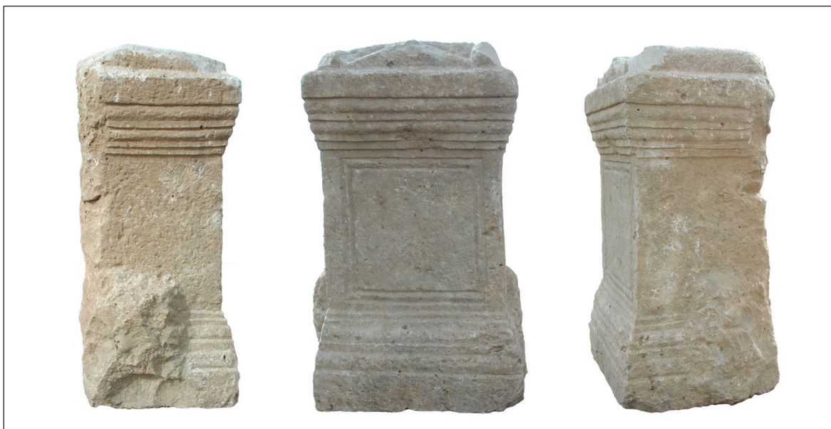
Sl. 12. Anepigrafska nadgrobna ara - lijeva bočna, prednja i desna bočna strana Fig. 12. Anepigraphic sepulchral altar - left lateral, front and right lateral sides

The altar is 94 cm high, 53 cm wide and 44 cm thick (for more detailed dimensions, see here, Appendix ). It is a monolithic tripartite altar belonging to the type with frames /Fig. 12; cf. n. 3/. The base and cornice are to some extent differently moulded than the ones of the Adiutor's ara and are somewhat unusual: after the low plinth the moulding has two cymae rectae one above the