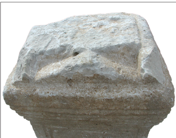
Sl. 14. Anepigrafska nadgrobna ara - gornja strana Fig. 14. Anepigraphic sepulchral altar - top side

nedovršenom i gornju površinu are. Ondje je bio započeo izrađivati slobodno-stojeći trokutasti zabat s akroterijima, koji su bili slični onima na Adjutorovoj ari, ali ih nikad nije dovršio: akroteriji su ostali tek naznačeni u površini kamena /Sl. 14/.