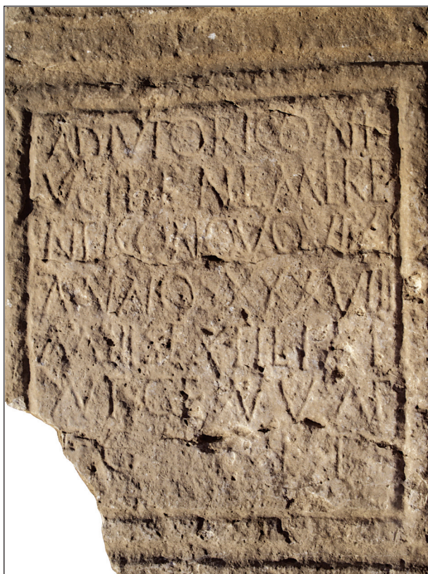
Sl. 10. Adjutorova nadgrobna ara - natpis Fig. 10. Sepulchral altar of Adjutor - inscription

kvom mišljenju, u biti dokazuje sasvim suprotno. U sredini osmog retka - točno ispod slova ENV iz 7. retka - nalazi se povećće oštećenje na kamenu koje je moralo postojati i prije klesanja natpisa, pa je ordinator smislio način kako prevladati tu prepreku time što je slova smjestio lijevo i desno od oštećenja. Ordinator i/ili klesar ostavio je početno slovo - F - na kraju prethodnog retka, možda u nastojanju da očuva simetriju ili jednostavno zbog inercije. K tomu, ordinator je zanimljivo izabrao ne koristiti se ligaturama i minimalizirati uporabu sigli i skraćenica.