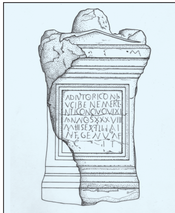
Sl. 5-5a. Adjutorova nadgrobna ara - prednja strana Figs. 5-5a. Sepulchral altar of Adiutor - front side

Relativno visok, neukrašen i vrlo stiliziran češer nalazi se iznad vrha zabata, usred gornje površine ove nadgrobne are (usp. Sl. 5-5a).