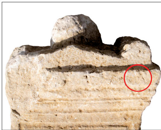
Sl. 11. Adjutorova nadgrobna ara - skraćena [D] M na gornjoj letvici

The invocation to Dis Manibus helps establishing a rough chronological framework, since the abbreviation D M