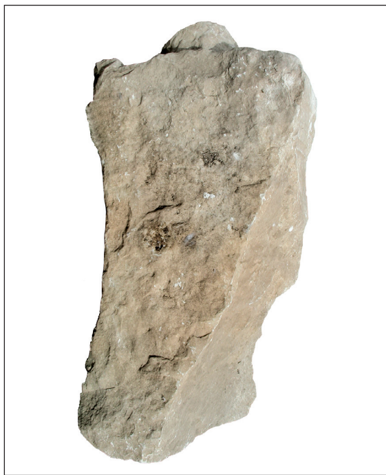
Sl. 6. Adjutorova nadgrobna ara - stražnja strana Fig. 6. Sepulchral altar of Adjutor - rear side

Slične are poznate su u svim dijelovima Rimskog Carstva, uključujući i provinciju Dalmaciju. 9 Iz Aserije je do sada bilo poznato pet, odnosno, točnije,