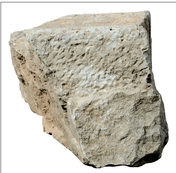
Sl. 9. Adjutorova nadgrobna ara - dno

Mjere jedne od njih, one koja je bila postavljena municipalnom magistratu Aserije G. Titiju Priscinu, bile su najmanje 182x102x89 cm; 13 još su dvije bile podjednako velike, 14 jedna neznatno manja od njih, 15 a jedna zacijelo mnogo veća. 16 Skoro sve te are - osim zadnjespomenute koja pripada tipu s orna-