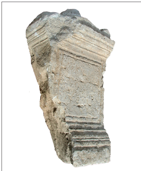
Sl. 7. Adjutorova nadgrobna ara - lijeva bočna strana Fig. 7. Sepulchral altar of Adiutor - left lateral side