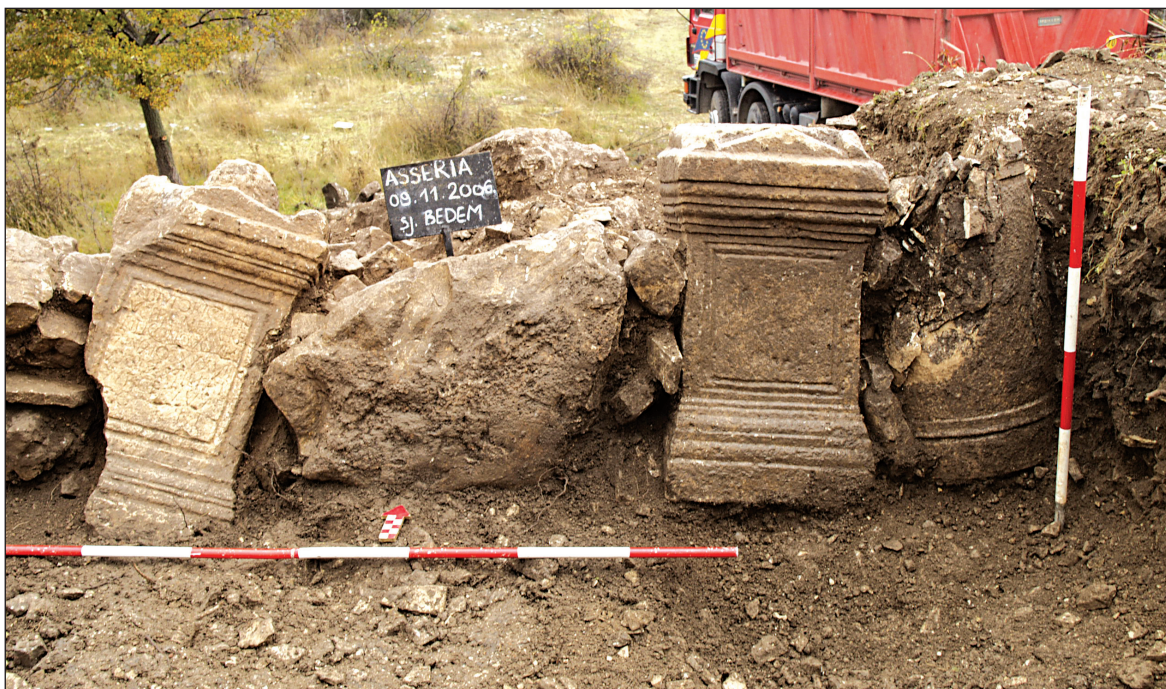
Sl. 4. Nadgrobne are u kasnoantičkoj obrambenoj strukturi