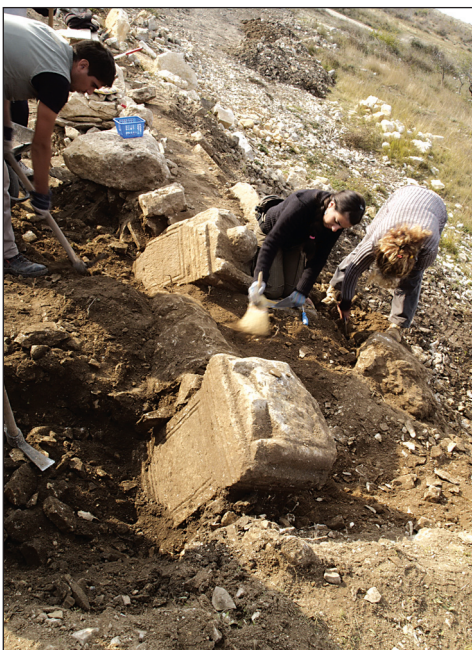
Sl. 3. Pronalazak dviju nadgrobni ara u kasnoantičkoj obrambenoj strukturi Fig. 3. Discovery of two sepulchral altars within the Late Roman bulwark

bottom part /Figs. 5-5a/. Traces of narrow stone-mason's claw are visible at the altar's lateral sides, but both gable and top surfaces are left quite uneven. Front side was finely dressed, almost polished, but now it is quite damaged partly because of the unfavourable weather conditions and partly because of stone's very flaws. Rear side has never been properly dressed; instead, it was just left roughly cut off /Fig. 6/.