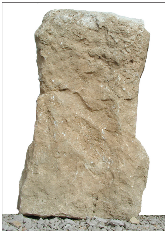
Sl. 13. Anepigrafska nadgrobna ara - stražnja strana Fig. 13. Anepigraphic sepulchral altar - rear side

Nekoliko elemenata upućuje na zaključak da je i ova nadgrobna ara stigla do svog kupca kao nedovršen proizvod. Klesar je tek grubo isklesao izbočine na obje strane (usp. ovdje, bilj. 6-8), ali je također ostavio