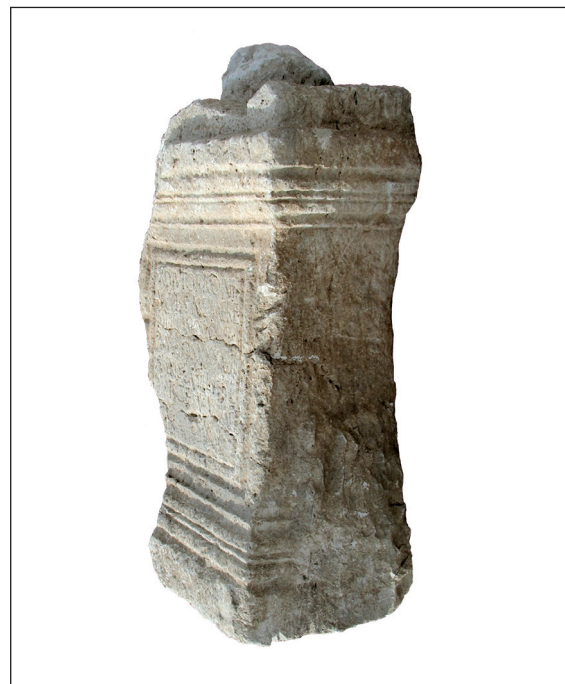
Sl. 8. Adjutorova nadgrobna ara - desna bočna strana Fig. 8. Sepulchral altar of Adiutor - right lateral side

šest, takvih nadgrobnih ara, 10 pa bi ovo bila sedma.